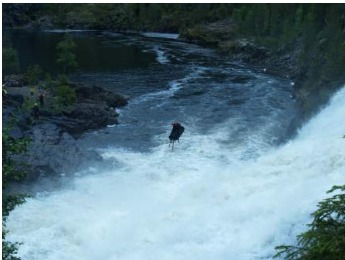
Фото 30. Переправа вещей на водопаде Маманя