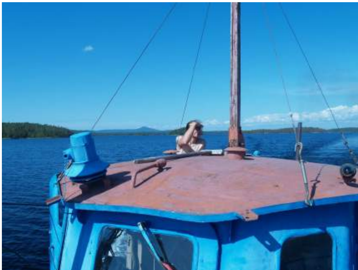
Фото 63. На катере