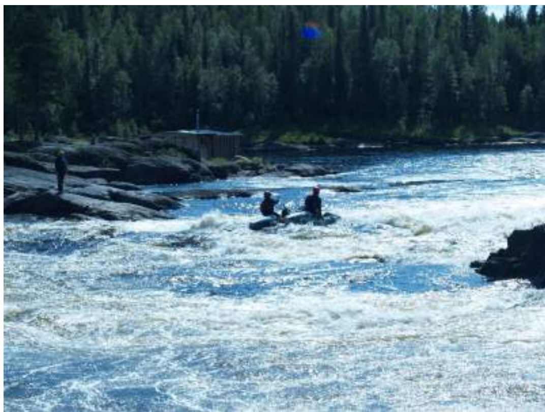
Фото 57. Прохождение порога Шляпа