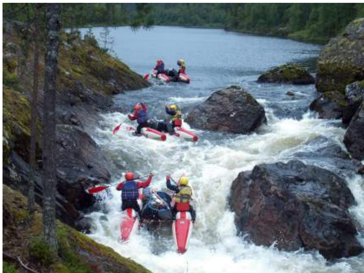
Фото 34. Прохождение порога Тесный (кинограмма)