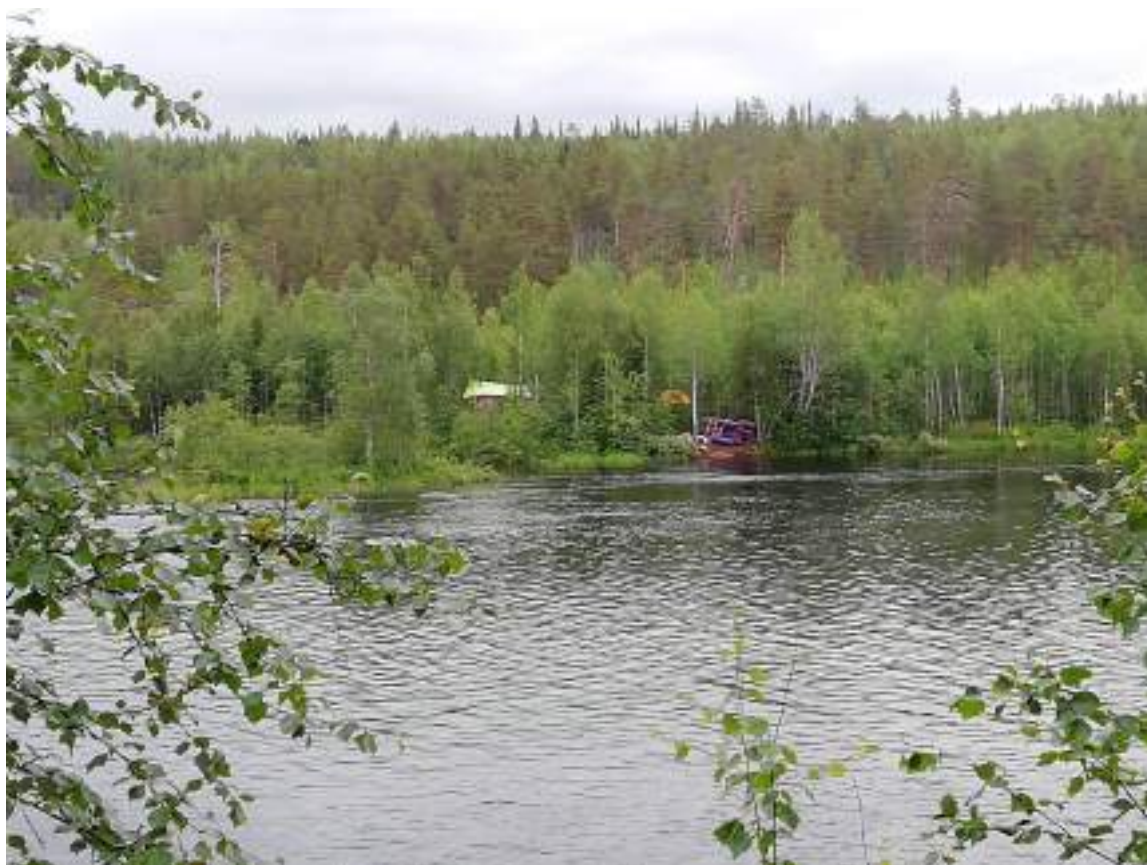
Фото 17. Вид на стоянку с другого берега