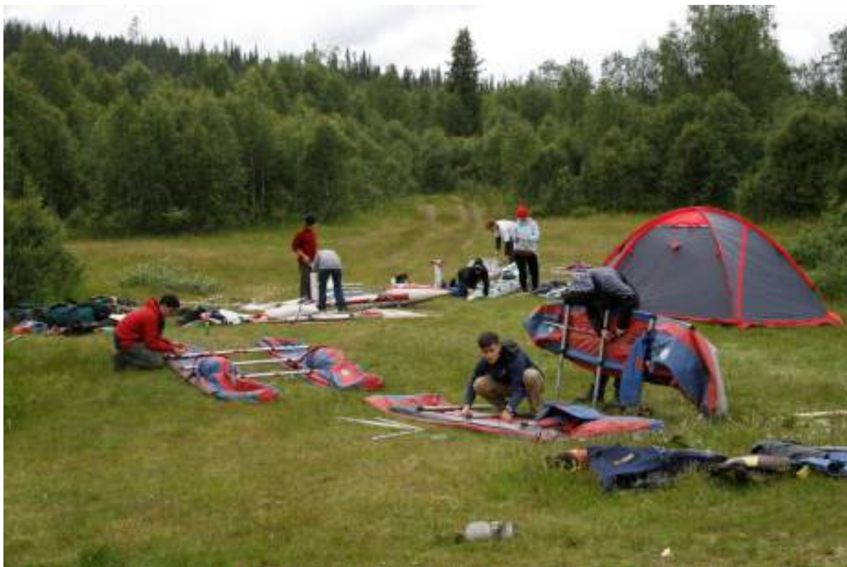
Фото 7. Станель