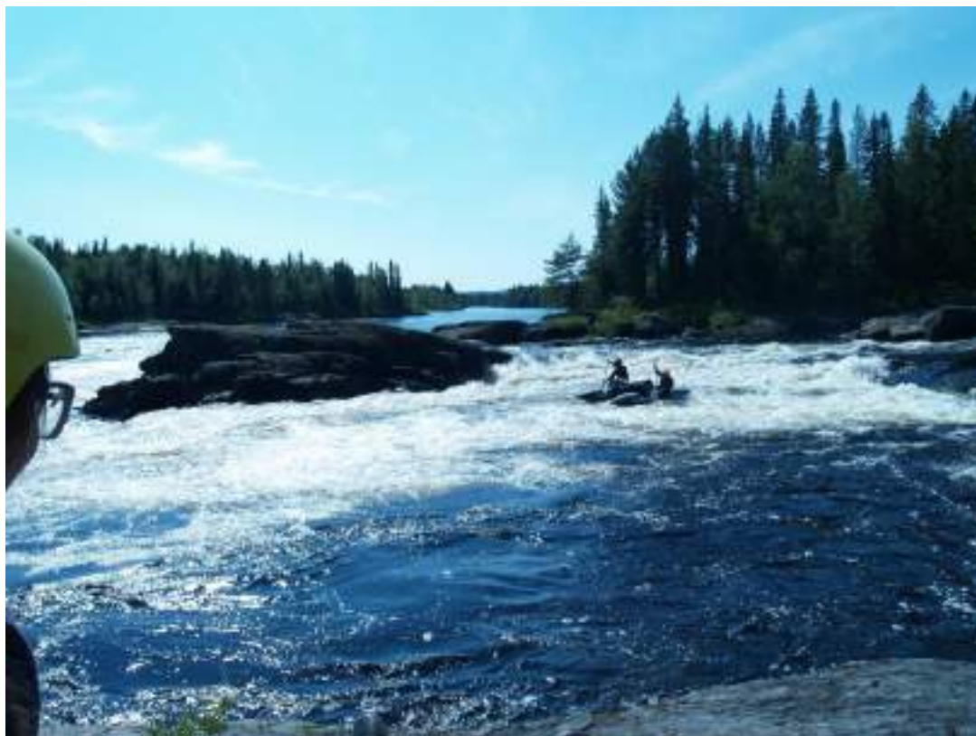
Фото 54. Прохождение порога Шляпа