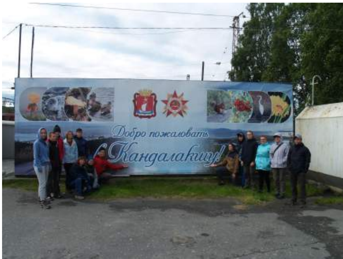
Фото 2. Общее фото в Кандалакше