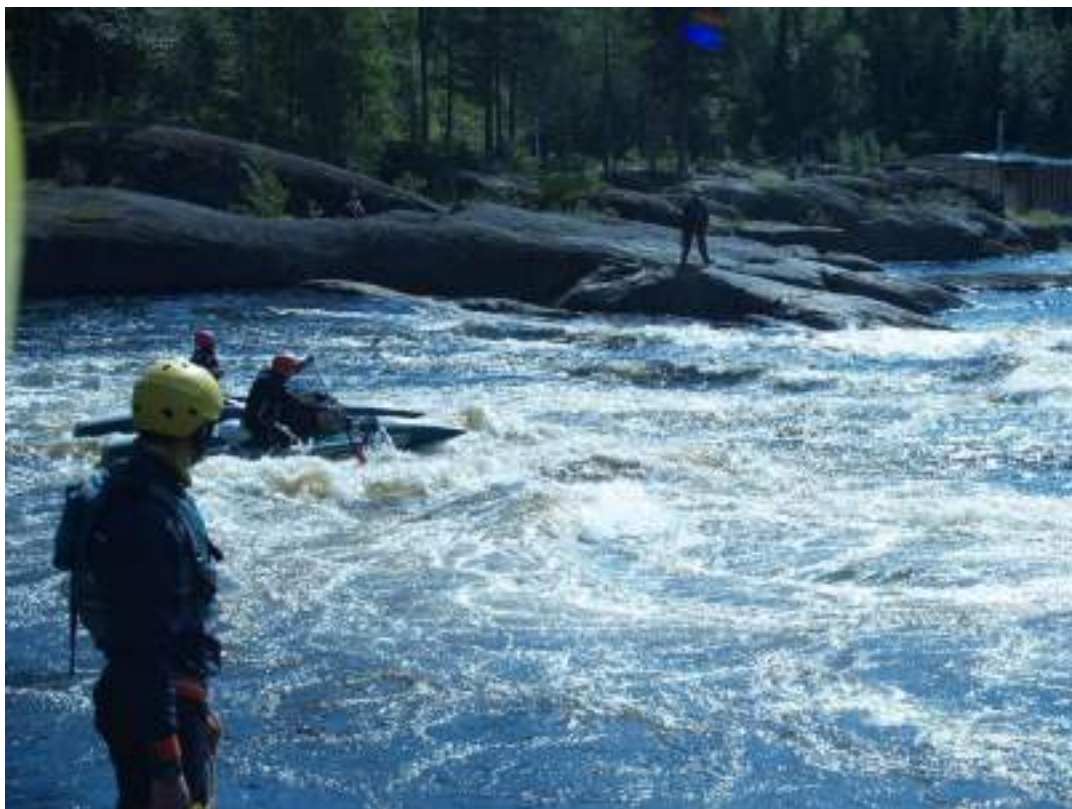
Фото 56. Прохождение порога Шляпа