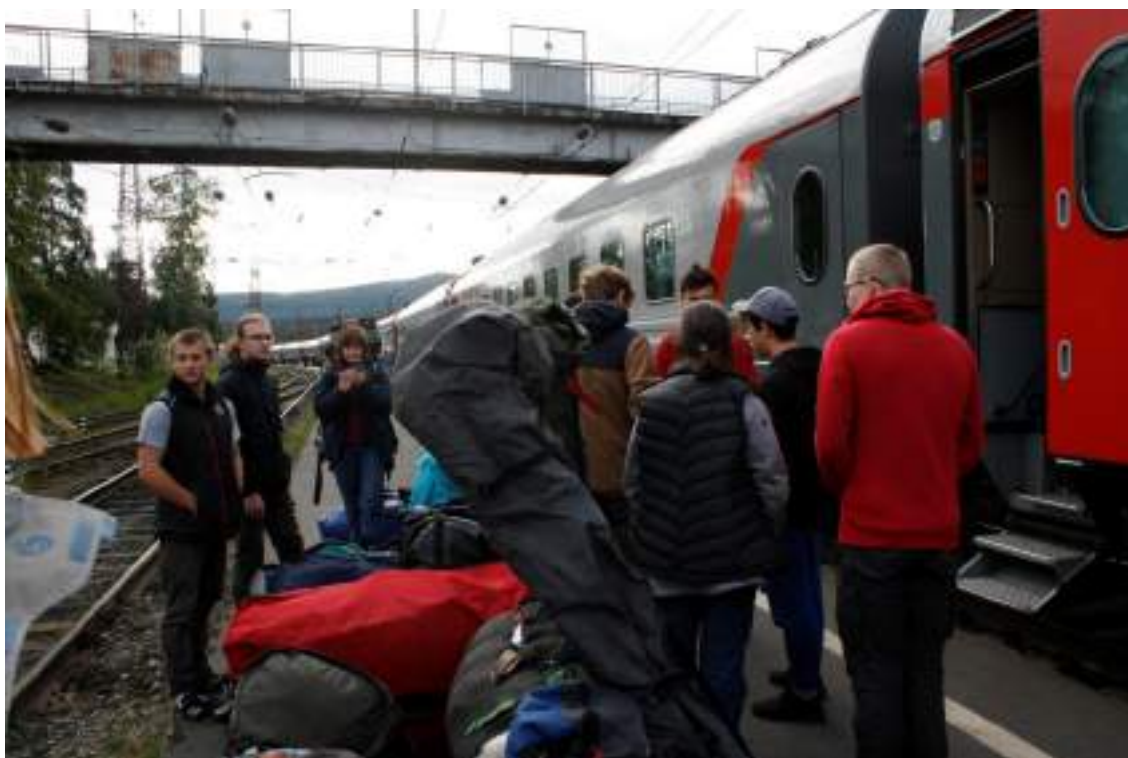
Фото 1. Выгрузка из поезда