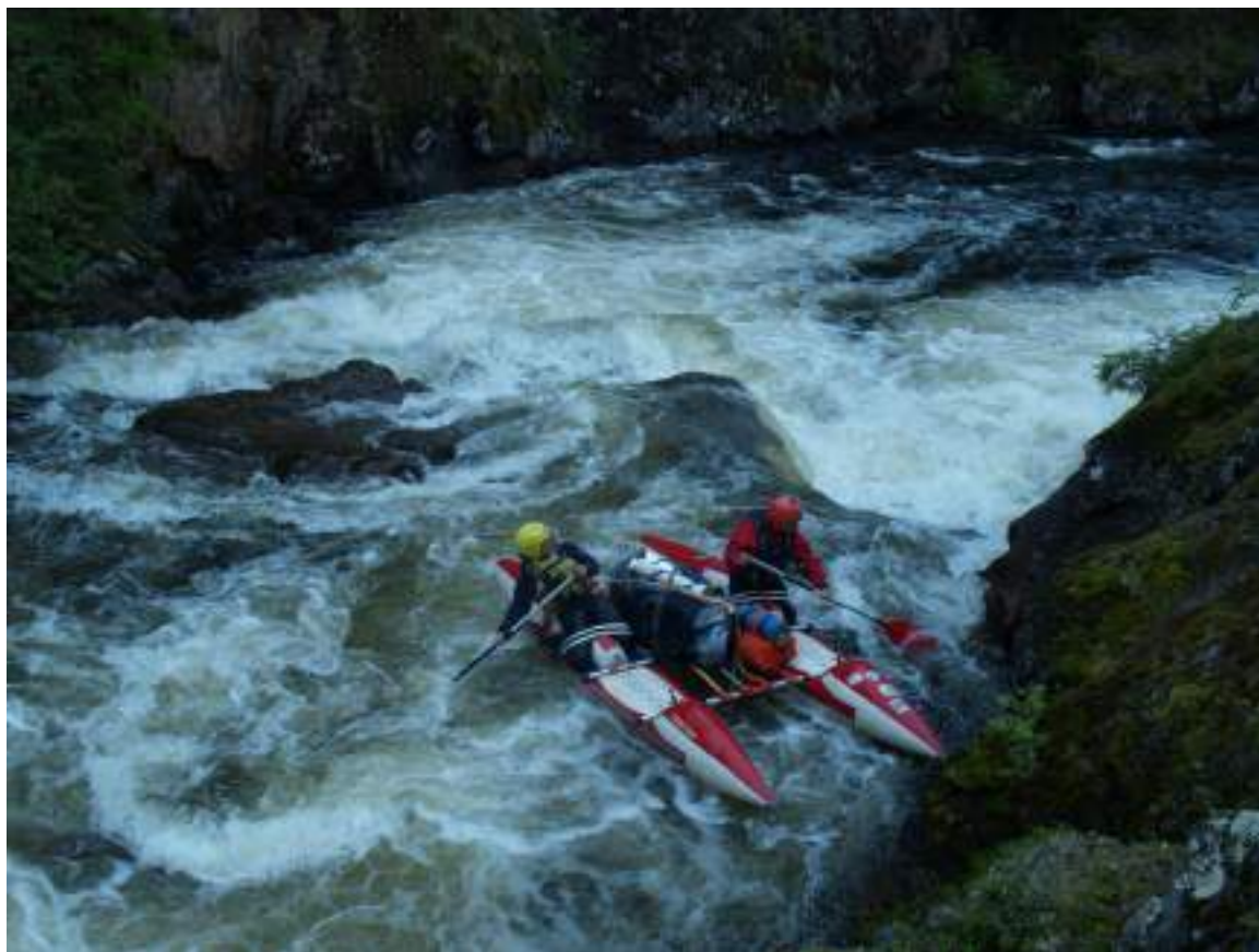
Фото 35. Прохождение порога Тесный