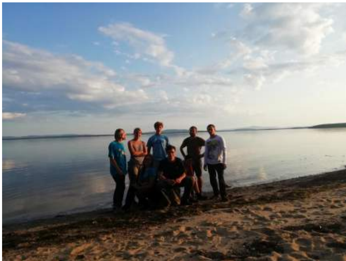
Фото 64. Прогулка к Белому морю в Кандалакше