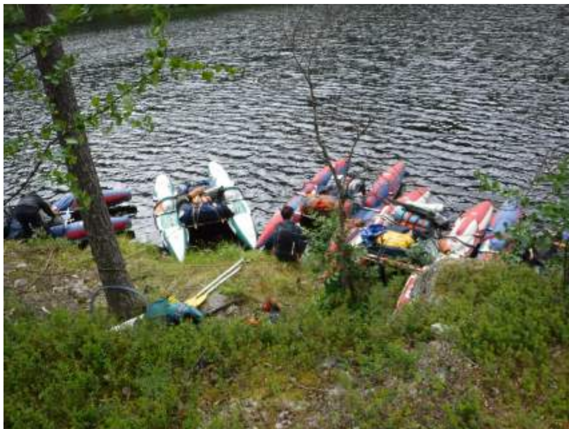
Фото 10. Обед на озере