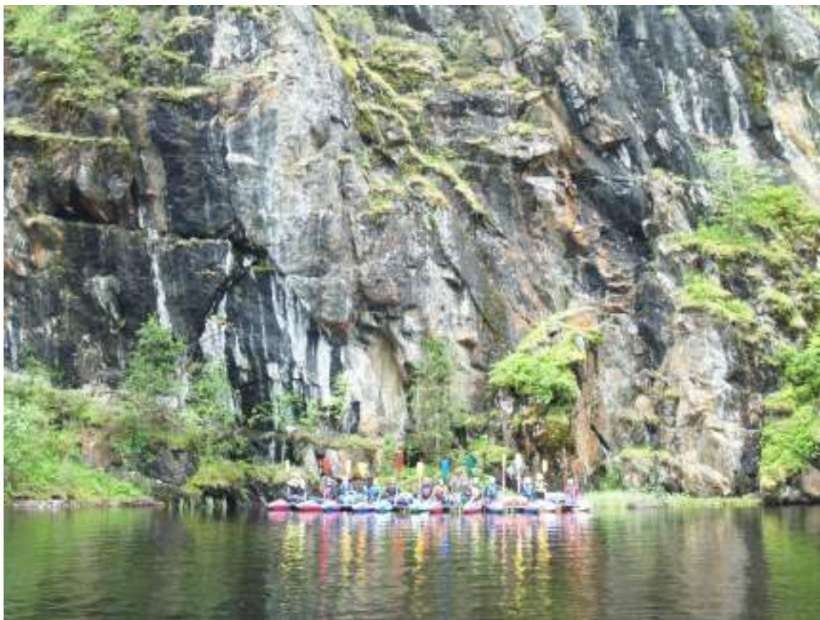
Фото 9. На фоне скалы все вместе