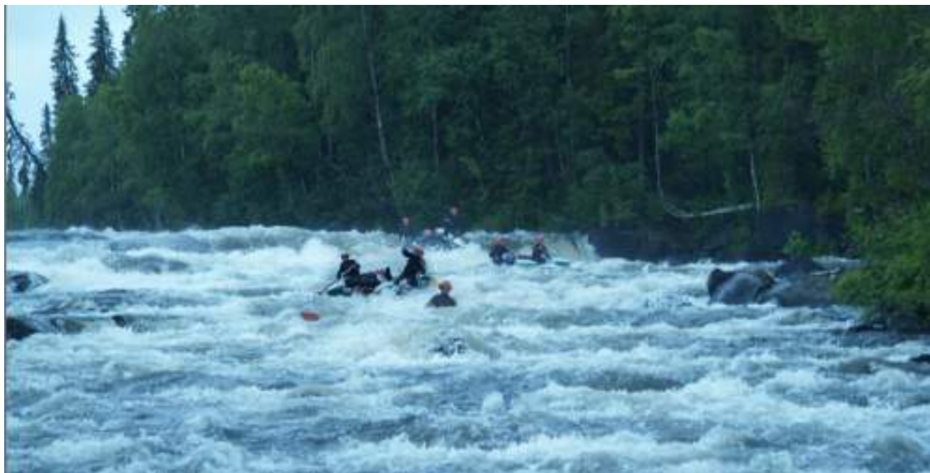
Фото 37. Прохождение порога Ступенька (кинограмма)