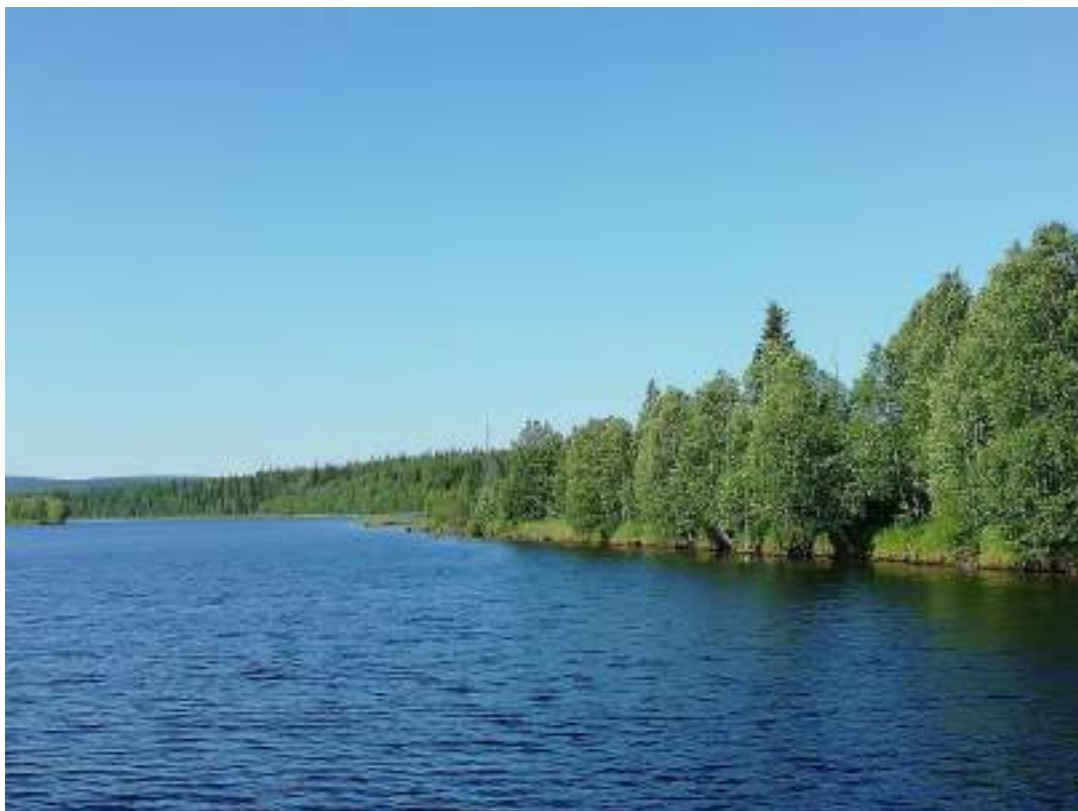
Фото 60. Река Тумча ближе к Илевскому водохранилищу