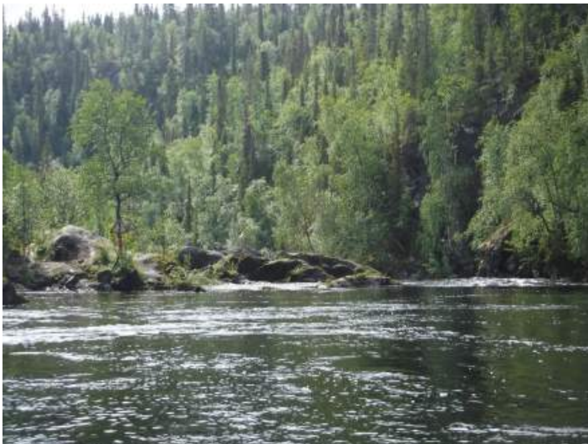
Фото 17. Ориентир порога Сомнительный