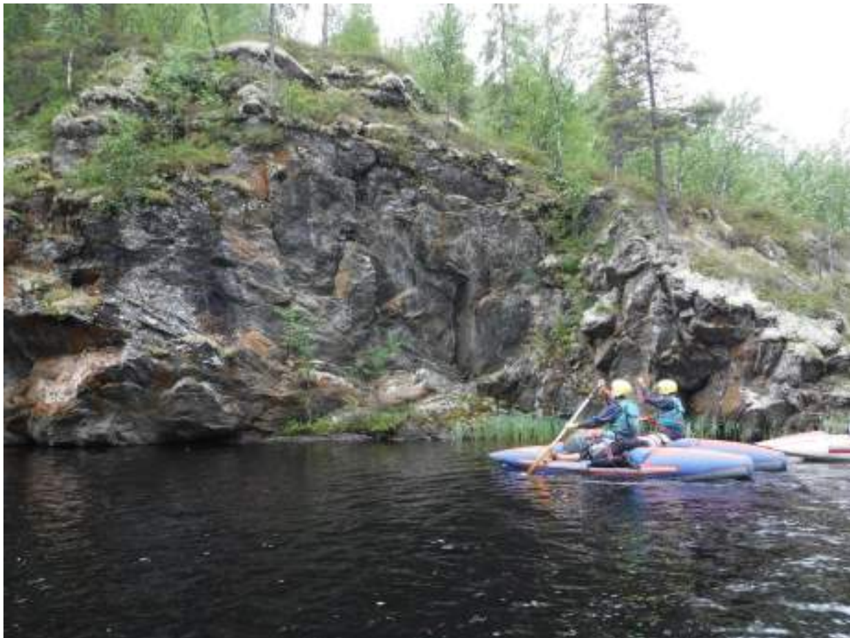
Фото 8. Сплав по озеру. 1 день