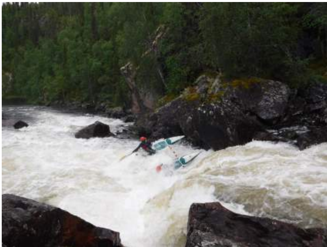
Фото 20. Прохождение порога Сомнительный