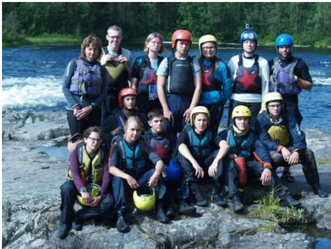
Фото 41. Общая фотография на пороге Водопадный (2 ступень)