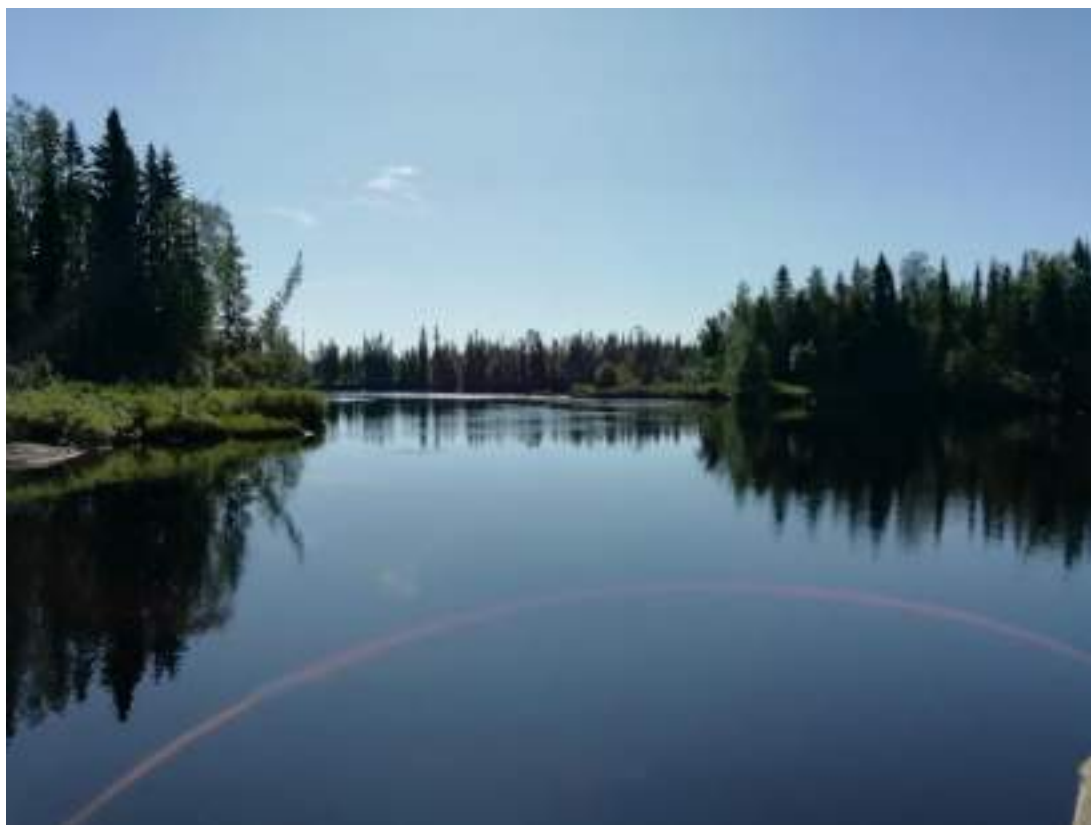
Фото 59. Река Тумча после порога Шляпа