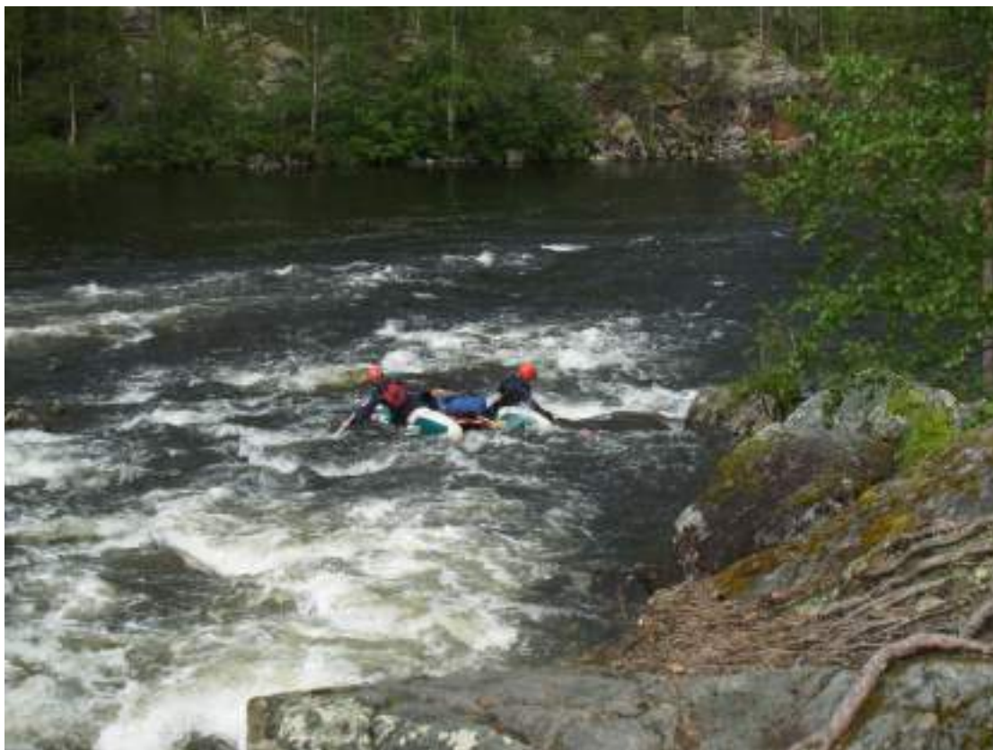
Фото 25. Прохождение порога БСТ (выход)