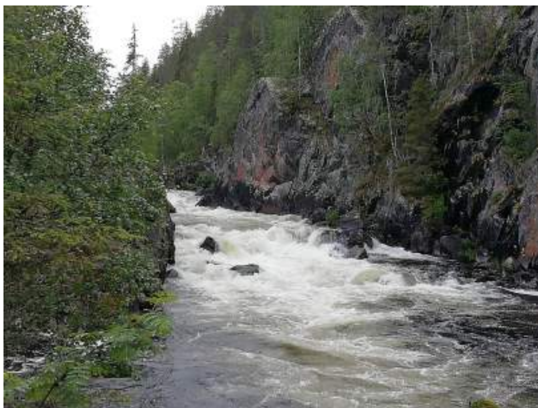
Фото 15. Порог Кавказский на р. Красненькая вид снизу