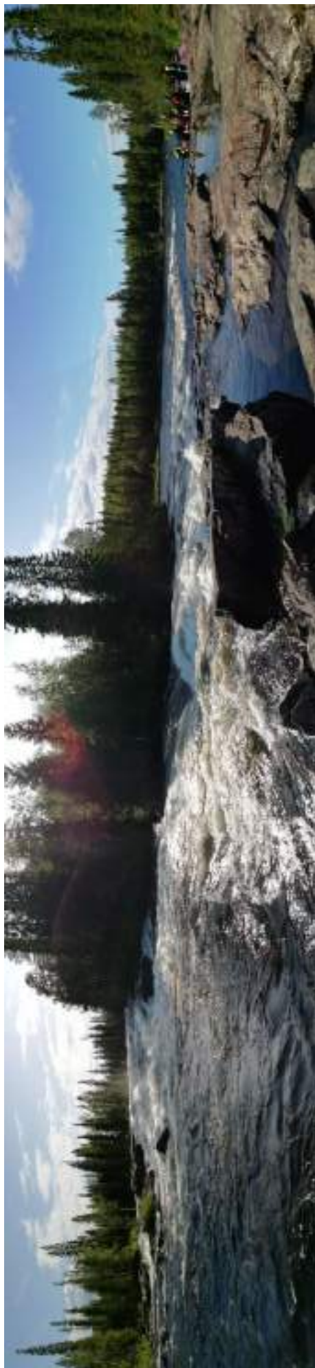
Фото 39. Панорама порога Водопадный (1 и 2 ступени)