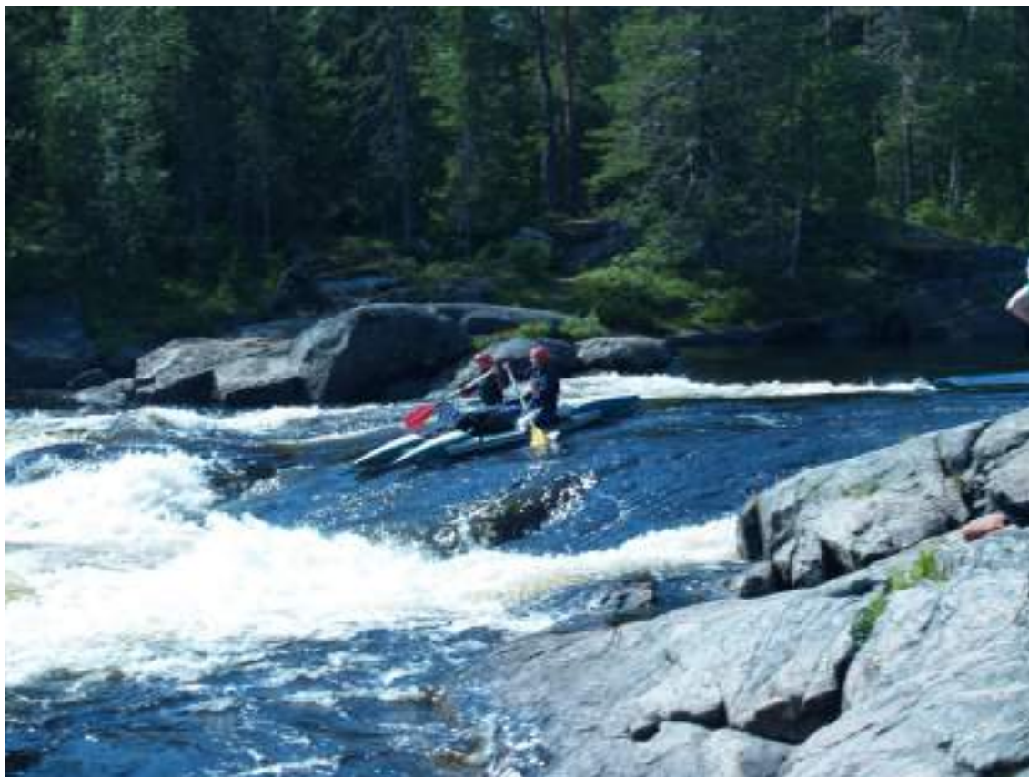
Фото 52. Прохождение порога Шляпа (заход)