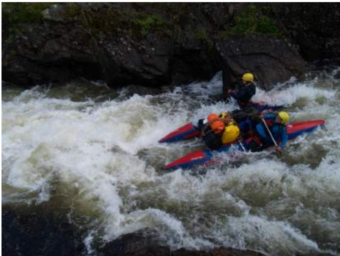
Фото 22. Прохождение порога Муравей (середина)