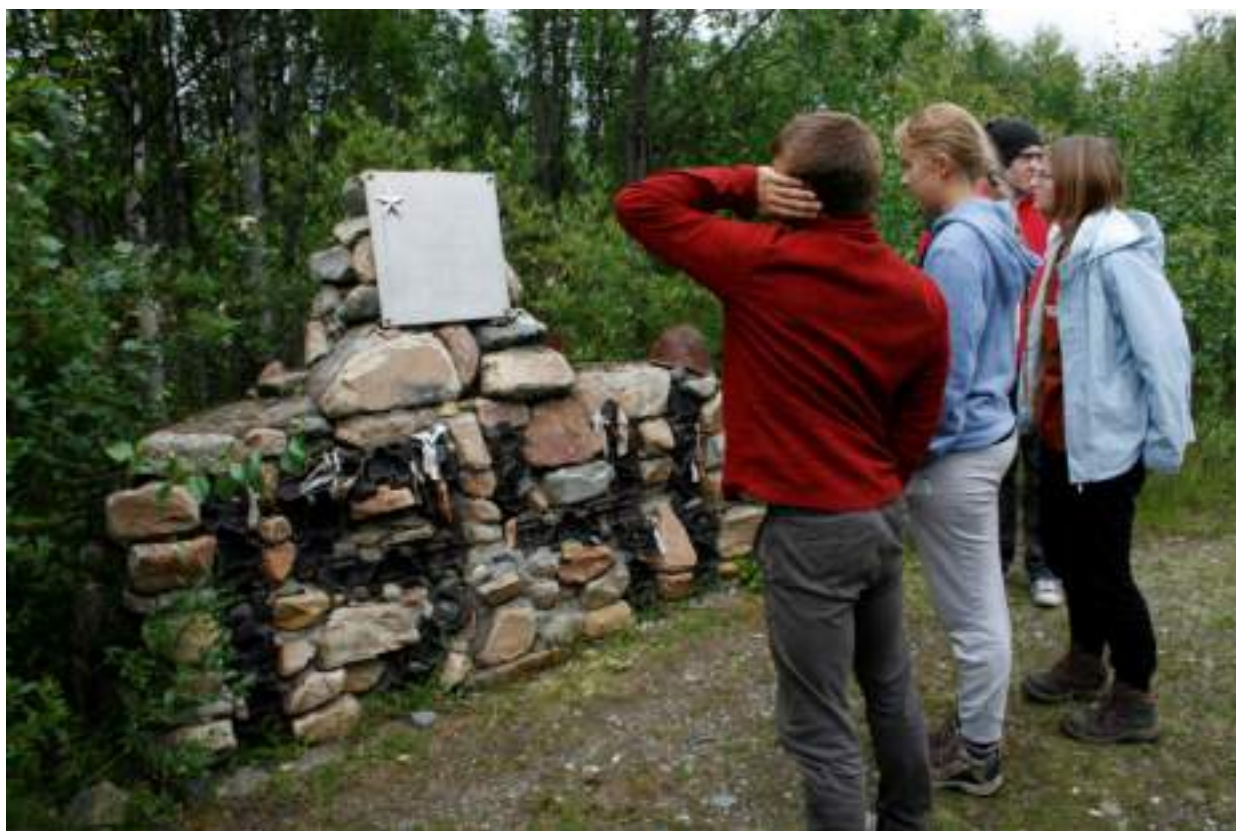
Фото 6. Памятник экипажу танка Т-26