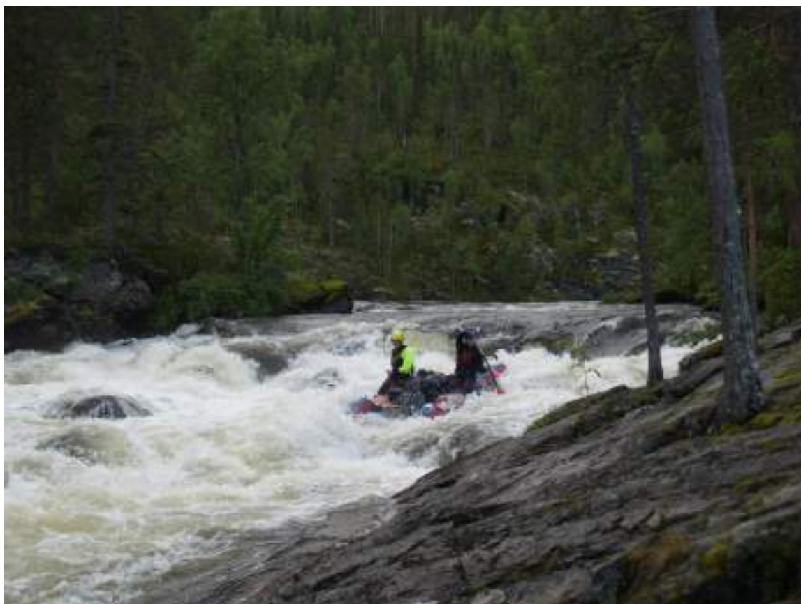
Фото 21. Прохождение порога Муравей (Заход)