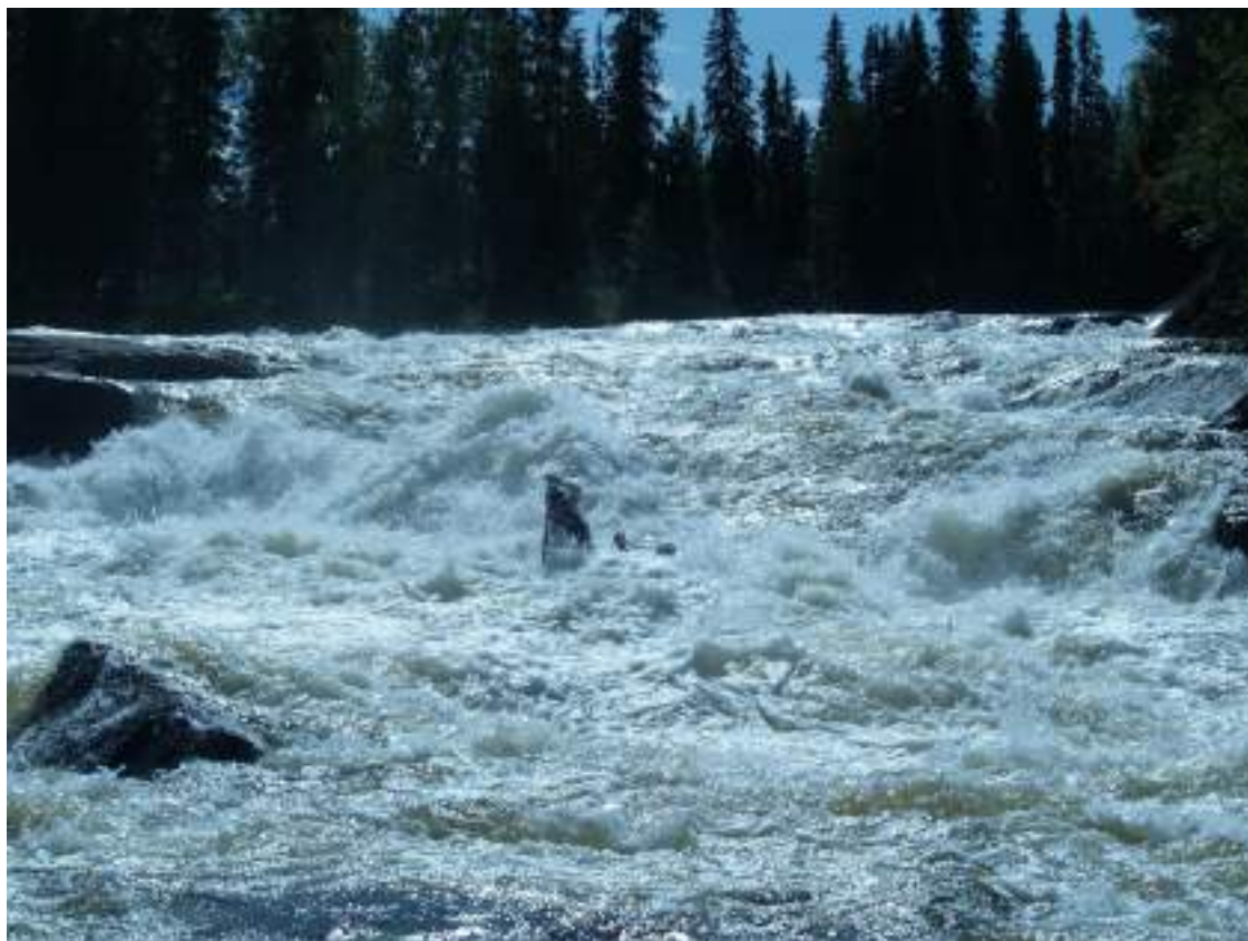
Фото 43. Прохождение порога Водопадный (1 ступень, окончание)