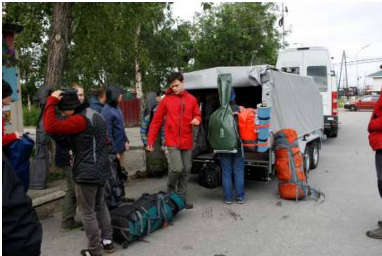
Фото 3. Грузим снаряжение в прицеп