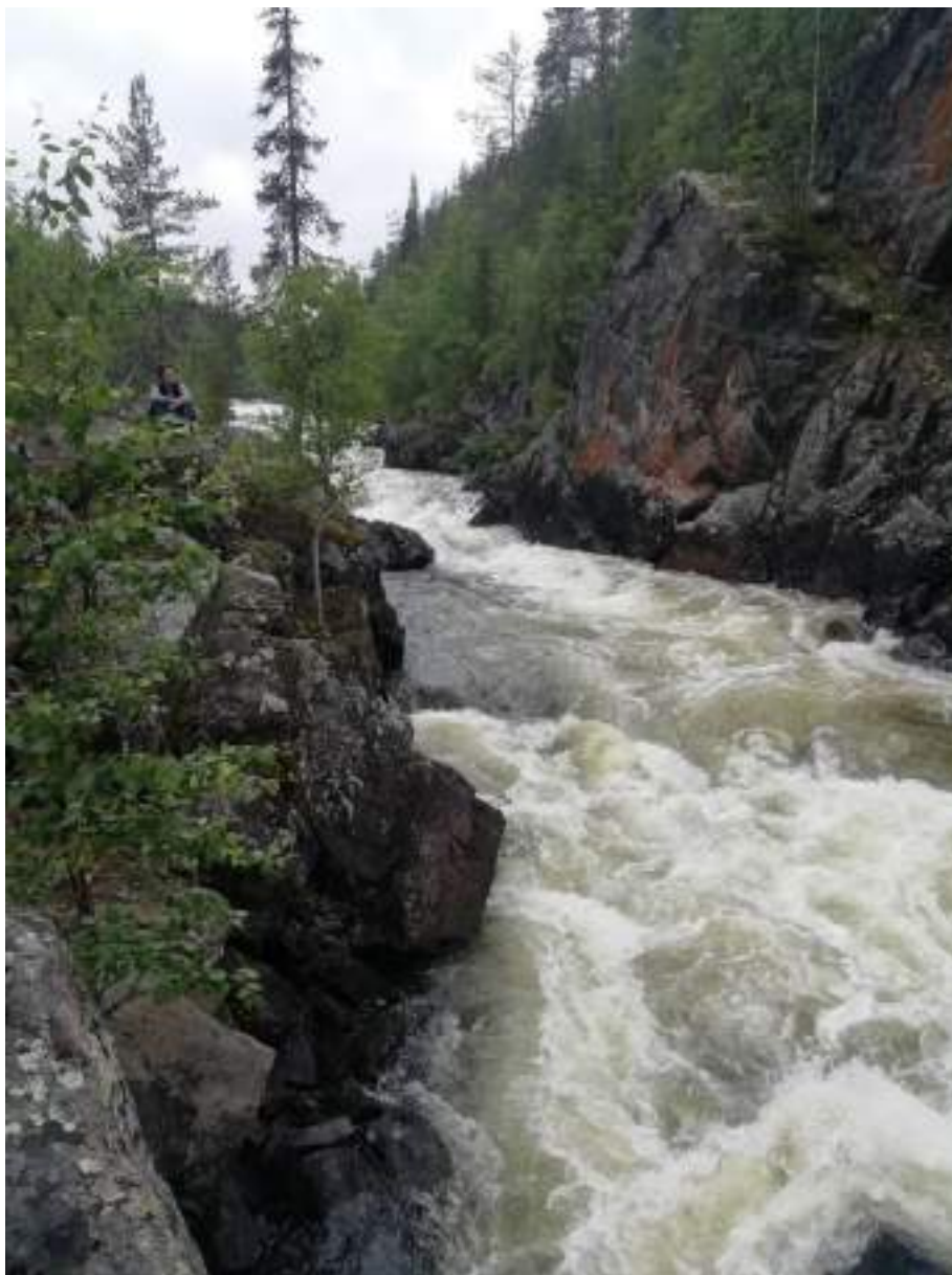
Фото 13. Радиалка вверх по р. Красненькая