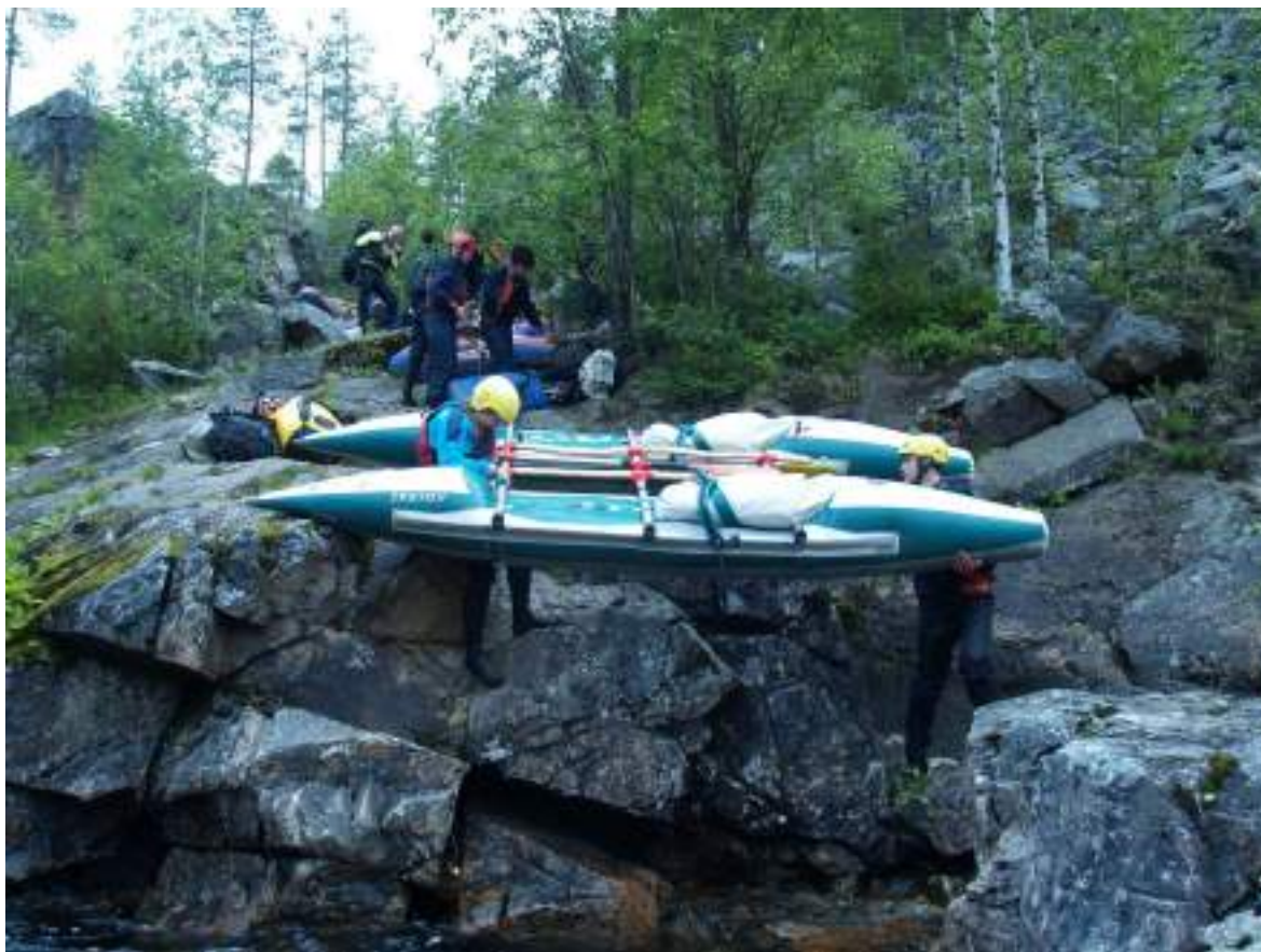
Фото 27. Обнос водопада Оба-на