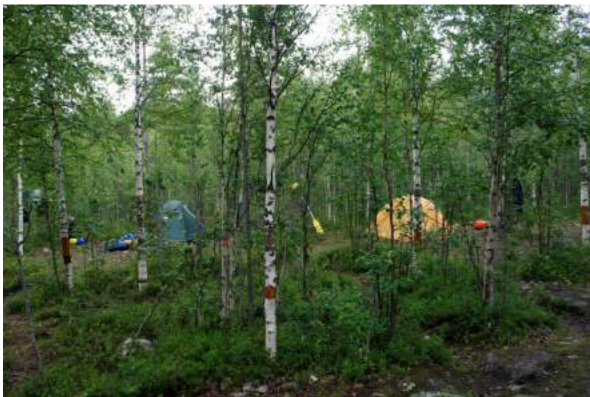
Фото 12. Стоянка на стрелке