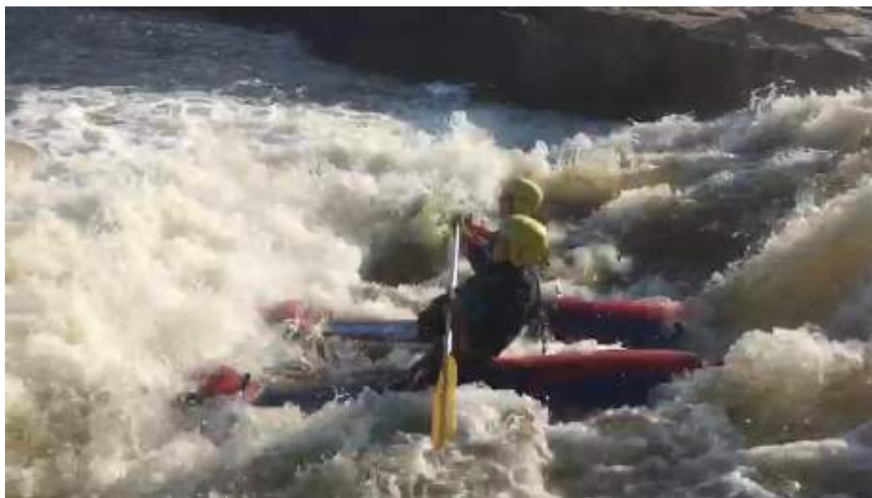
Фото 51. Прохождение порога Карниз по левой протоке (бочка)