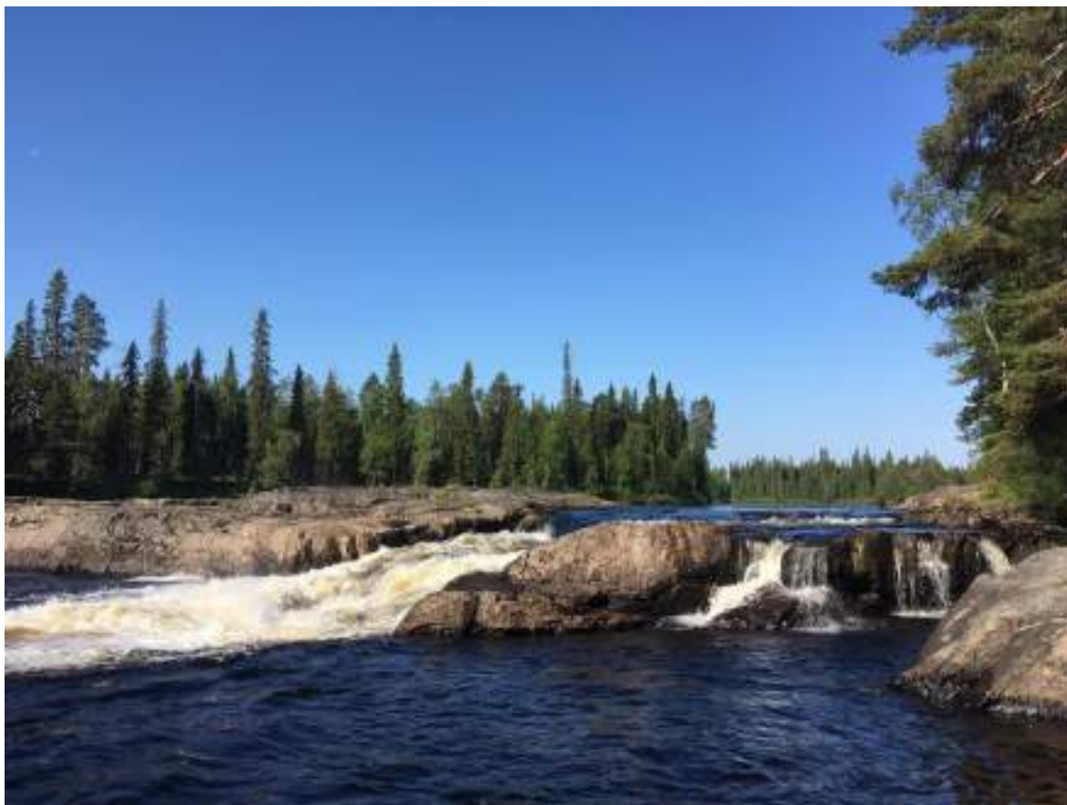
Фото 48. Порог Карниз (левый протока)