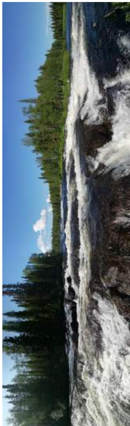
Фото 40. Панорама порога Водопадный (3 и 4 ступени)