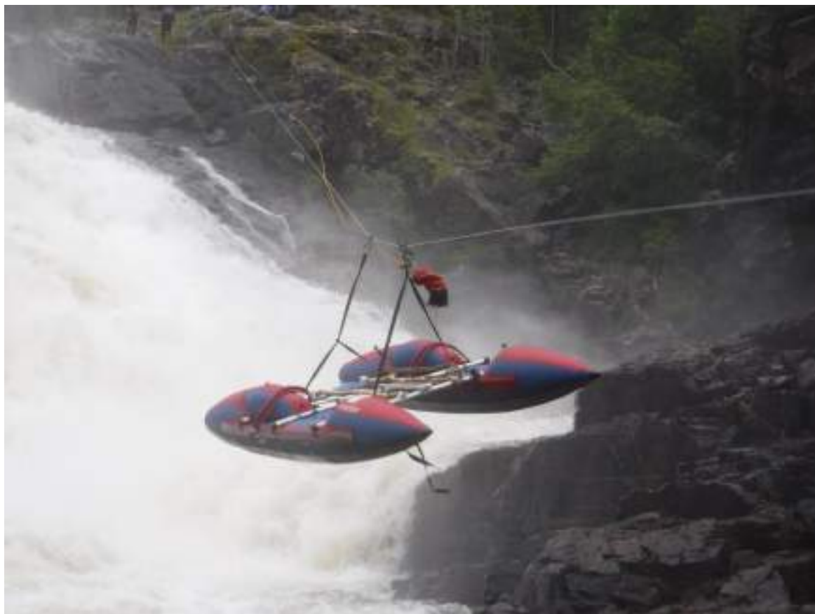
Фото 31. Переправа катамаранов на водопаде Маманя