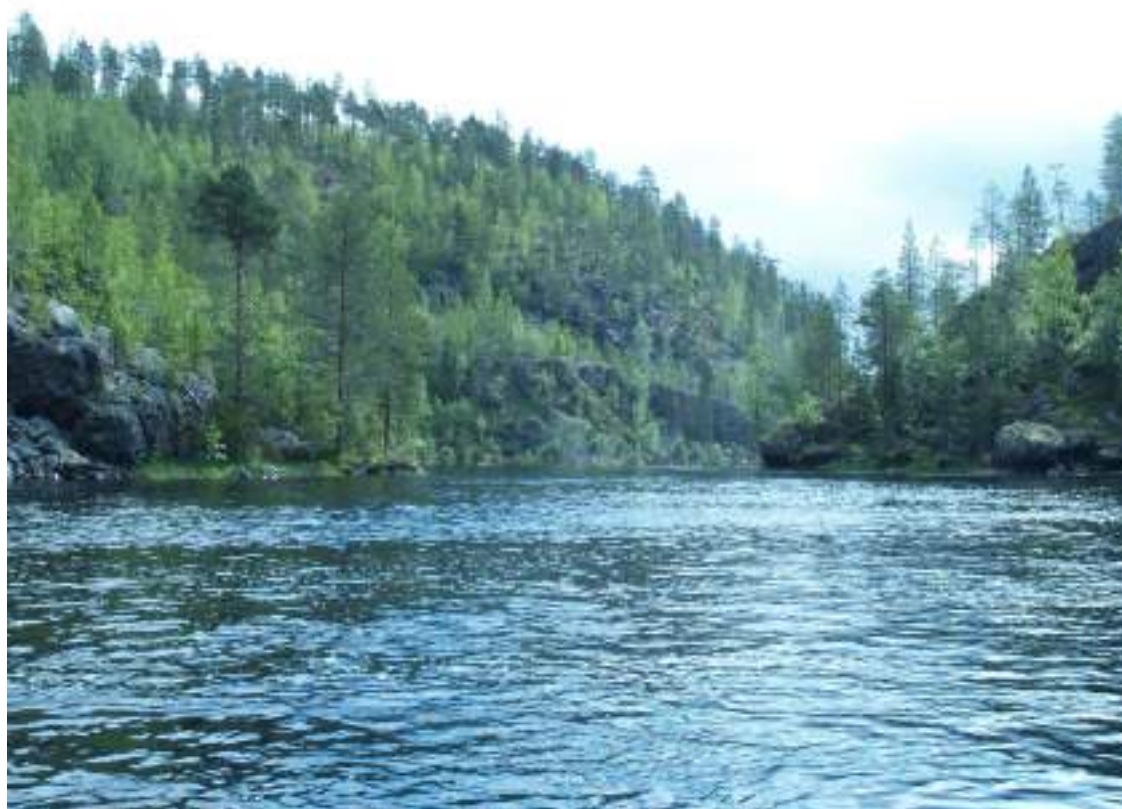
Фото 29. Перед водопадом Маманя