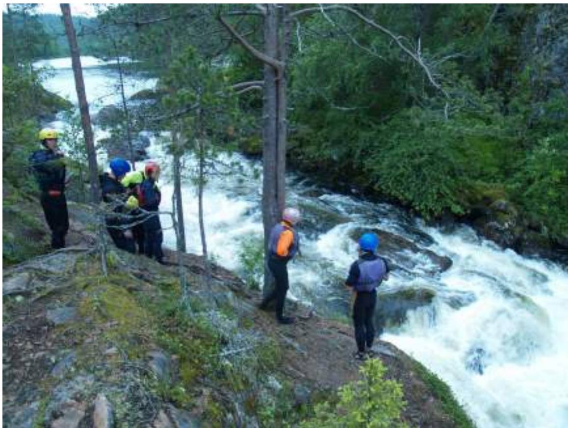
Фото 33. Просмотр порога Тесный