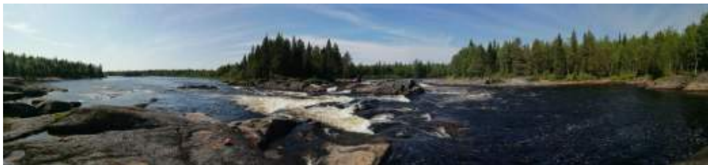
Фото 58. Панорама порога Шляпа