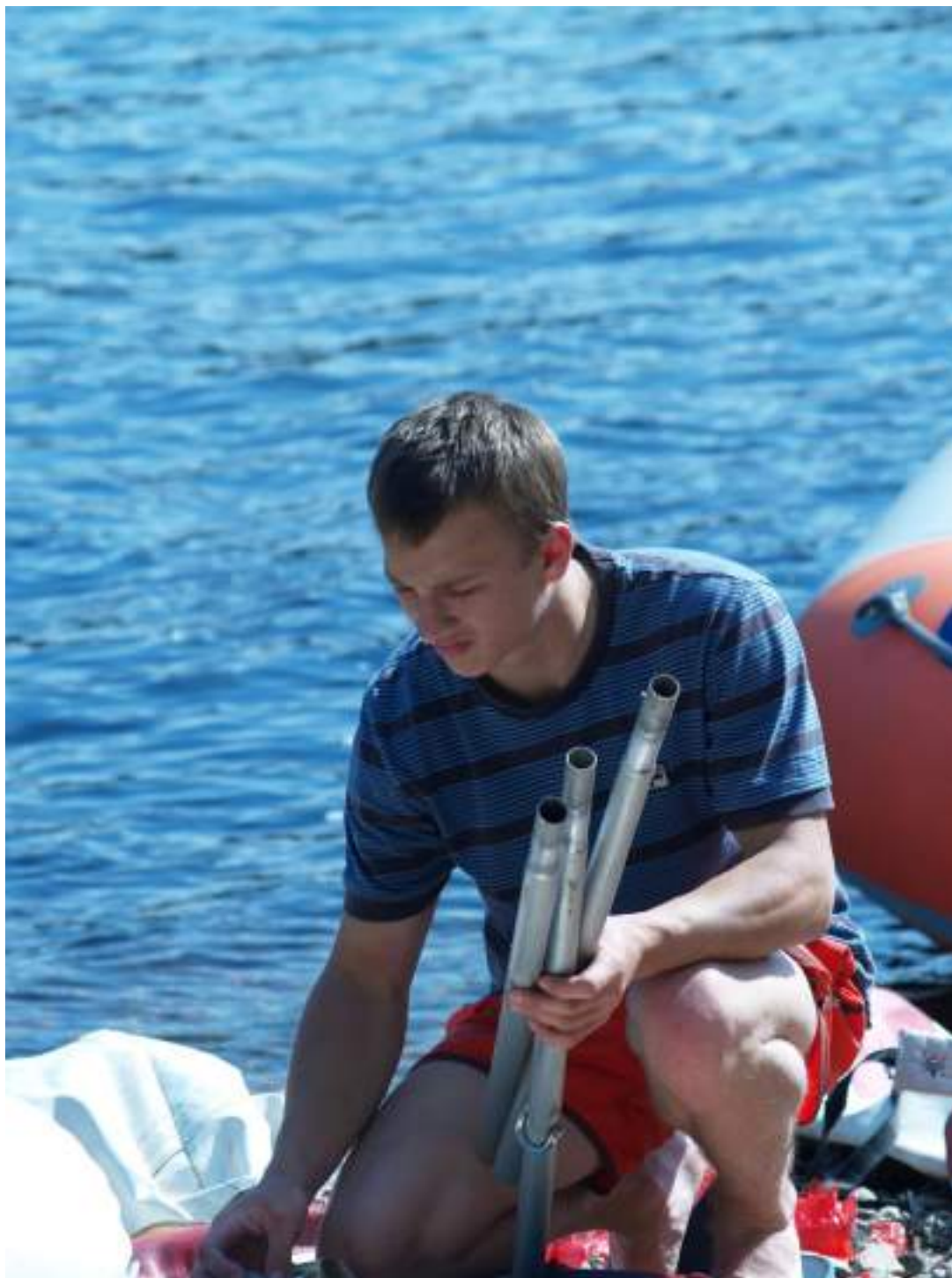
Фото 62. Антистапель