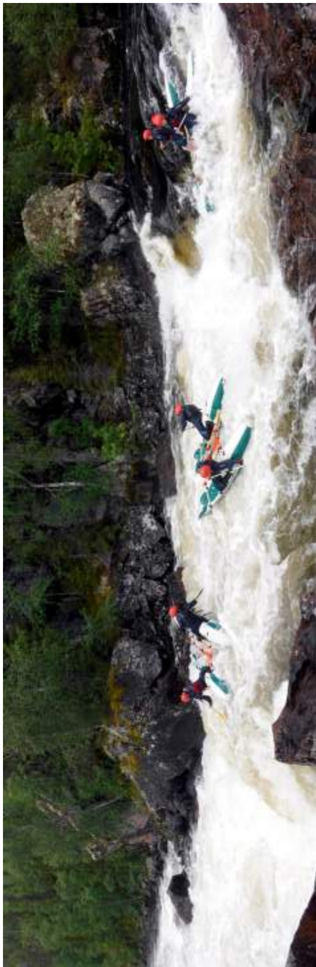
Фото 19. Прохождение порога Сомнительный