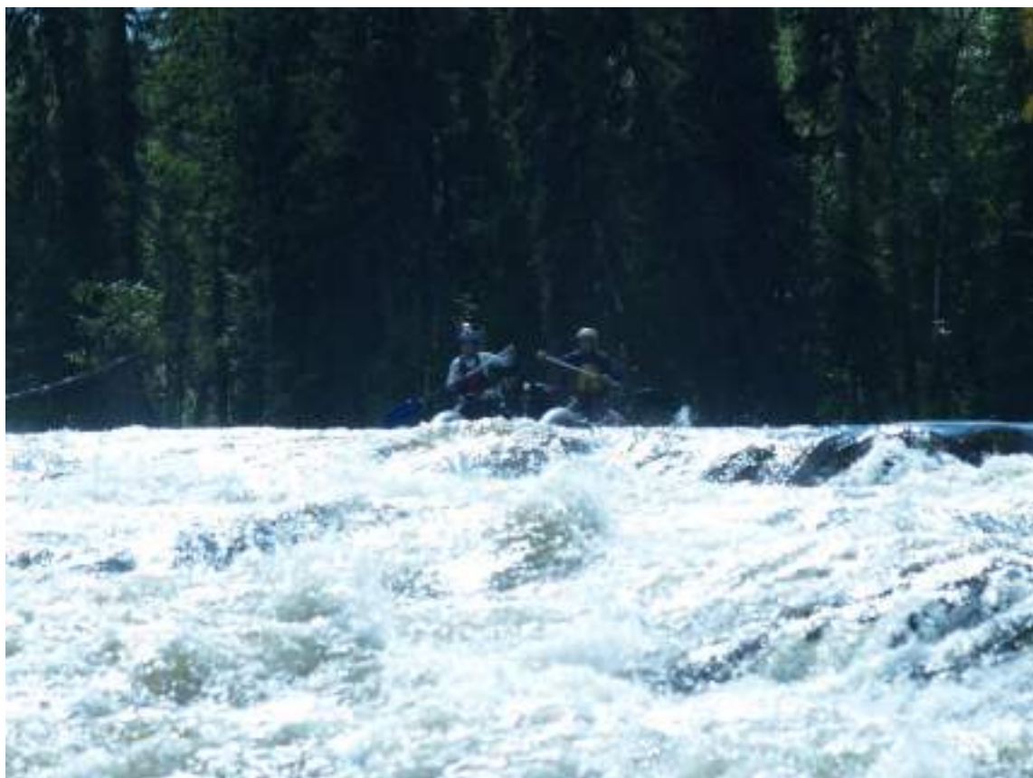
Фото 42. Прохождение порога Водопадный (1 ступень, заход)