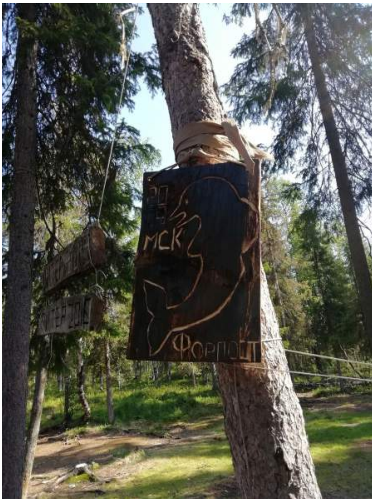
Фото 49. Наша табличка на стоянке у порога Карниз