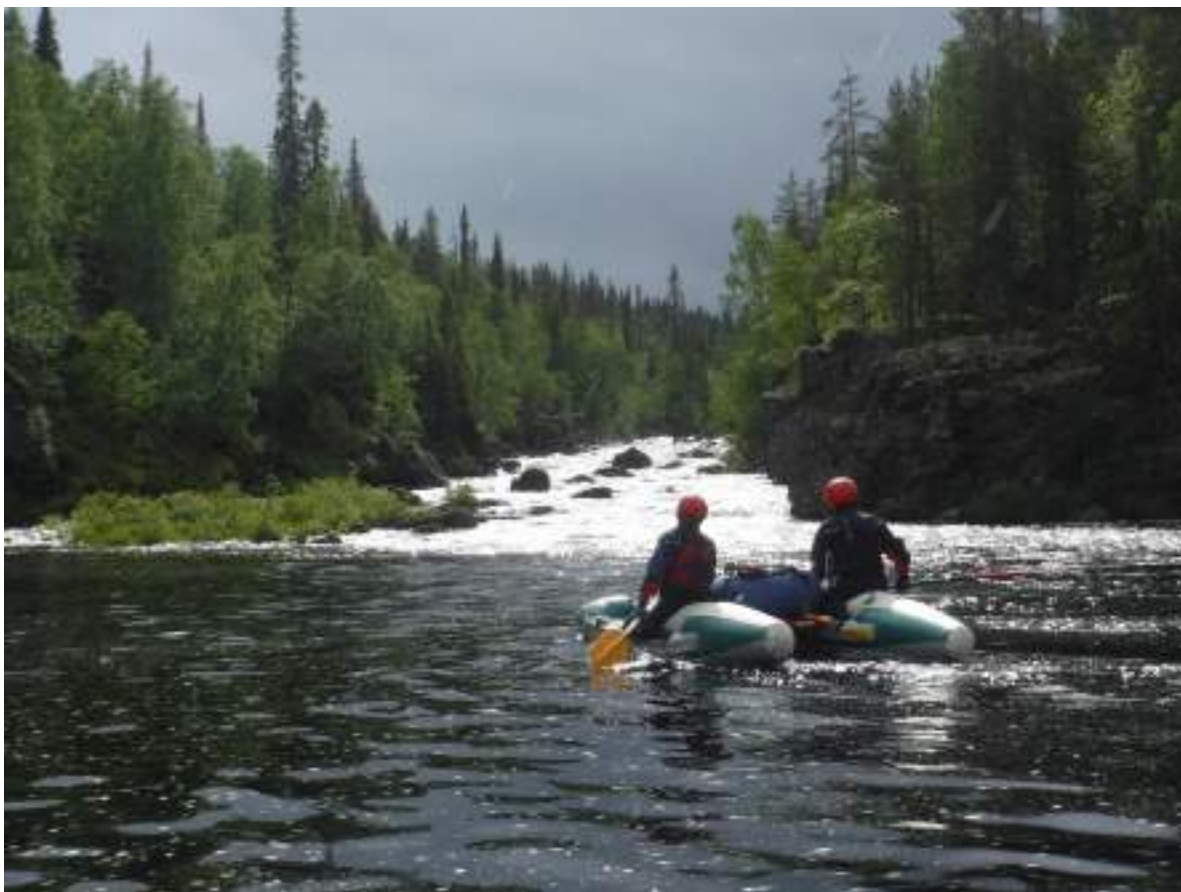
Фото 11. Стрелка с Красненькой