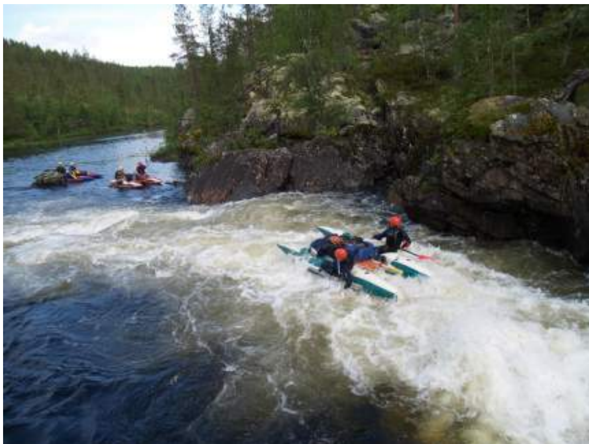
Фото 23. Прохождение порога Муравей (окончание)