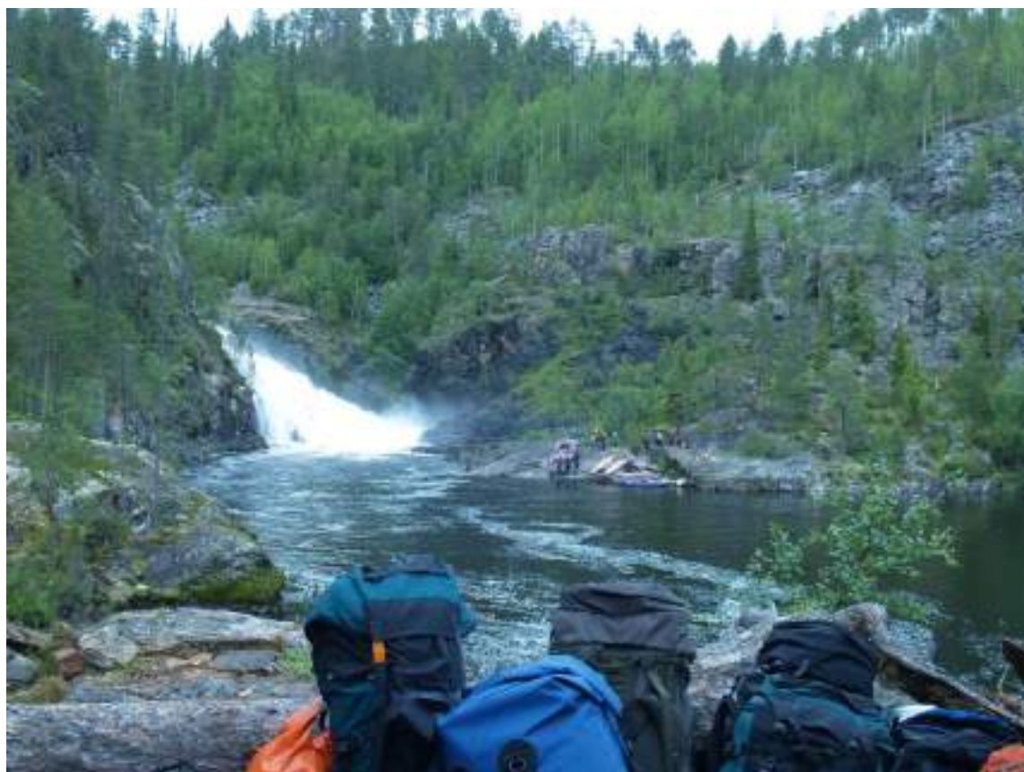
Фото 32. Вид с другого берега на водопад Маманя