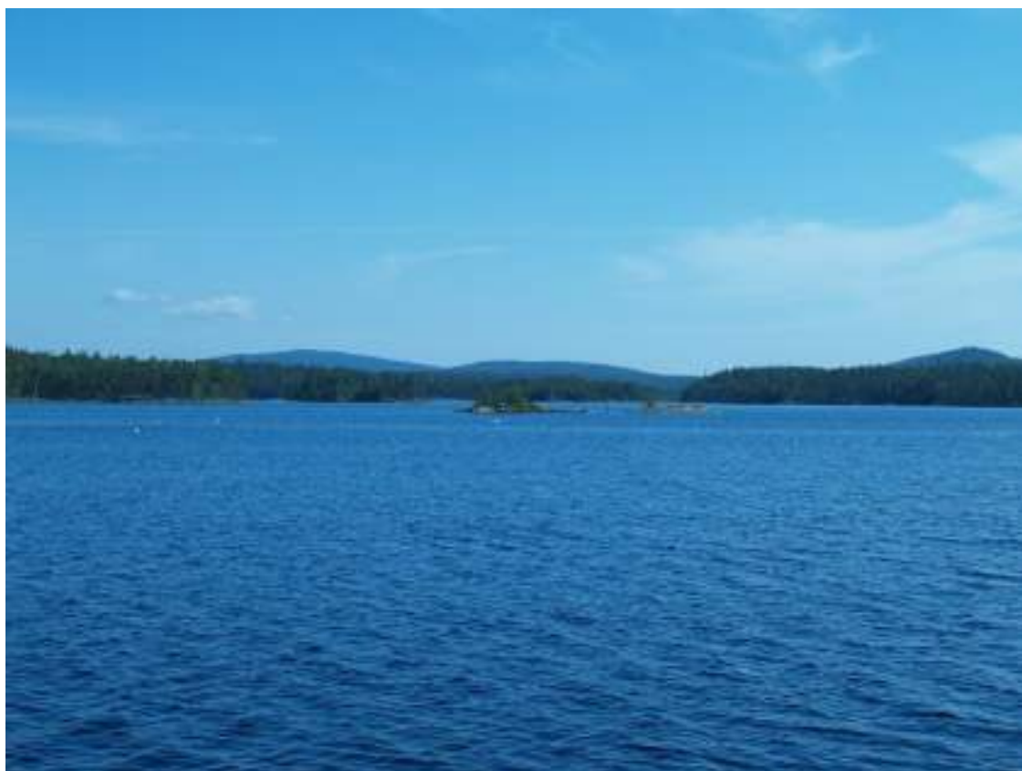
Фото 61. На Иовском водохранилище