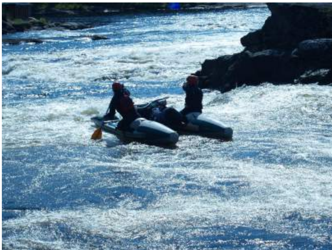
Фото 55. Прохождение порога Шляпа