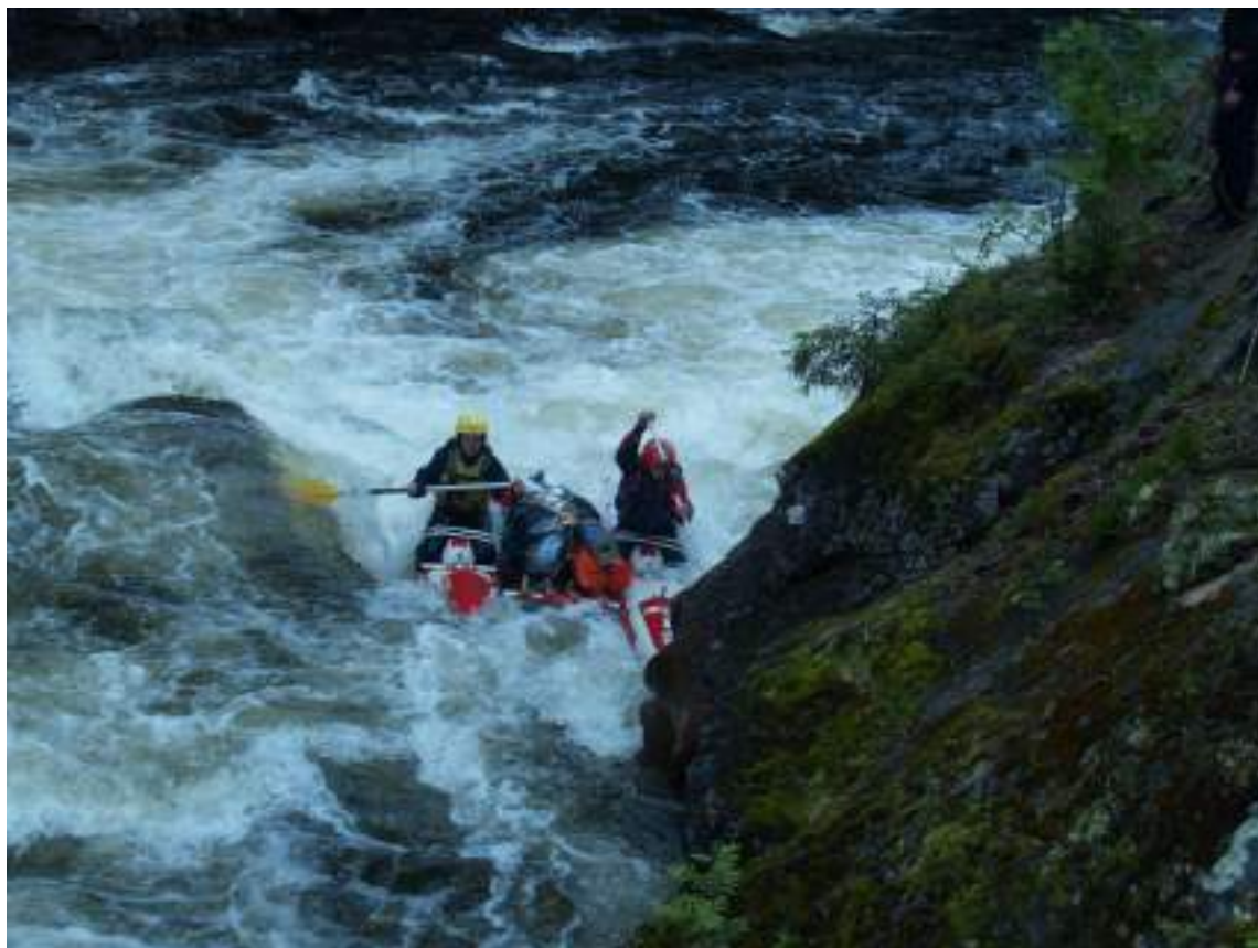
Фото 36. Прохождение порога Тесный