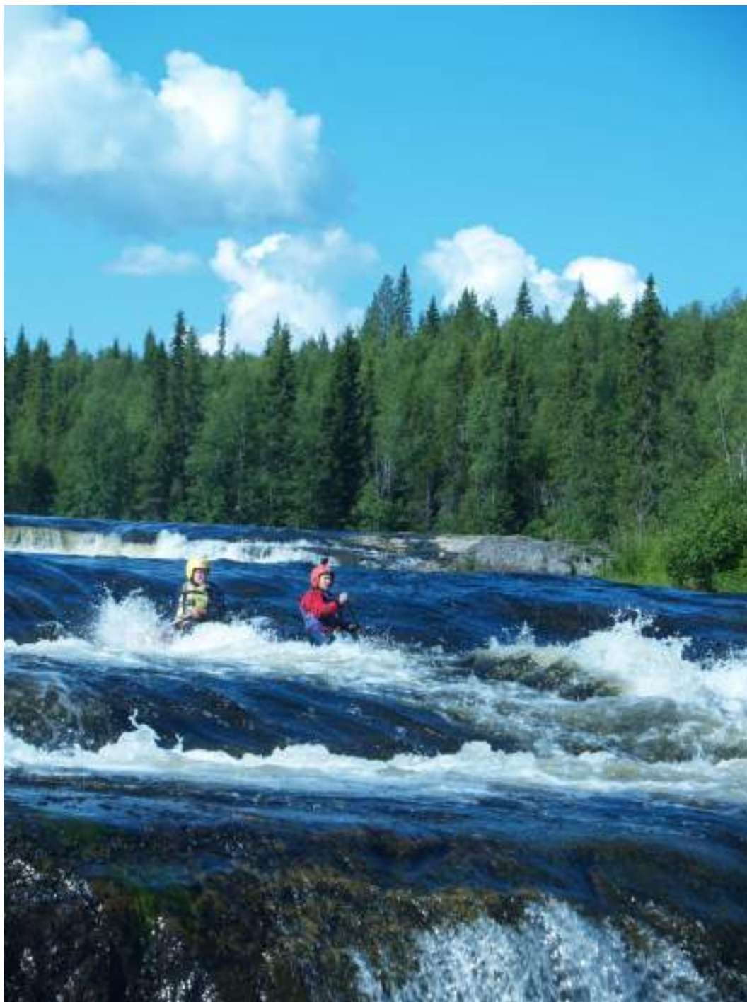
Фото 45. Прохождение порога Водопадный (3 ступень)