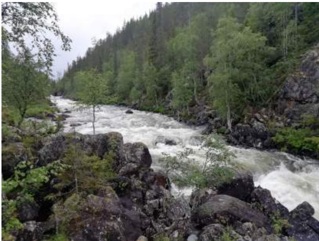
Фото 14. Порог Кавказский на р. Красненькая