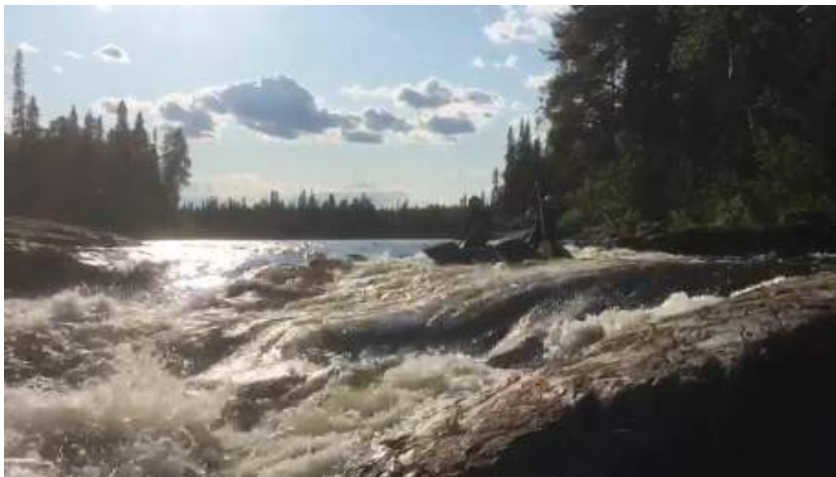
Фото 50. Прохождение порога Карниз по левой протоке