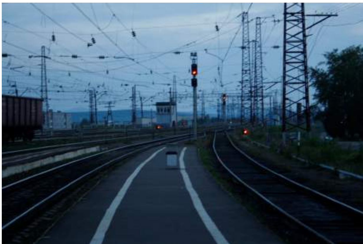
Фото 65. До свидания...