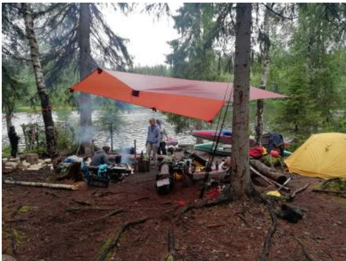
Фото 38. Стоянка после порога Ступенька