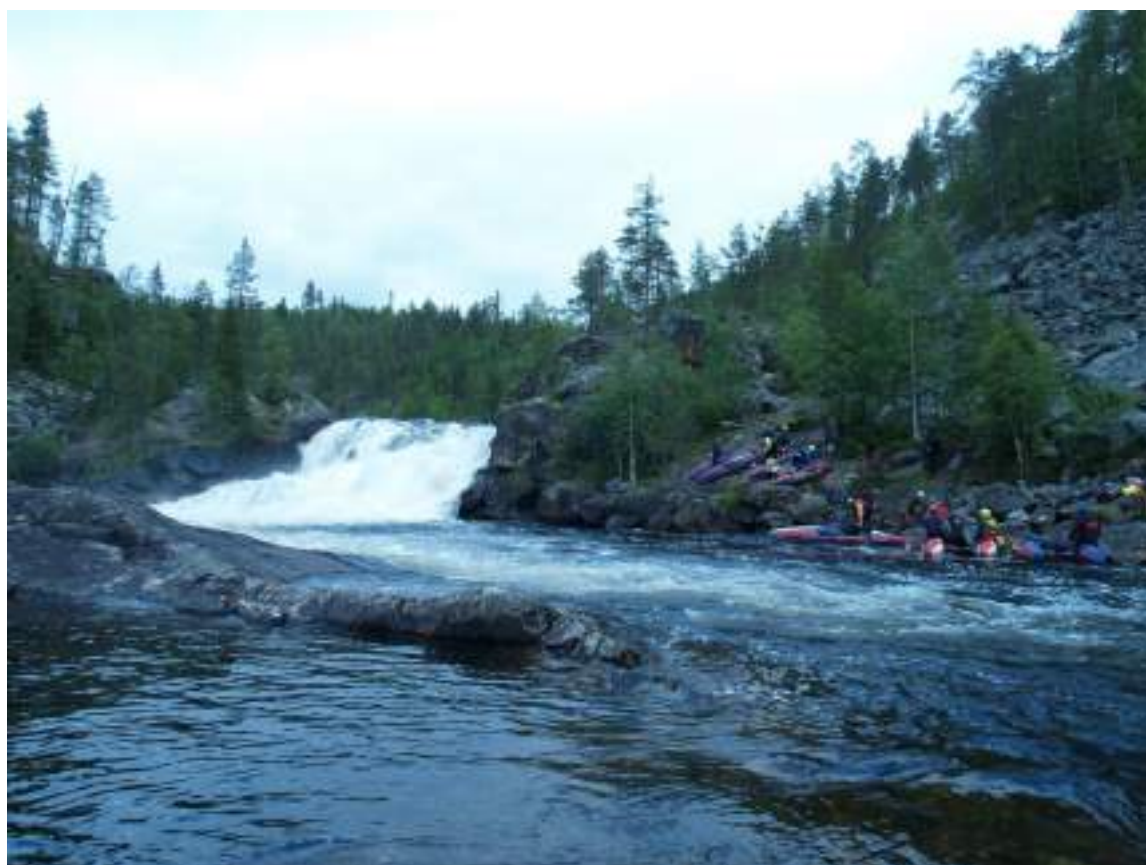
Фото 28. Водопад Оба-на