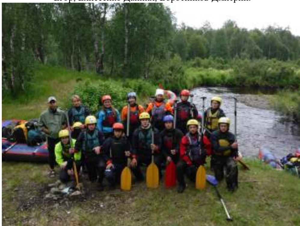
Фото 1. Общая фотография группы. Начало сплава.