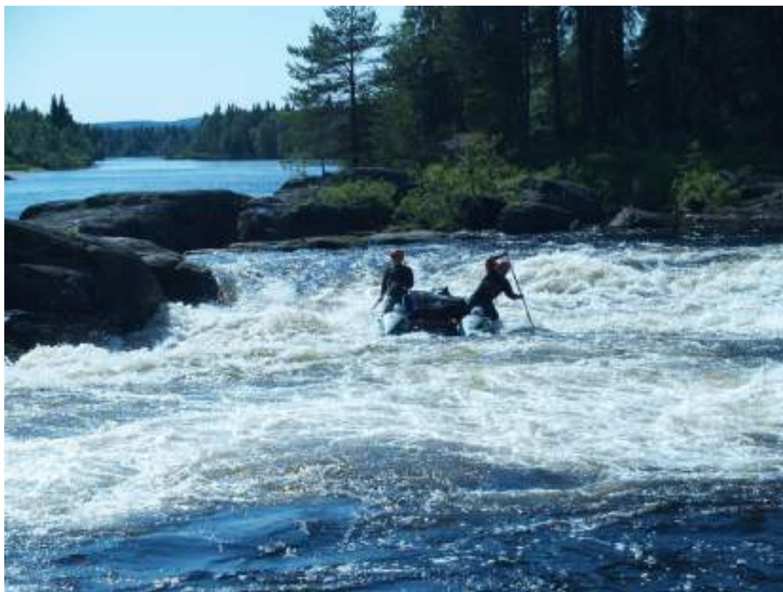
Фото 53. Прохождение порога Шляпа