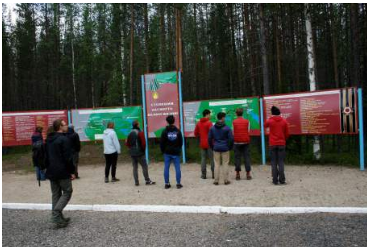
Фото 4. Остановка около мемориала «Рубеж Вермана»