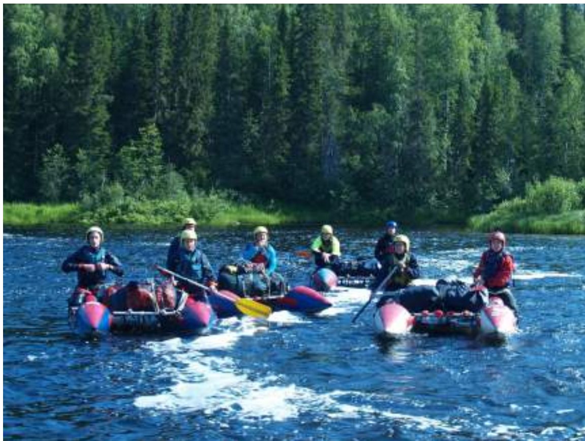
Фото 47. Между порогами