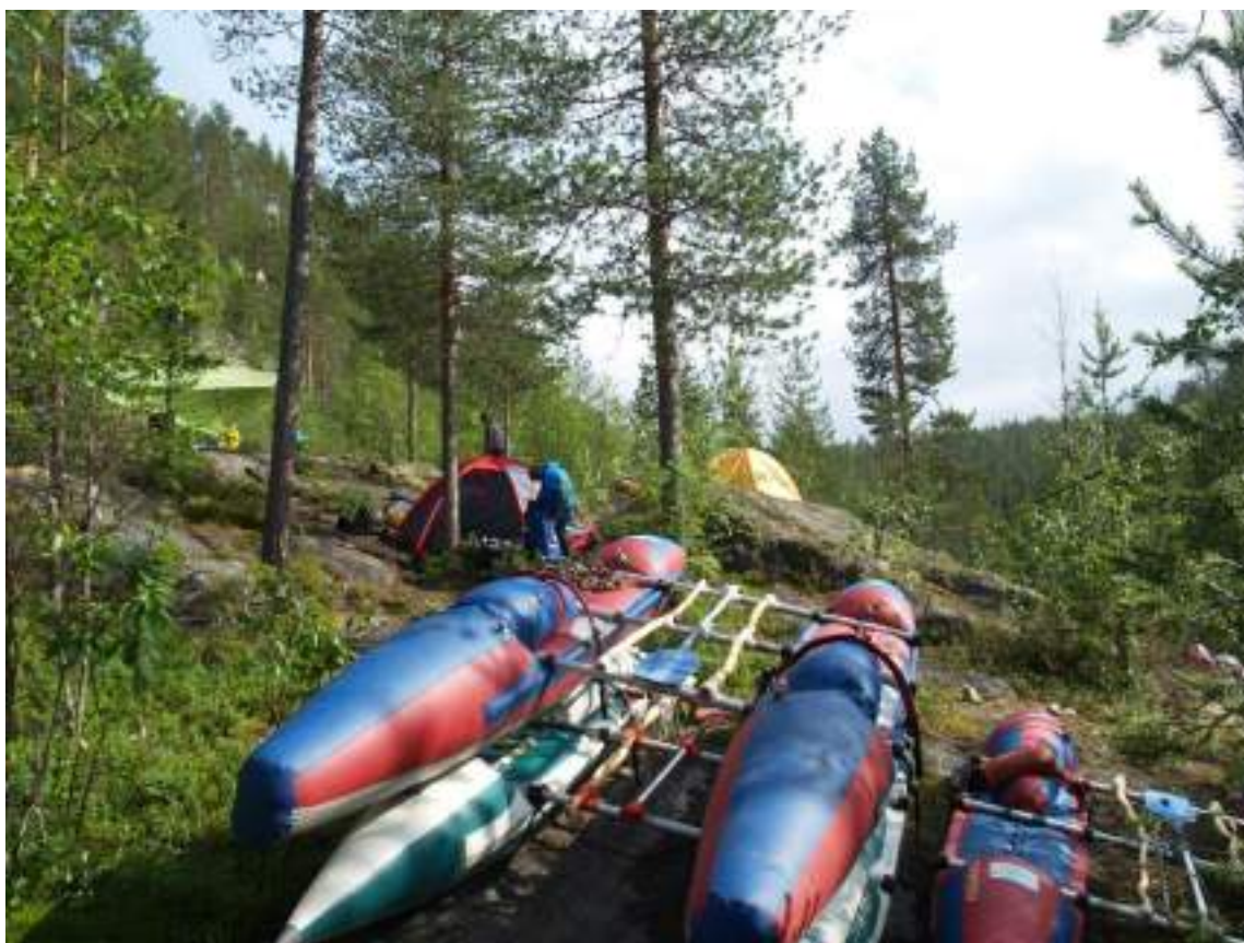
Фото 26. Стоянка на водопаде Оба-на