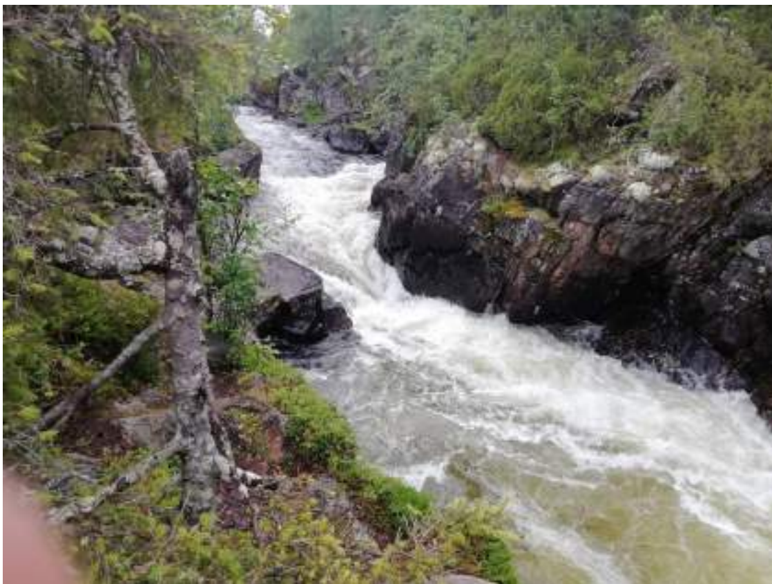
Фото 16. Порог Щёки на р. Красненькая