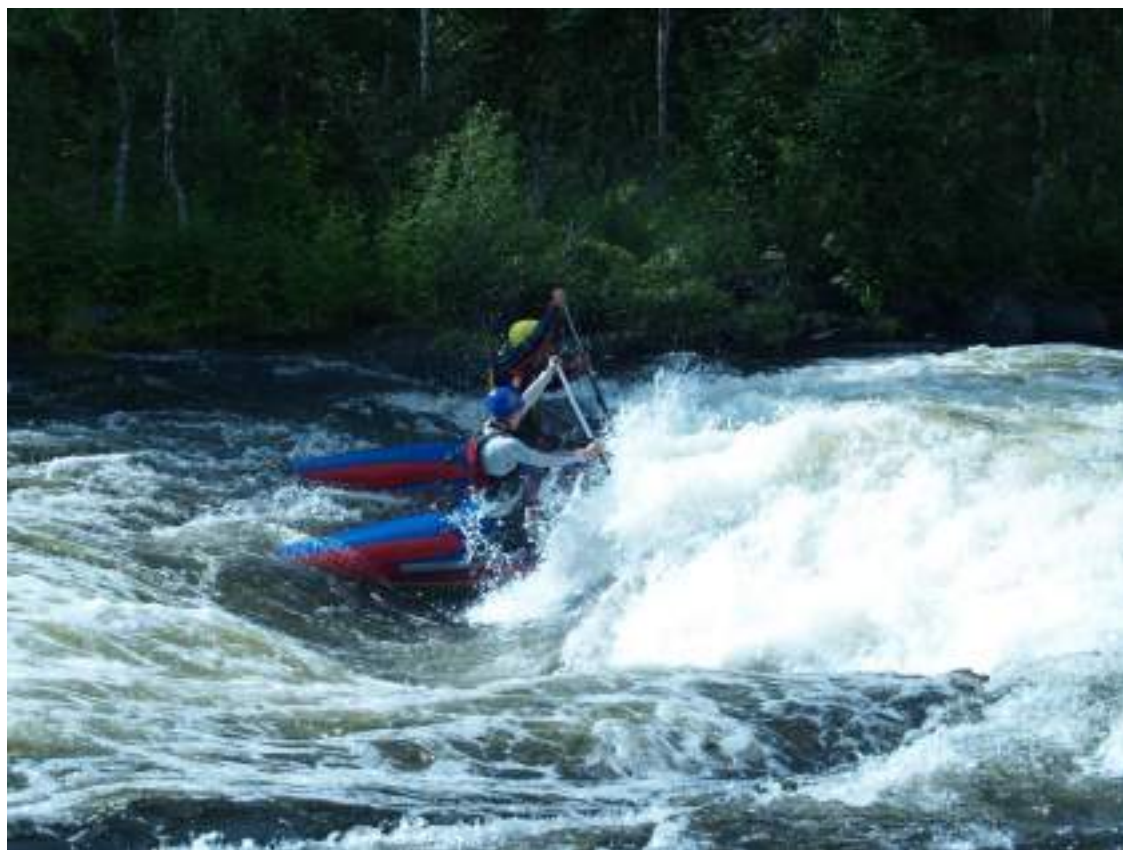
Фото 44. Прохождение порога Водопадный (2 ступень)