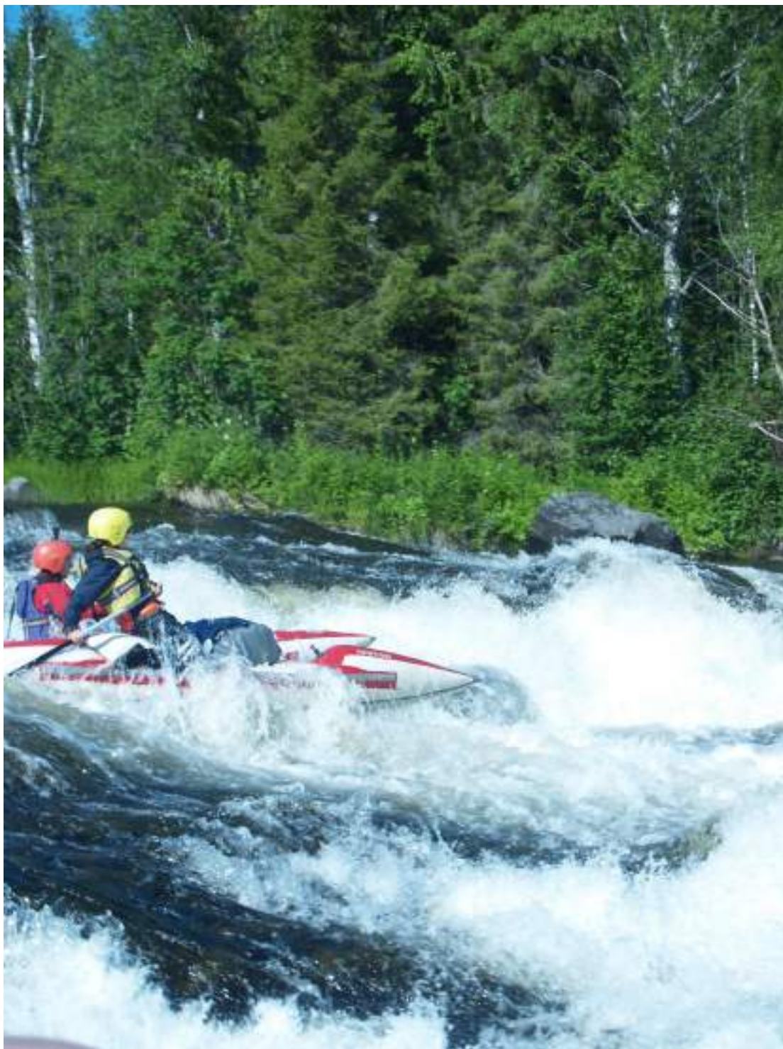
Фото 46. Прохождение порога Водопадный (4 ступень)