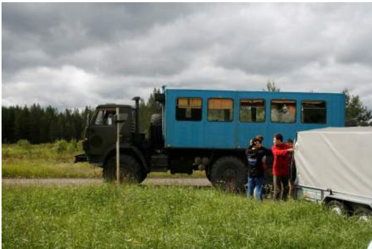
Фото 5. Смена машин