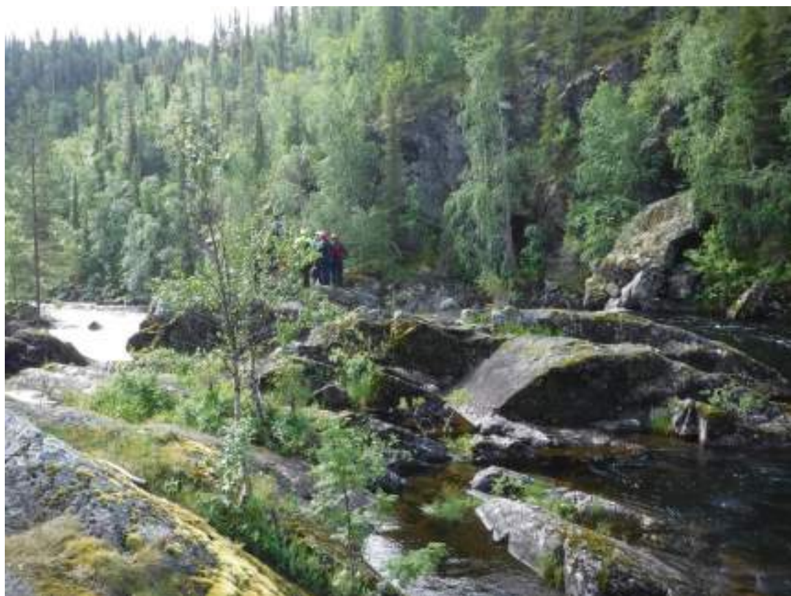
Фото 18. Просмотр порога Сомнительный