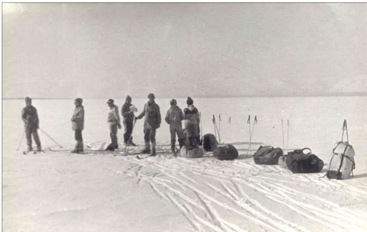
Фото. Привал на Умбозере. Впереди видны Хибины.