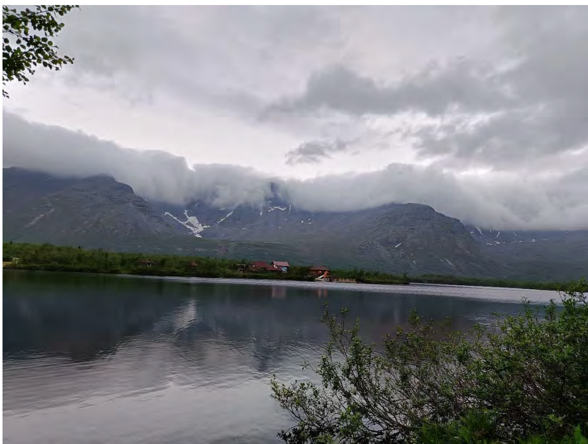
Фото 17 вид с нашей стоянки на озеро малый Вудъявр