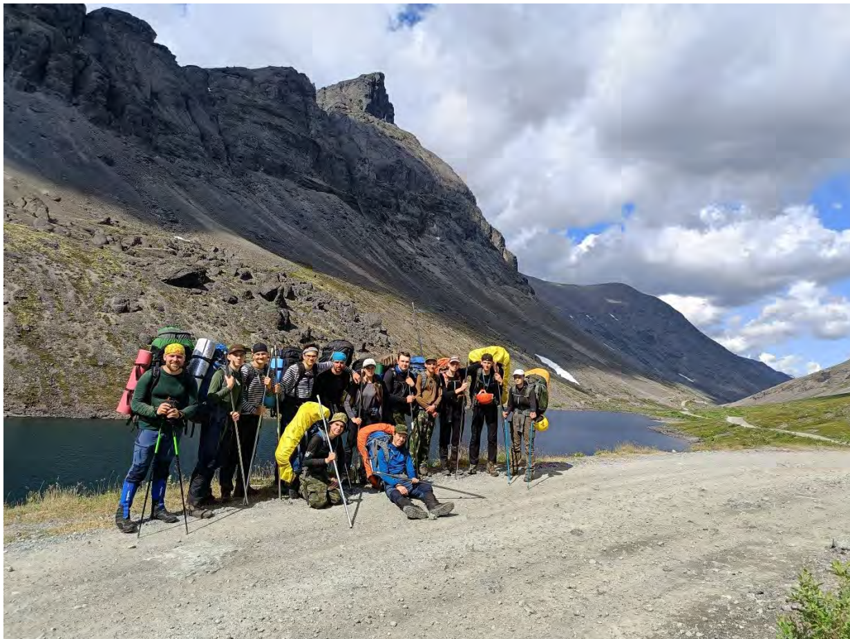
Фото 18 Перевал Кукисвум. Озеро Длинное

Переменная облачность. Выход группы в 9.55, предстоял затяжной путь, длиной в 26км. Прошли вдоль берега оз. Малый Вудъявр, через 200м перекресток, на нем идем прямо и выходим на дорогу, ведущую в северном направлении к пер. Кукисвум и Кукисвумчоррскому руднику... на перевал мы подошли в 11.56 (фото 18).