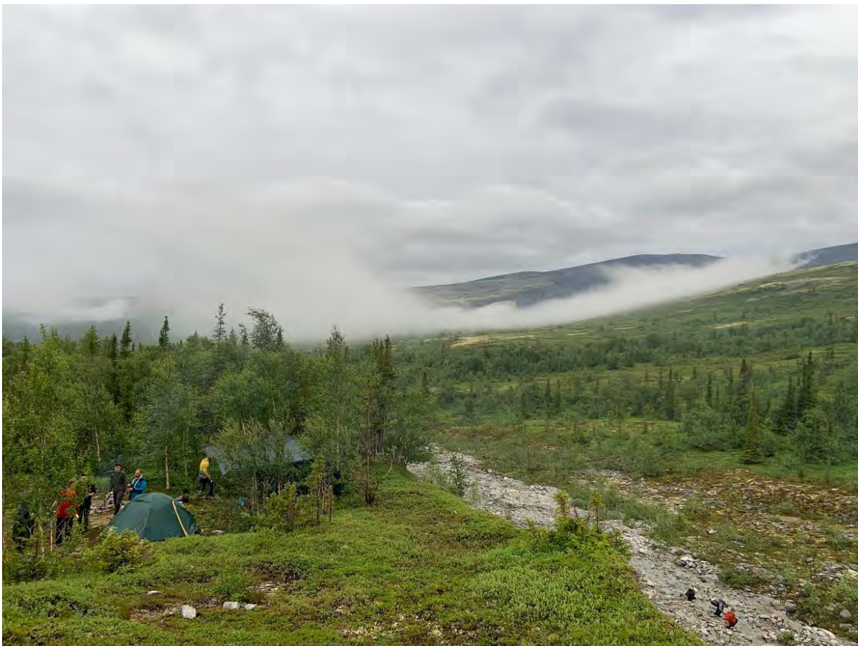
Фото 28 Вид на стоянку близ перевала Эвеслогчорр. Вид на долину ручья Шумный