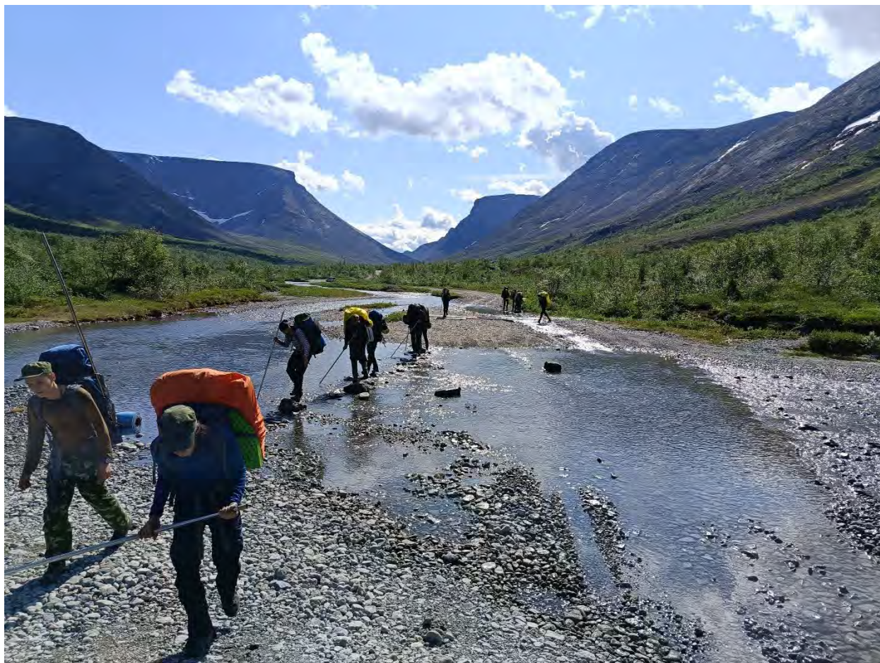
Фото 19 дорога на базу ПСС от перевала Кукисвум

день. Дров действительно очень много, баню можно топить неделями. На берегу озера несколько стоянок, удобных для одной или нескольких групп туристов. Можно обустроиться и левее, на берегу р. Куньок, но это не очень удобно для купания, поскольку течение довольно сильное. Мы встаем на берегу озера, начинаем готовиться к дневке и бане. Для данных целей место считаю идеальным – вода, дрова, отсутствие (как правило) шумных соседей, если есть навыки, то можно заняться рыбной ловлей. (фото 21)