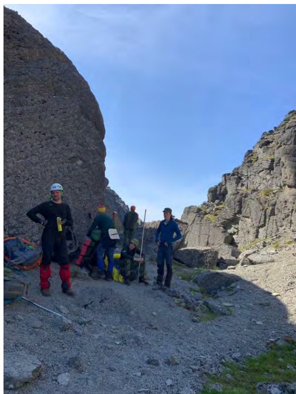
Фото 5 вид на Ущелье Аку-Аку