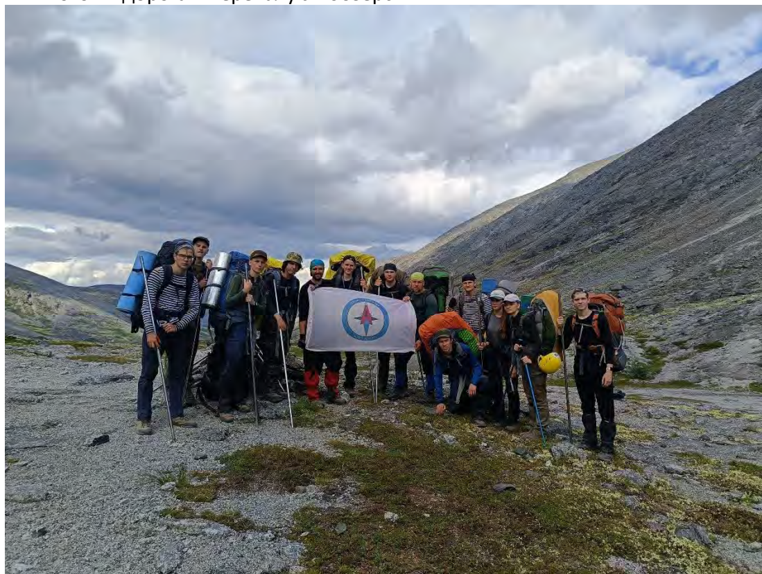
Фото 23 Перевал Умбозерский