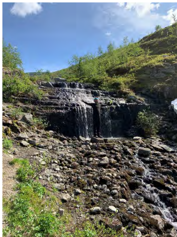
Фото 6 Водопад, близ оз. Изумрудное в Ущелье Аку-Аку