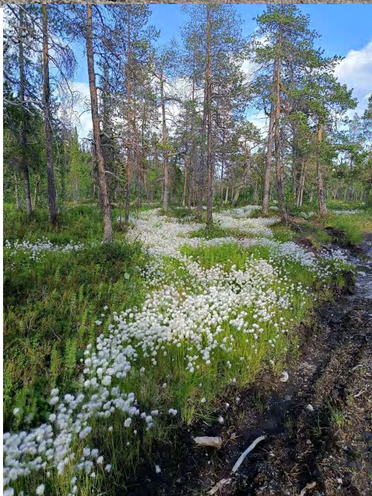
Фото 25 Дорога от перевала Умбозерский