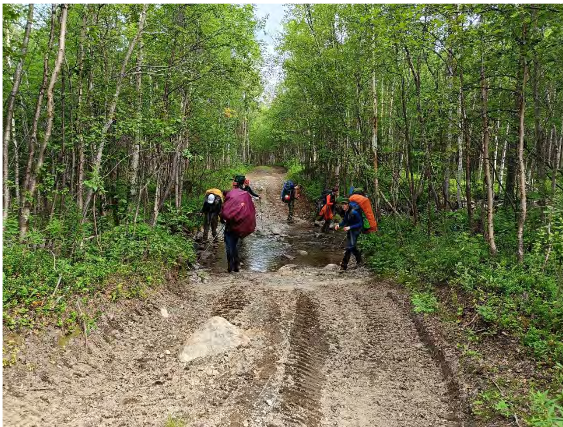
Фото 8 Брод через ручей Медвежий