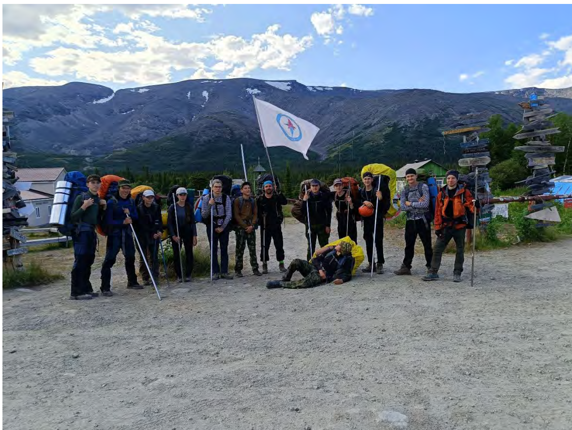
Фото 20 База ПСС