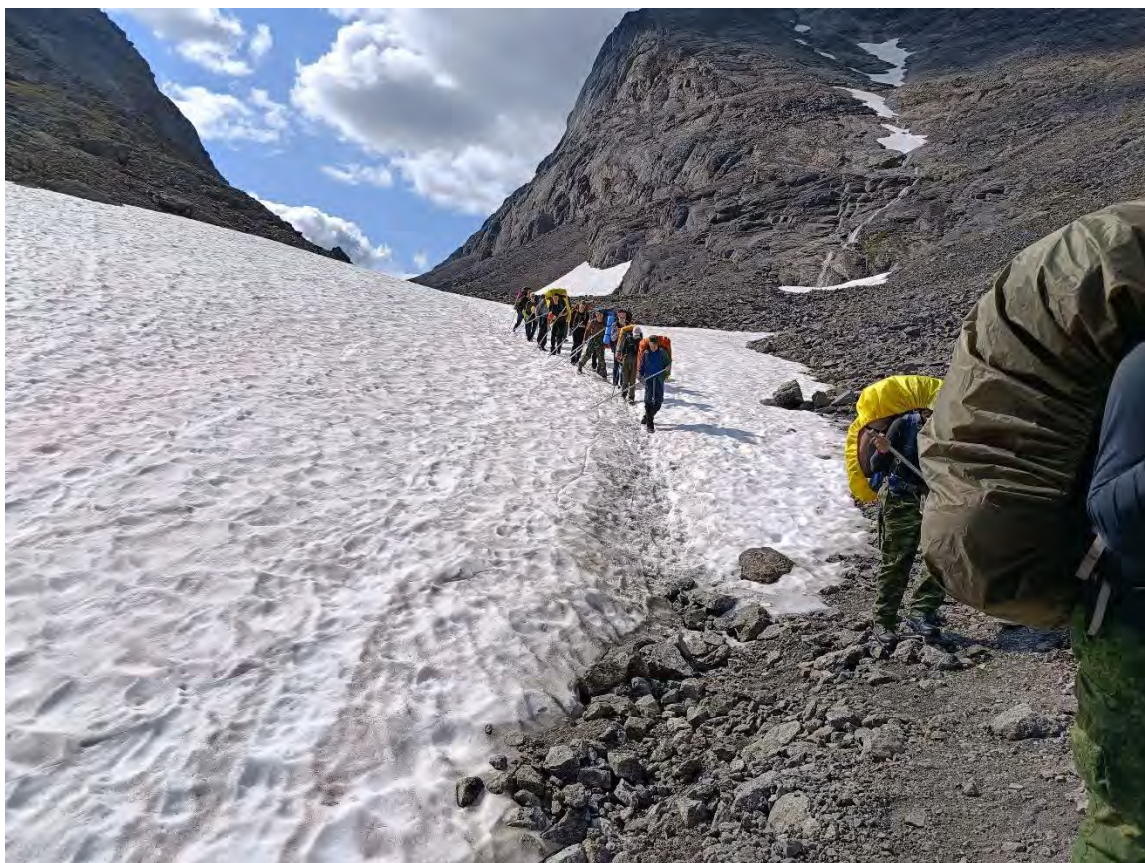
Фото 16 начало спуска с перевала Рамзая со стороны долины реки Поачвуйок