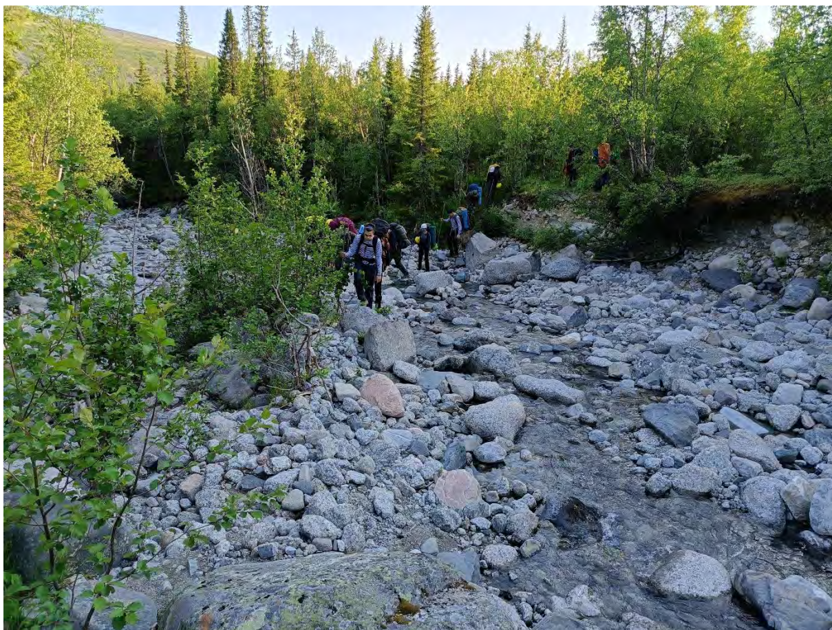
Фото 11 Брод через правый приток реки Малая Белая