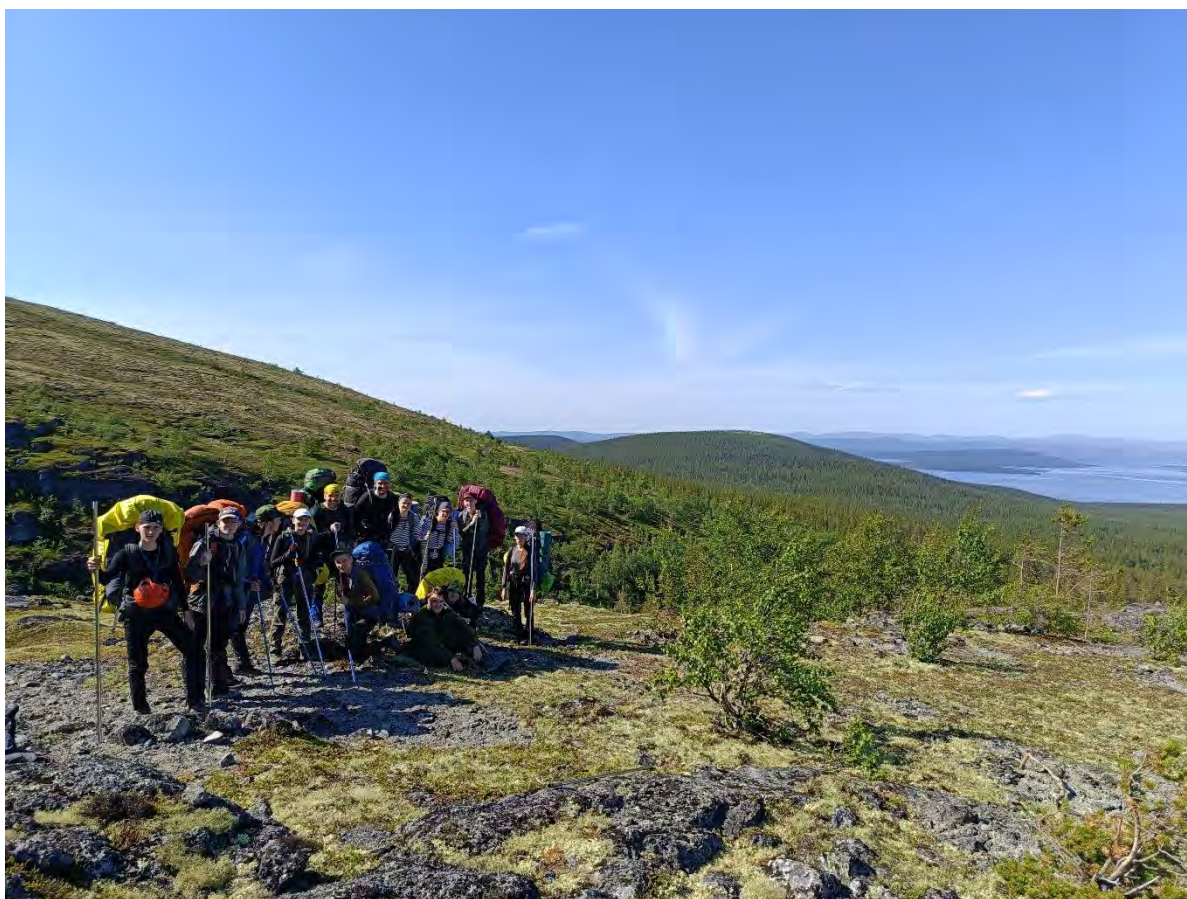
Фото 4 вид на озеро Имандра с северной вершины Щели Крест