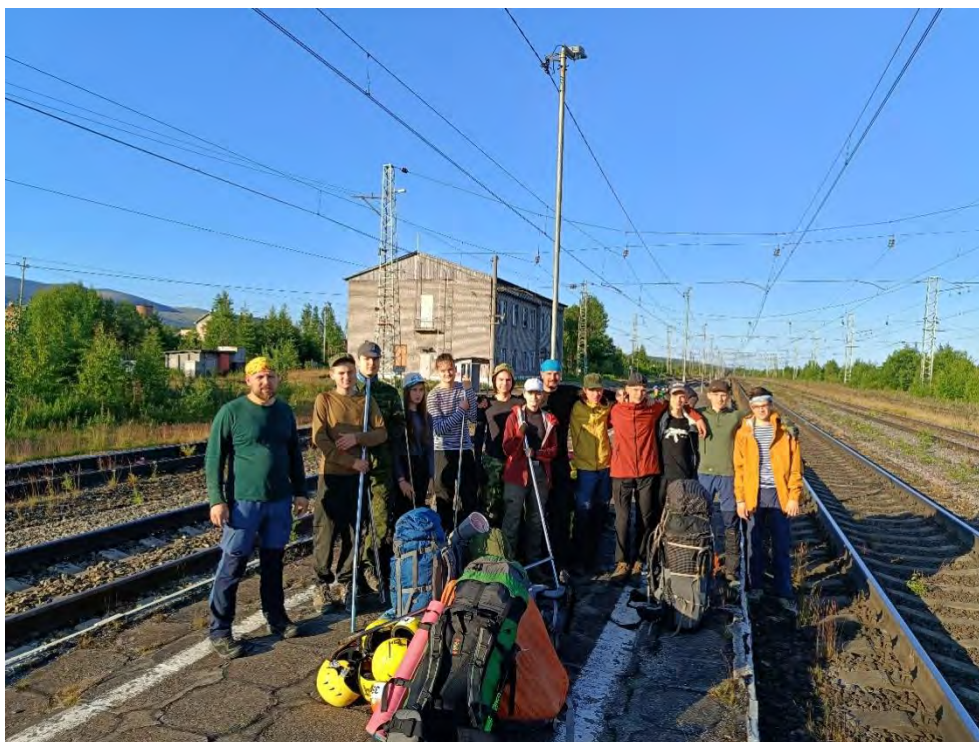
Фото 1. Прибытие на ж\д станцию Хибины

Стоянку организовали близ ущелья Звездочка верхняя на левом гидрологическом берегу ручья, текущего от перевала Юмьекорр. Место отличное, дров много, мест для стоянок достаточно для большой группы.