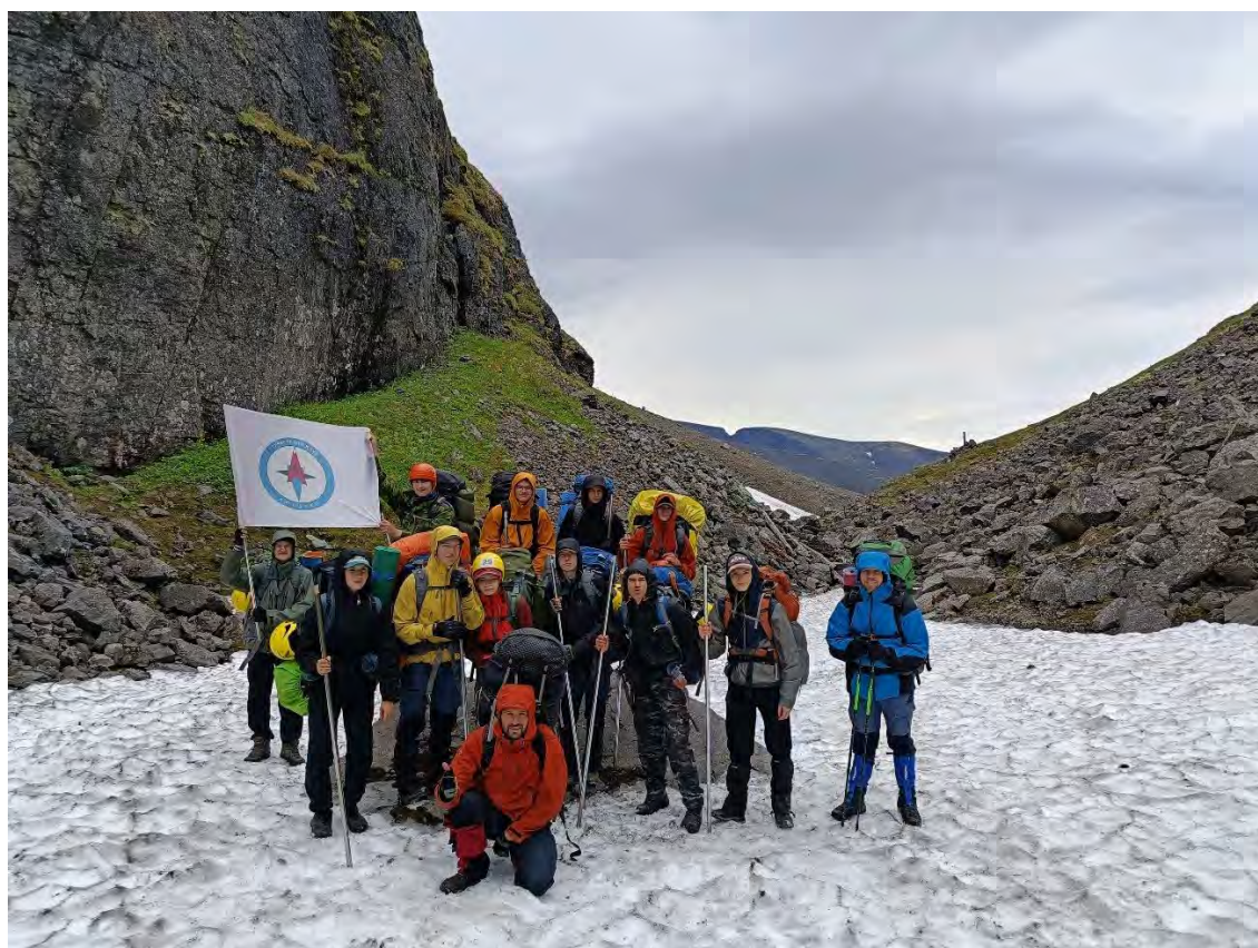
Фото 33 перевал Юкспорлакк вид на Кировский рудник

На следующий день вышли в город Кировск.