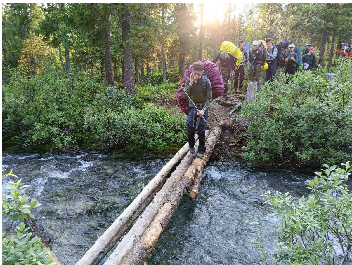
Фото 12 Брод через ручей Ферсмана.