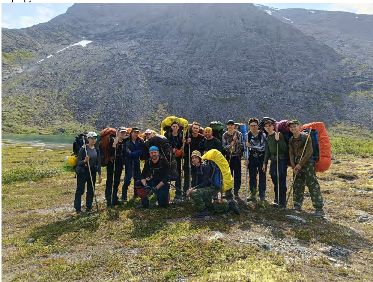
Фото 13 озеро Тахтаръявр

Утро вновь радует. Солнечно. Выход группы с места ночевки в 10.30 путь пролегает на восток вверх по течению реки Малая Белая, по хорошей грунтовой дороге до оз. Тахтаръявр до которого 4,7км, пришли мы к нему в 11.35, шли довольно бодро. Сделали классные фото (фото 13) . Далее пролегает тропа, которая хорошо видна ведущую на восток в ущелью Рамзая. По дороге заглянули к озеру близ перевалов Петрелиуса, оно оказалось сильно обмелевшим. Поднялись в ущелье по хорошей тропе и небольшим камням. (фото 14) В 14.30 сделали фото в ущелье и двинулись дальше. (фото 15) На выходе из ущелья снежники, аккуратно выходим на тропу, ведущую вниз по течению по левому берегу реки Поачвумйок. (фото 16) Через 3,6 км на развилке тропы нужно идти вверх по насыпи, а не вдоль берега. По верху идет замечательная дорога, если продолжить движение вниз, то будет не комфортно. Будьте внимательны! Держитесь левее. Группа двигалась по тропе 1,1км, затем началась хорошая грунтовая дорога. По ней мы прошли еще 1,9км и окончили наш день на берегу озера Малый Вудъявр. (фото 17) Место искали долго, все было занято, народ приехал отдыхать, не мудрено, суббота. Учитывайте этот факт при планировании маршрута.