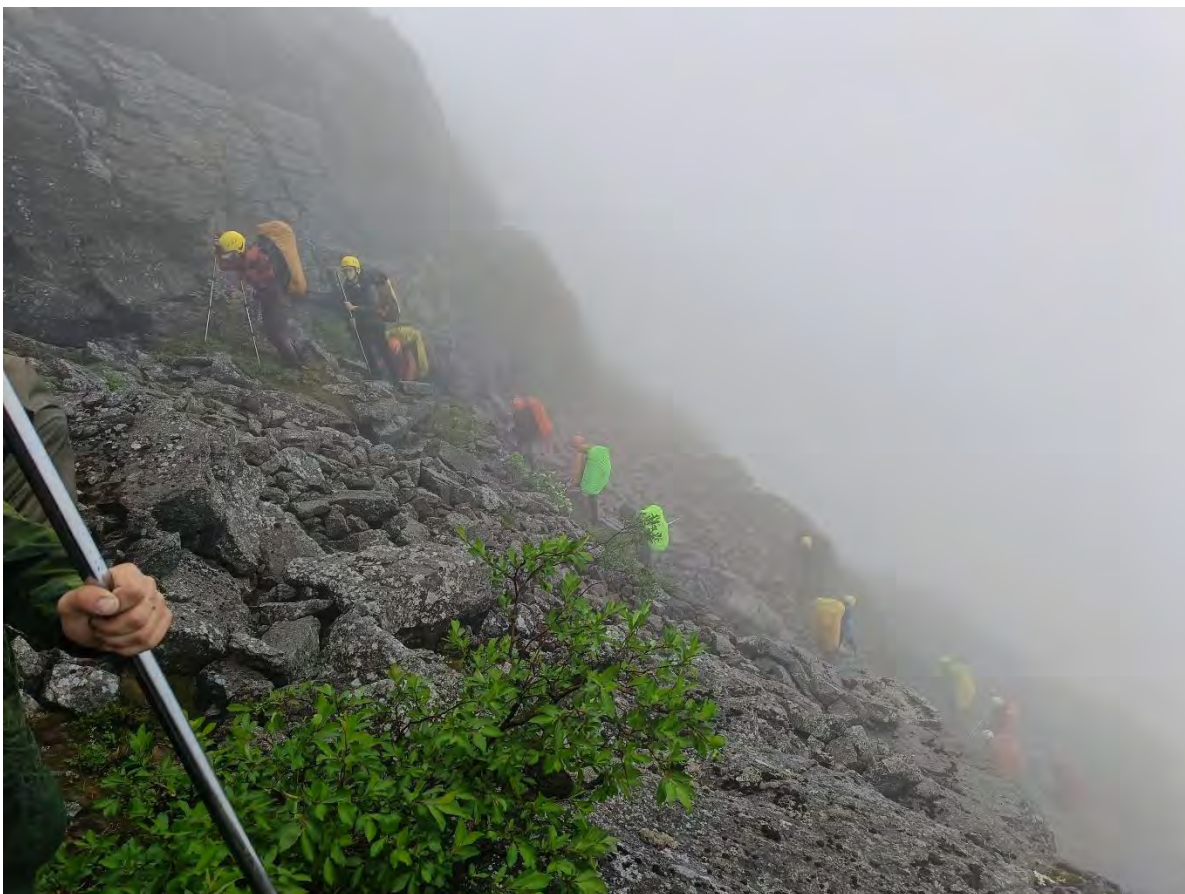
Фото 31 Подъем на перевал Эвеслогчорр 3.