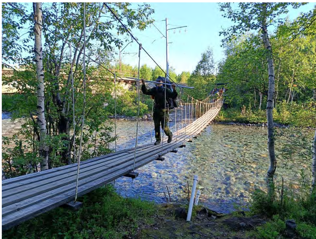
Фото 2. Мост через реку Гольцовка