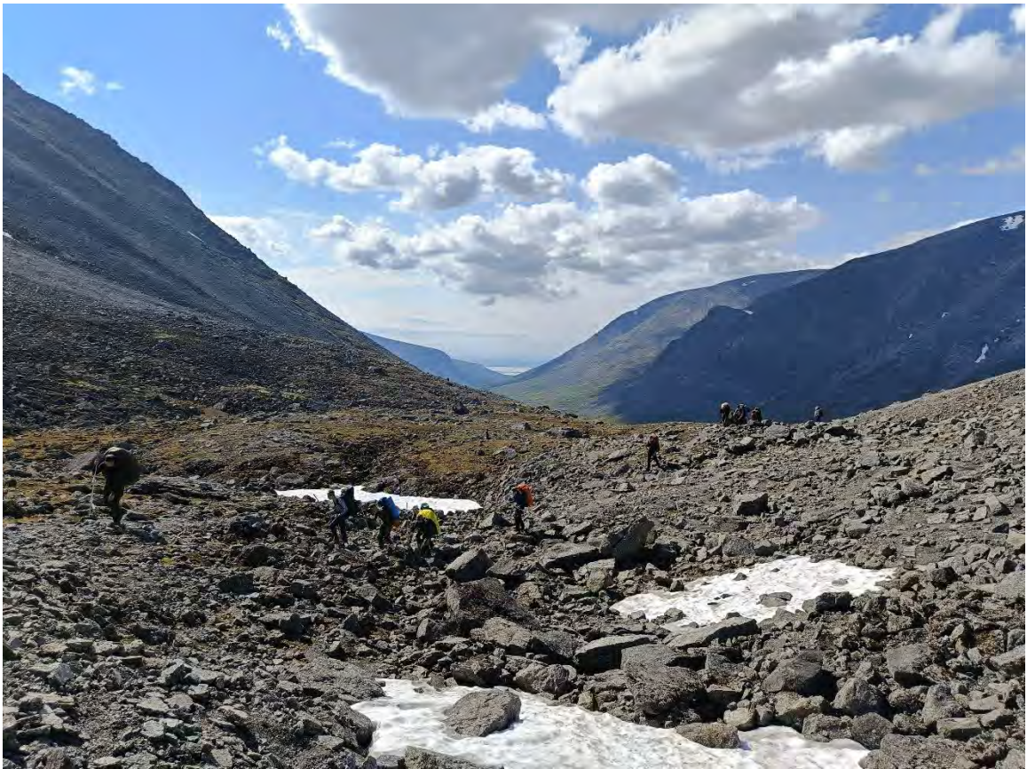
Фото 14 вид с подъема в ущелье Рамзая на долину реки малая белая и озеро Имандра