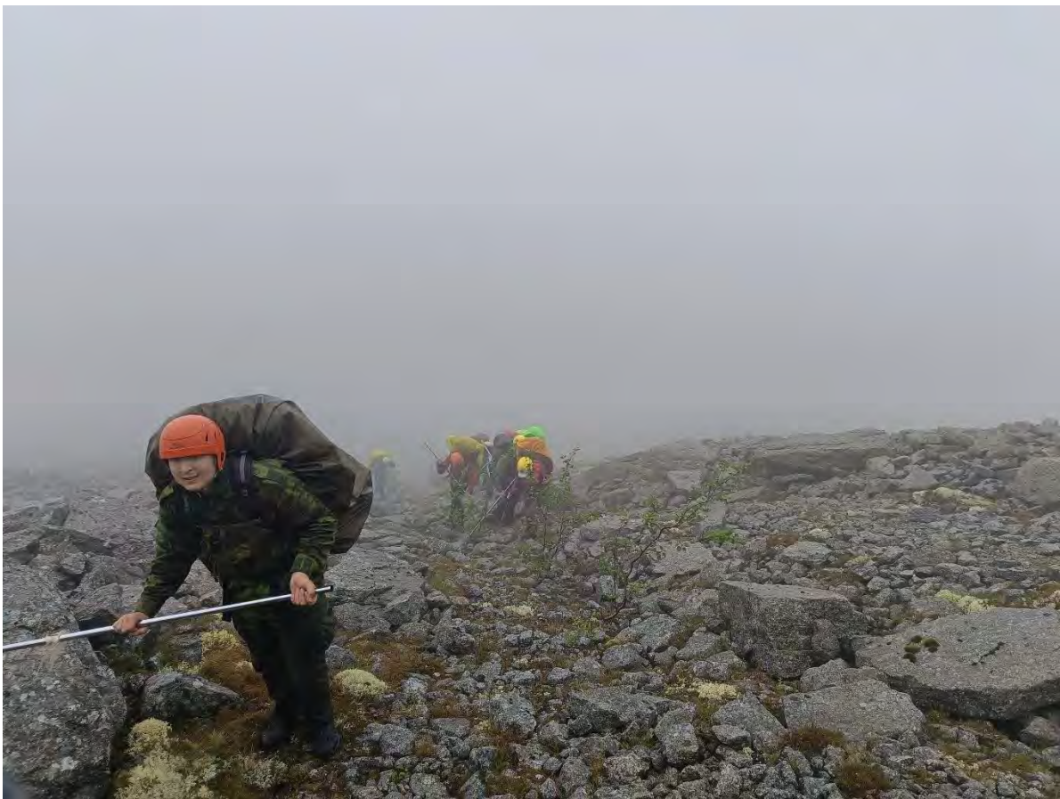
Фото 30 Начало подъема на перевал Эвеслогрорр 3.