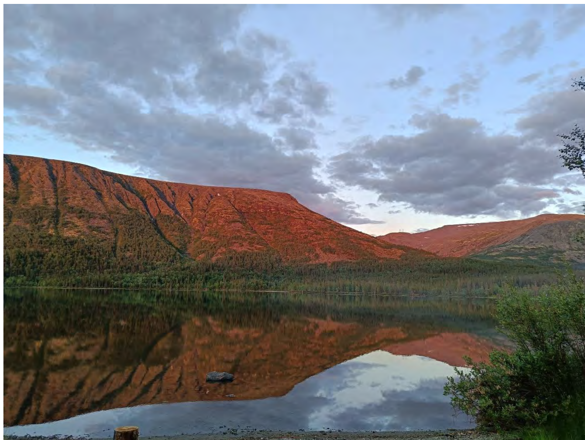
Фото 21 озеро Щучье на закате