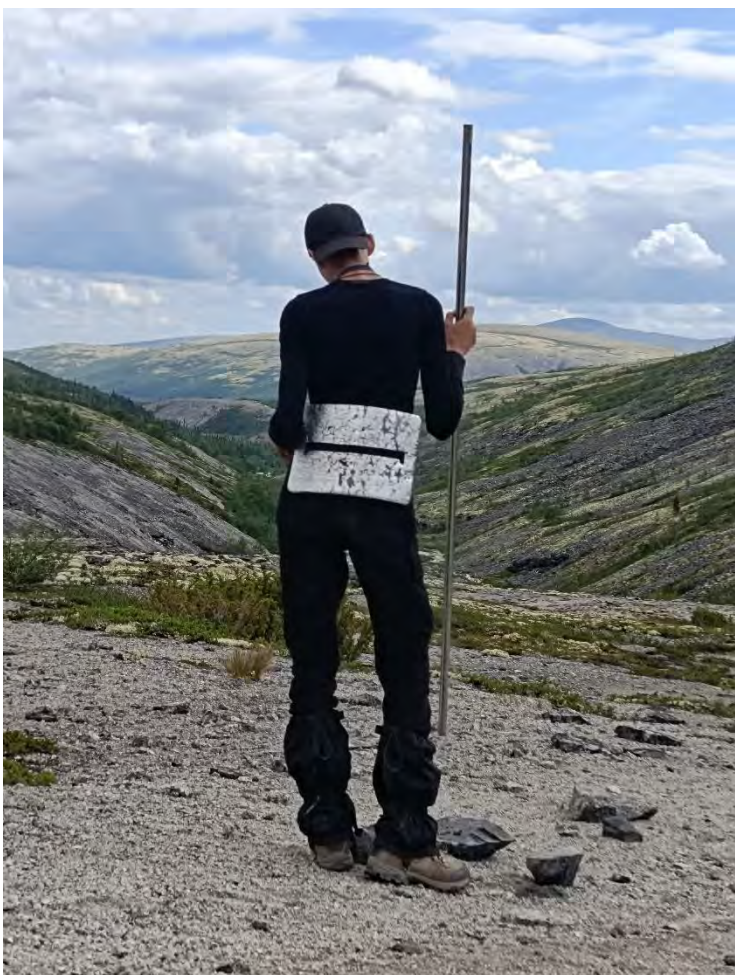
Фото 24 вид на долину реки Каскаснюйок