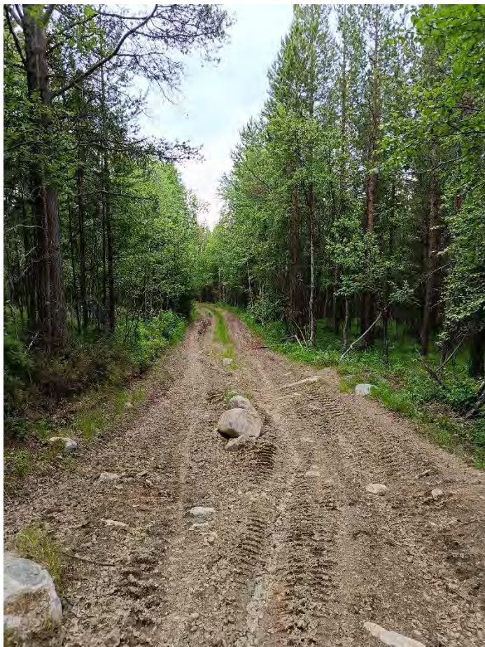
Фото 7 дорога к ручью Медвежий и реке Малая Белая