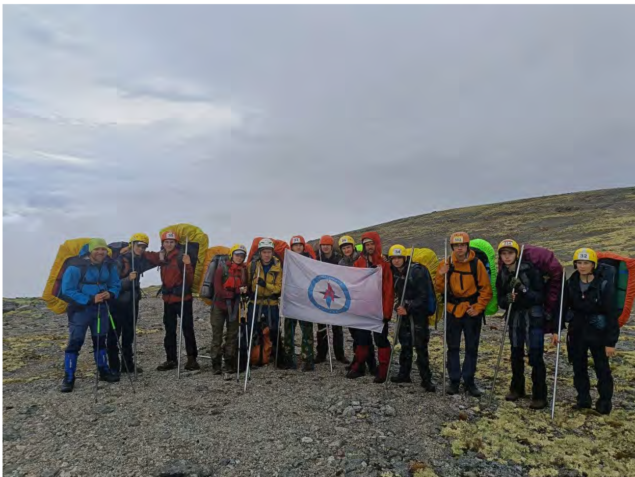
Фото 32 Перевал Эвеслогрорр Западный.