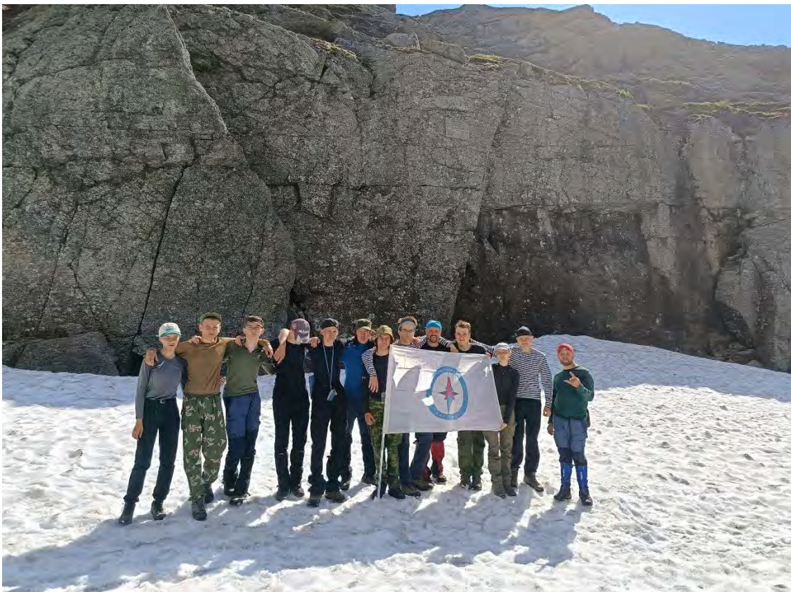
Фото 15 Перевал Рамзая