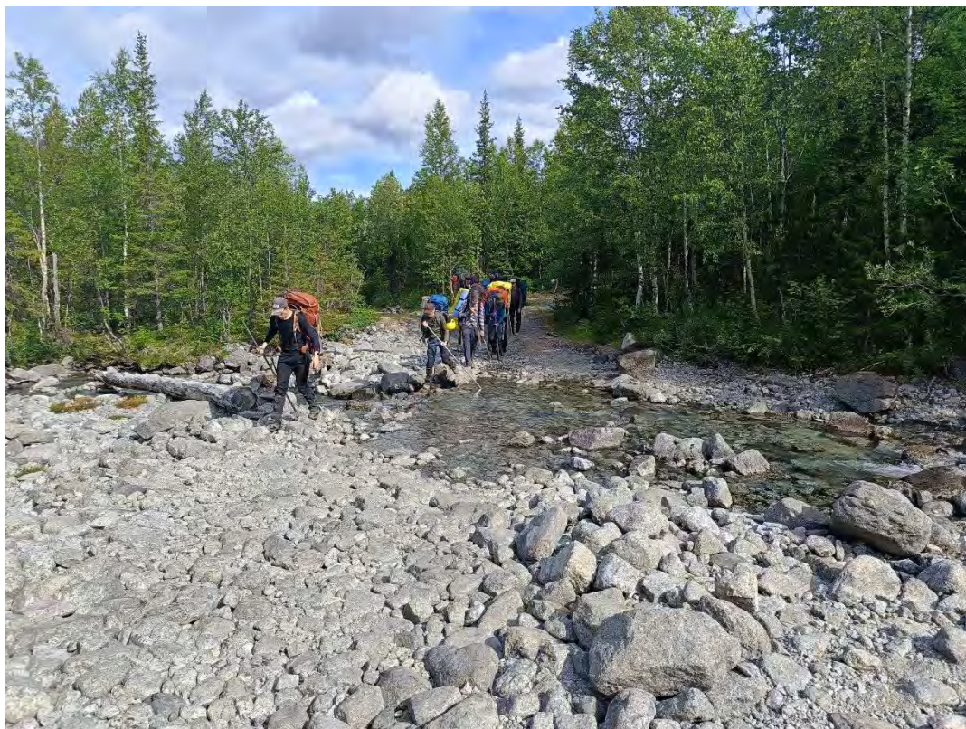
Фото 22 дорога к перевалу Умбозерский

Пройдя по дороге 9.4 км в восточном направлении в 18:40 подошли развилке дорог. Мы повернули на юг, и пройдя 150м встали на ночлег у родника. Место очень хорошее, дров много, мест для палаток много.