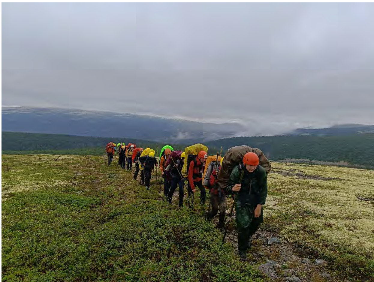
Фото 29 Дорога к перевалу Эвеслогчорр 3 в долине ручья Шумный.

Спуск осуществляли вдоль правого берега ручья Астрофелитового. Через 1 км в ручей впадает правый приток. Сначала надо пересечь ручей Астрофилитовый на левый берег и через 150м после слияния с притоком опять перейти на правый берег. Тропа не всегда видна. Если пойти левым берегом, то придется спускаться по крупному курумнику. Был найден оставленный кем-то большой кусок астрофилита, поделен и унесен. Далее тропа хорошо просматривается, спуск не занял много времени. В 15.43 мы уже располагались на стоянку