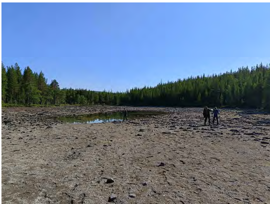
Фото 3. Пересохшее озеро близ Щели Крест