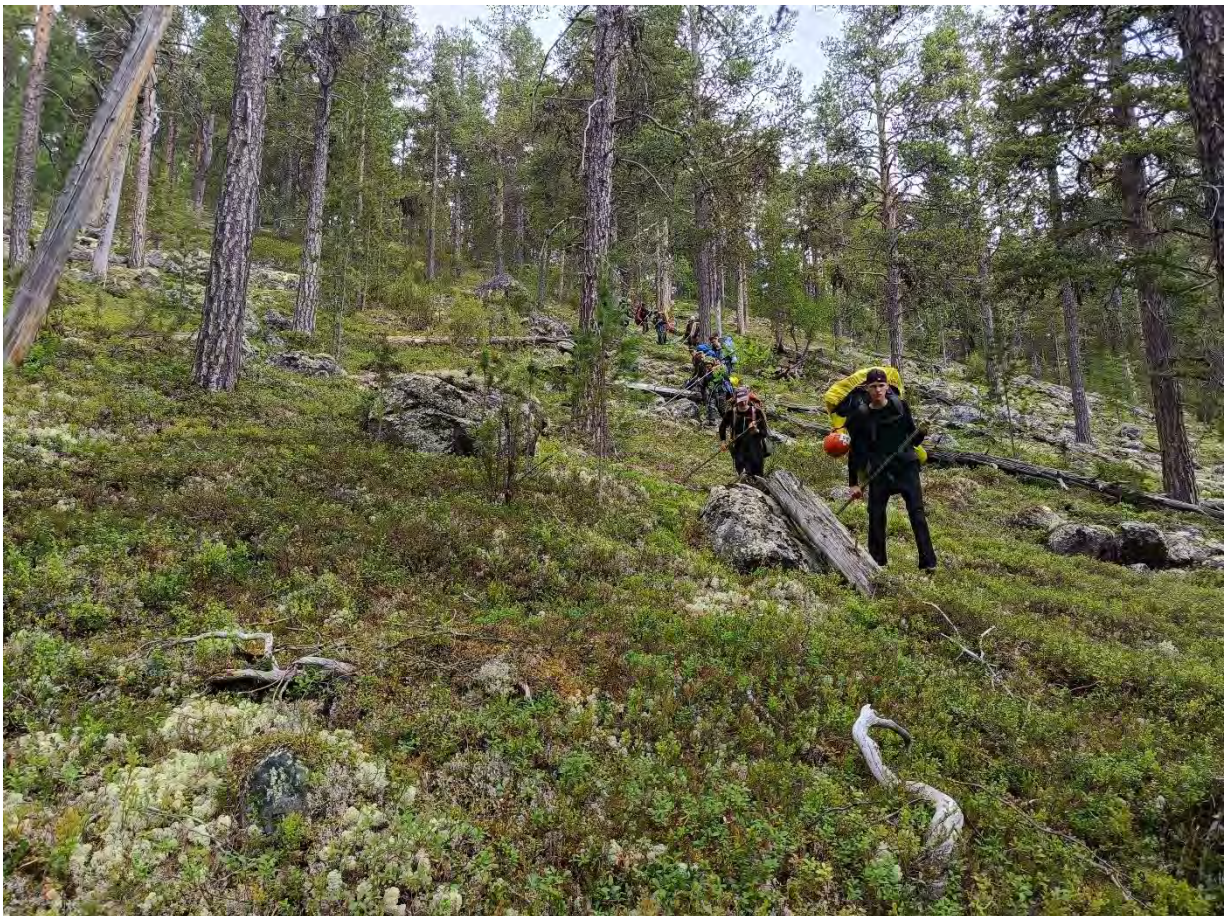
Фото 27 Спуск в долину реки Тулийок