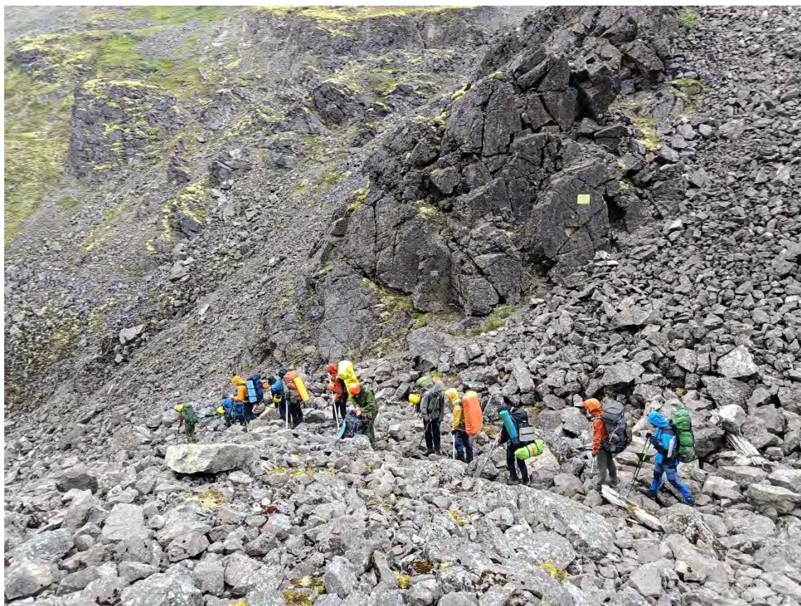
Фото 32 Движение по перевалу Юкспорлакк

находиться на ней нельзя. Если планируете выход через Юкспорлакк, то сразу идите до города, в этом районе останавливаться на ночлег нельзя.