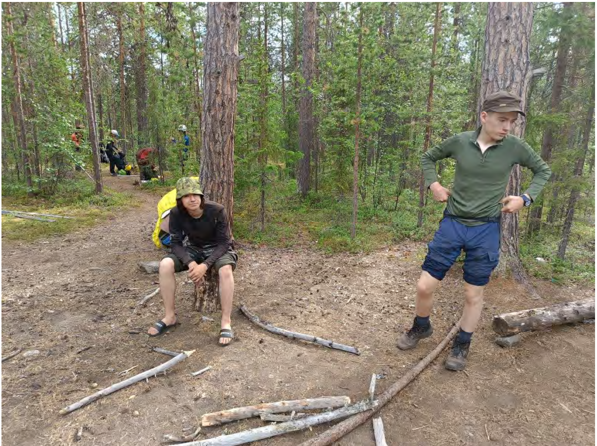
фото 26 Подготовка к броду