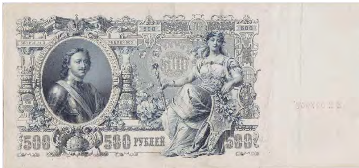
Банкнота Царская Россия 500 рублей 1912 год (Шипов) "Портрет Императора Петра I в латах"