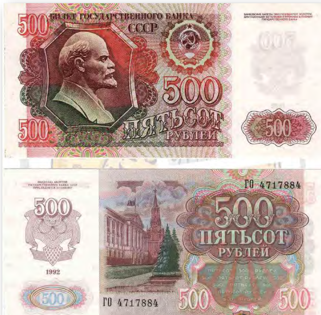
Банкнота Россия 500 рублей 1992 год "Профиль В.И. Ленина. Стены и Башни Московского Кремля"

26 ноября 2012 года ЦБ РФ выпустил серебряную памятную монету номиналом 500 рублей, посвящённую 200-летию победы России в Отечественной войне 1812 года (5 килограммов чистого серебра, тираж — 50 экз.).