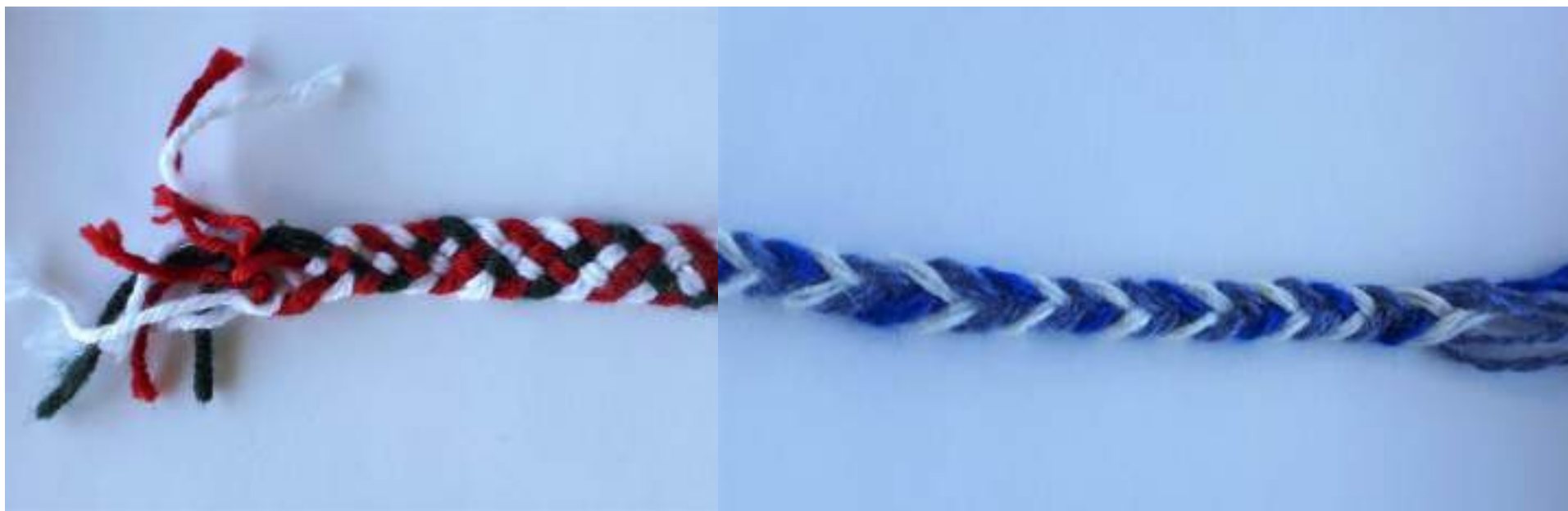
Слева работа Чижовой Слехсандры.