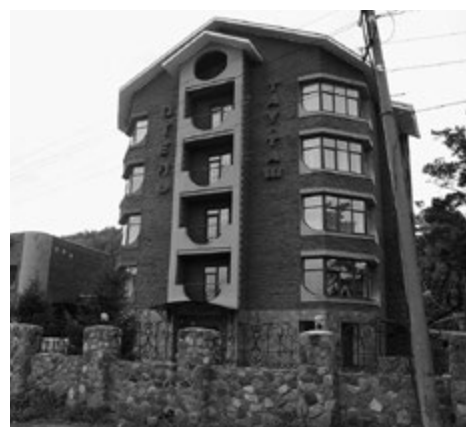
Прекрасное размещение в Абзаково – отель «Тай-Таш».