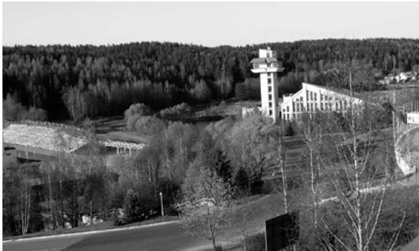
Олимпийский центр Раубичи под Минском.

Словакии, Венгрии, Чехии, Словении – тоже да. Даже в Германию, Австрию, Швейцарию, Францию добирались. А вот о ближайшем соседе как-то подзабыли.