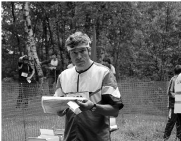
На старте первый российский чемпион мира Иван Кузьмин