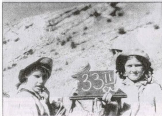
На съемках фильма в Крыму