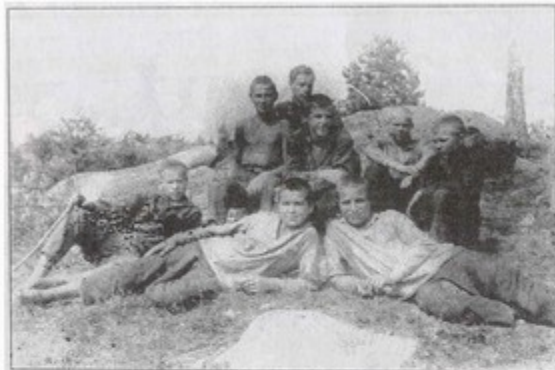
1933 год. Экспедиция в районе Ильменского заповедника