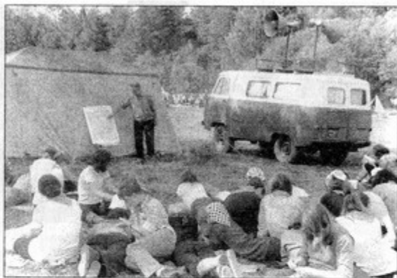
На туристском слете