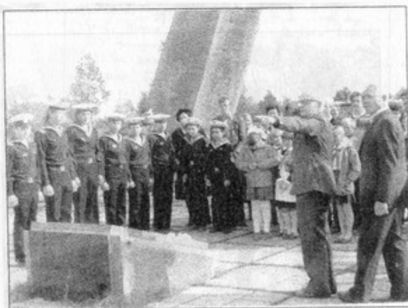
91 км Киевского шоссе. На рубеже обороны Москвы