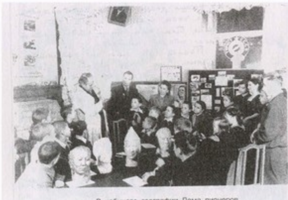
В кабинете географии Дома пионеров