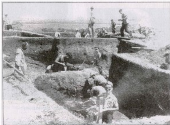
В экспедиции на археологических раскопках