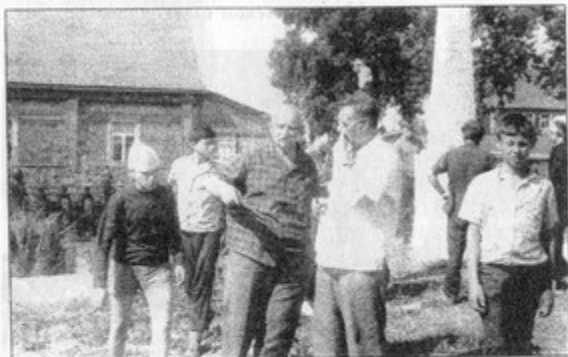
По местам боев 158-й Лиозно-Витебской дивизии