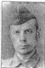
В годы войны