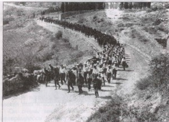
1931 г. 1-й сводный пионерский полк Москвы совершает поход по местам гражданской войны от Москвы до Севастополя