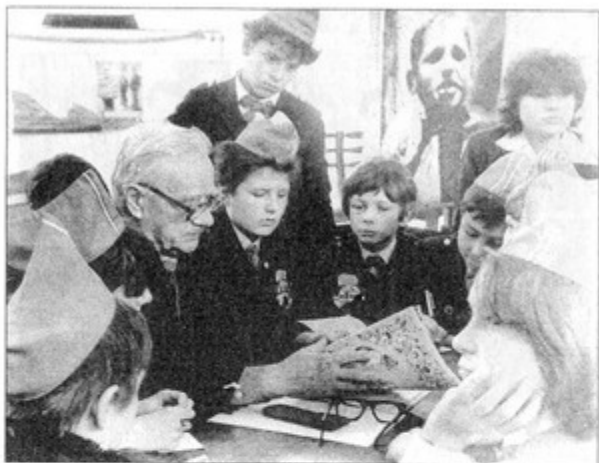
В кругу семьи