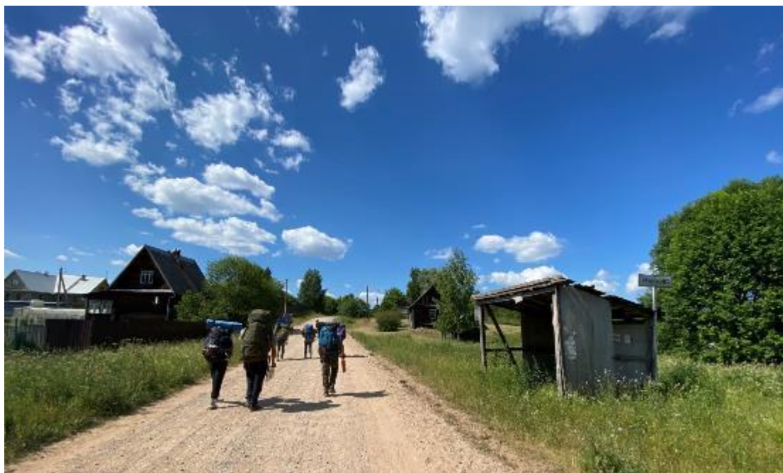
Фото 18 дорога в деревне Марково

Подъем как обычно 7.00 выход 10.00 из деревни Плав, возвращаемся до места вчерашнего обеда, делаем там привал и держим путь в сторону деревни Марково(фото 18) дорога грунтовая. Прямо перед деревней делаем обед, потому что есть чистая проточная вода река Либья. После деревни Марково через 6 км