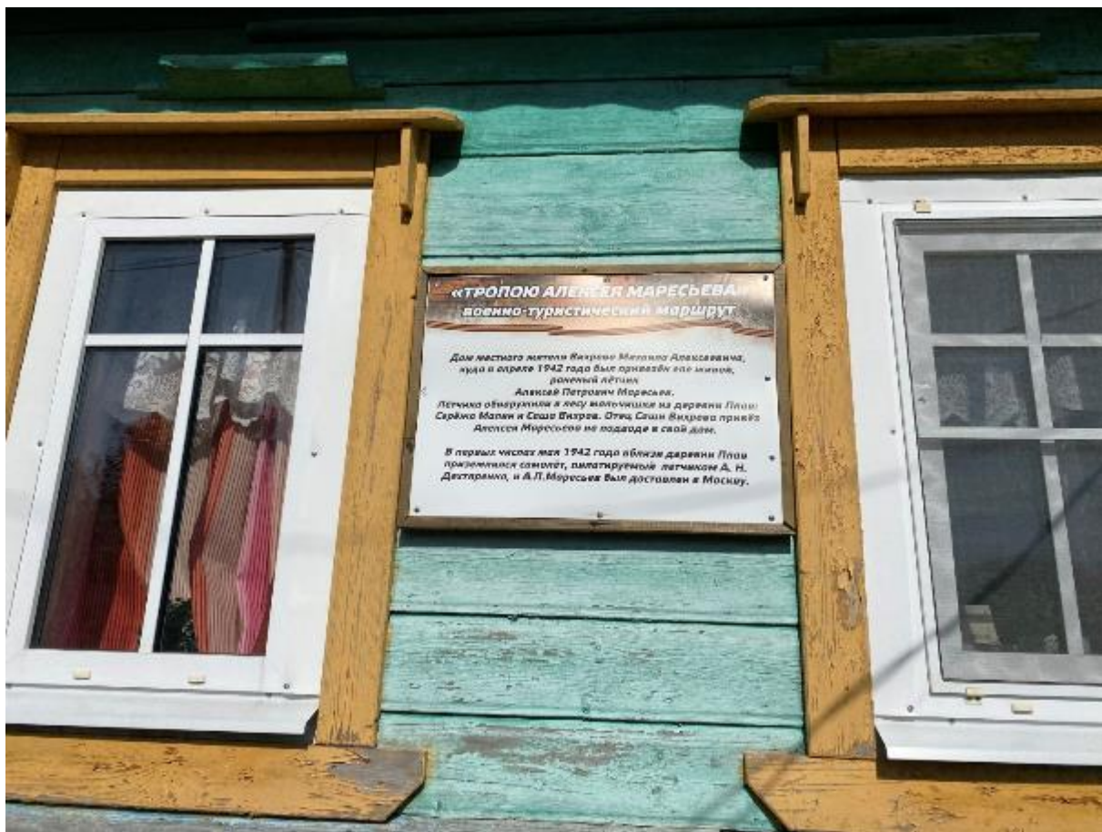
Фото 14 табличка на доме Вихрова