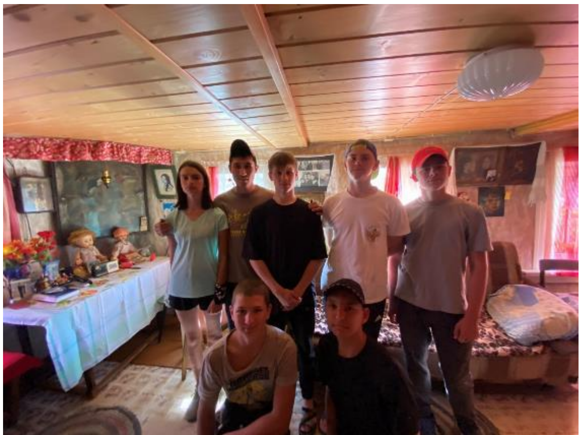
Фото 12 в доме Вихрова