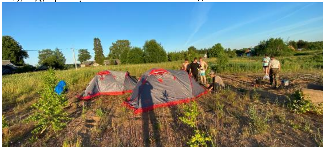
Фото17 лагерь возле деревни Плав

Вернувшись от мемориального комплекса в деревню мы встали на ночевку (фото 17), воду брали у местных жителей. Мест для ночлега не так много.