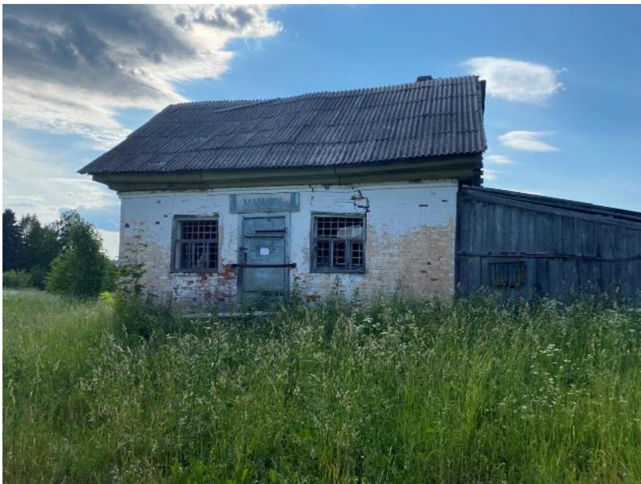
Фото 5 закрытый магазин в деревне Старово

Пройдя деревню идем в сторону деревни Ванютино, а потом на Бель по грунтовой дороге. Движения по дороге нет, за час 1 авто. В деревне Бель напротив разрушенной покровской церкви есть колодец, возле церкви можно поискать место под стоянку, но мы принимаем решение дойти до озера Шлино.