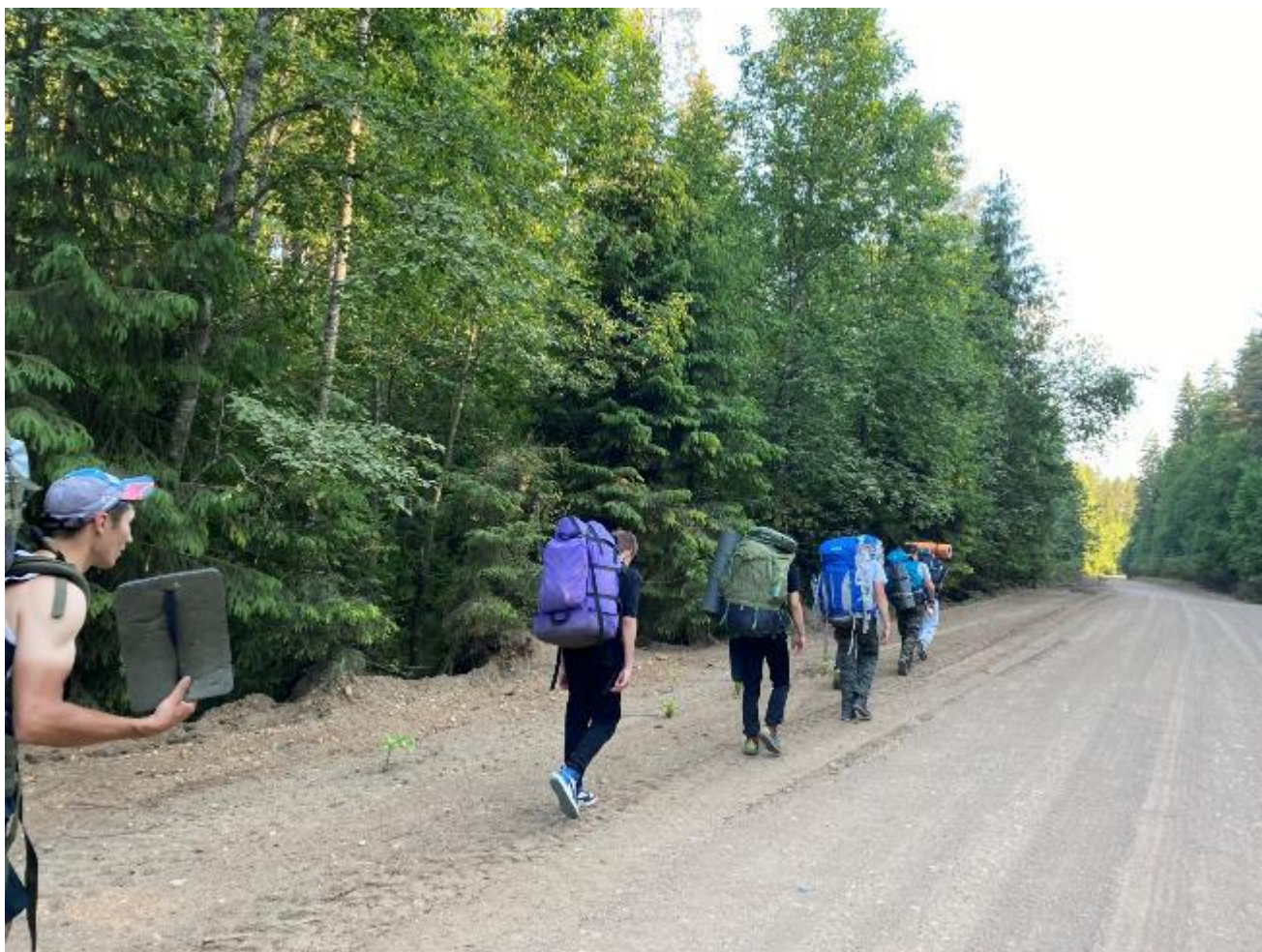
фото 2 грунтовая дорога

Пройдя 1,5 км дошли, до озера слева походу движения воинская часть, проход по дороге был разрешен, но периодически его могут перекрывать. Пройдя мимо КПП через метров 400 опять перекресток, повернули в сторону деревни Селище и через 100 метров встали на ночевку. Воду попросили на КПП.