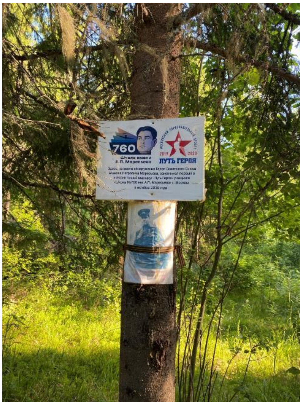
Фото 16 табличка Школы № 760 г. Москвы

Вернувшись от мемориального комплекса в деревню мы встали на ночевку (фото 17), воду брали у местных жителей. Мест для ночлега не так много.