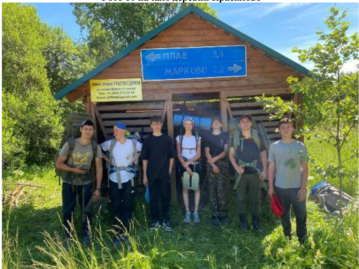
Фото 11 остановка на перекрестке Семенова гора, Марково, Красково.