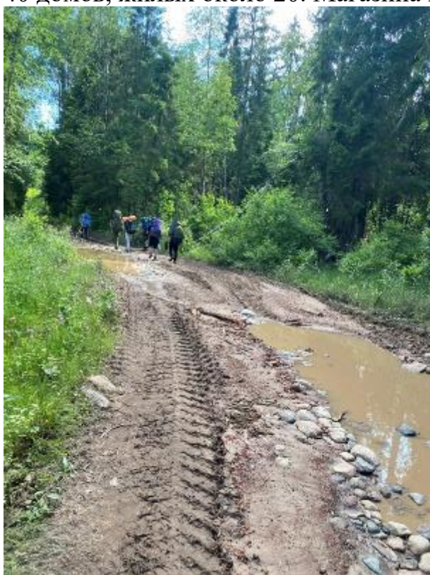
фото 4 лесовозная дорога

В 15.30 оставив деревню справа продолжили движение по лесовозной дороге в сторону деревни Старово (фото 4), через 4,5 км дошли до деревни. В ней примерно 40 домов, жилых около 20. Магазины нет, как и в других деревнях. (фото 5)