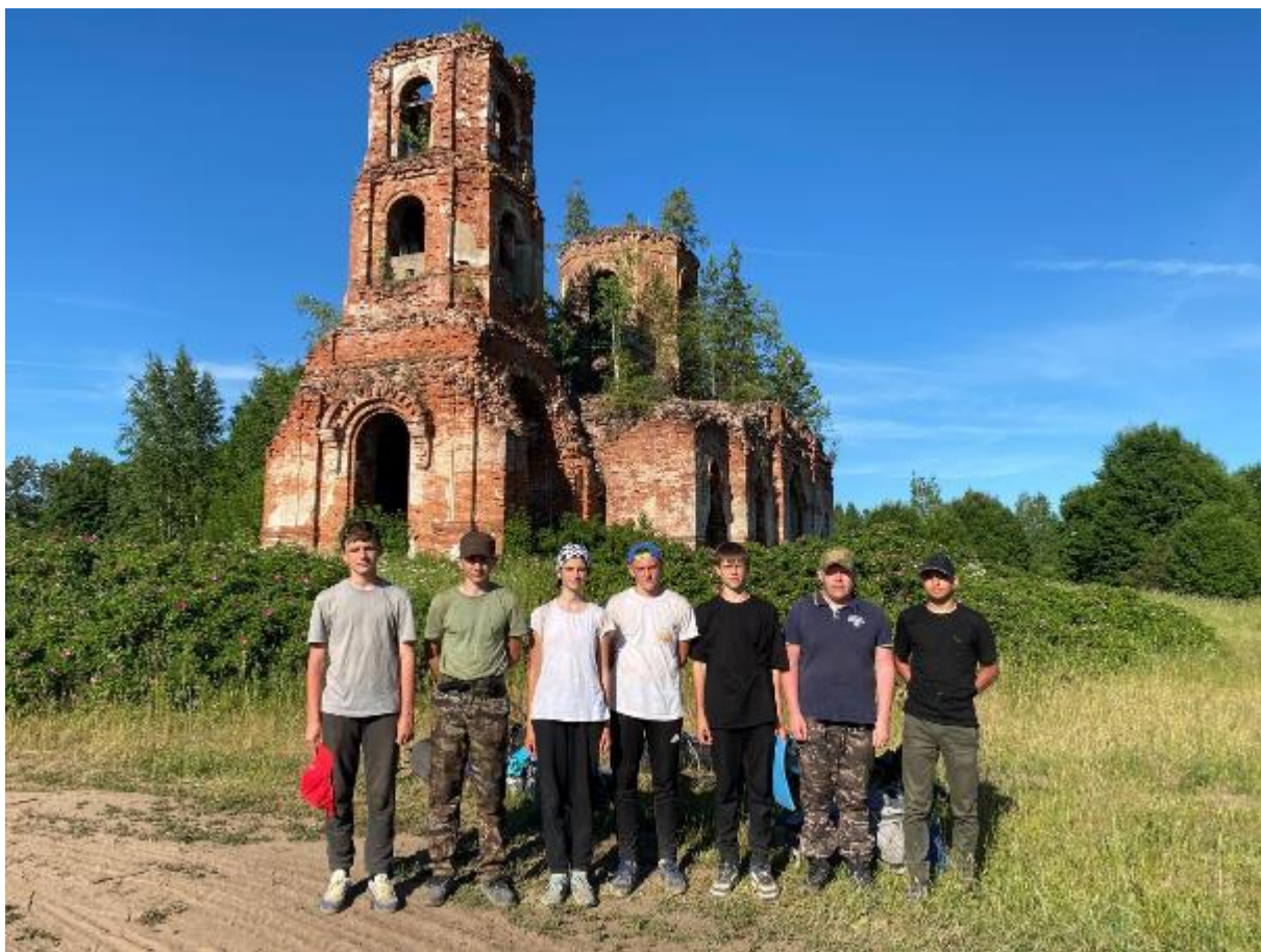
Фото 20 Церковь Иконы божьей матери в Русских Новиках