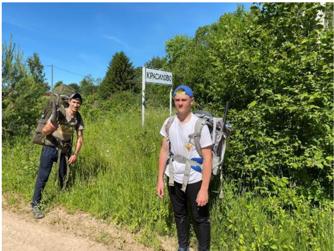
Фото 10 начало деревни Красилов