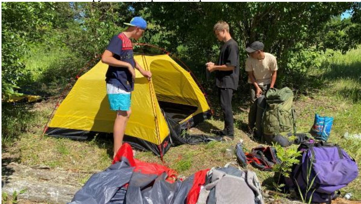
Фото 21 сбор лагеря

Подъем как обычно в 7.00 сбор лагеря (фото 21) и в 10.00 выход на маршрут. Из Русских Новиков по грунтовой дороге до деревни Ивантеево.