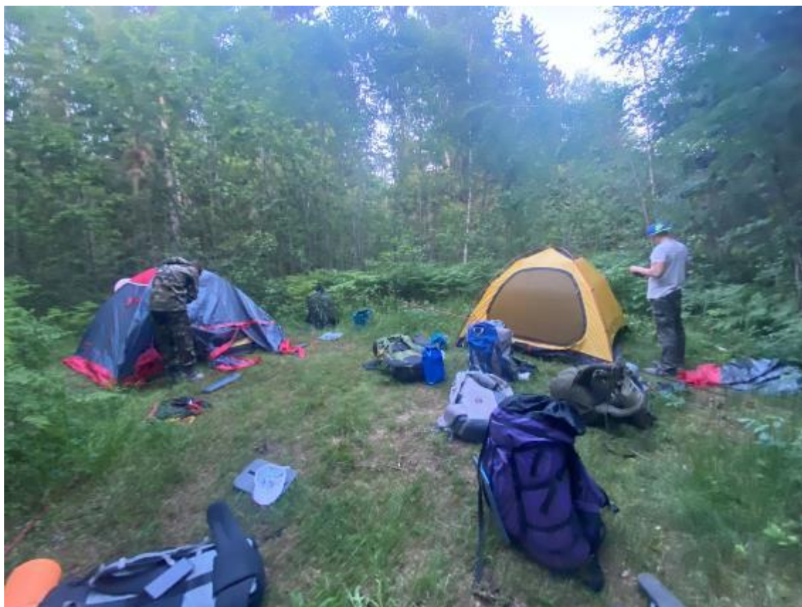
Фото 6 стоянка после деревни Речка