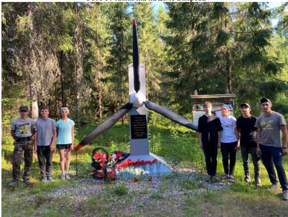
Фото 15 Памятник подвигу Маресьева