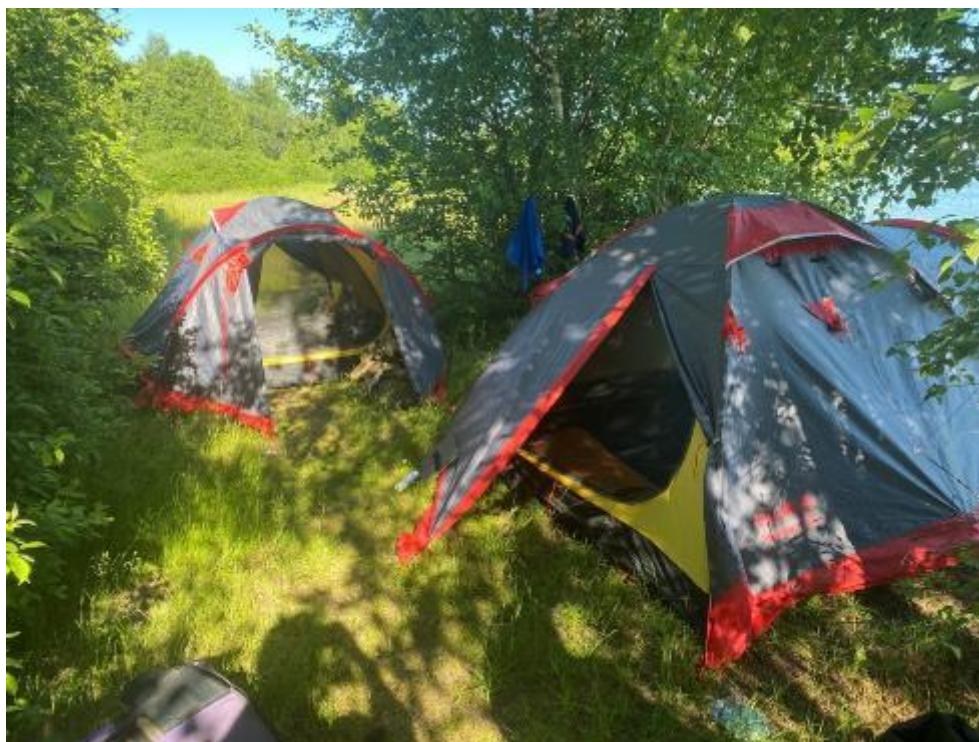
Фото 9 стоянка на озере Шлино