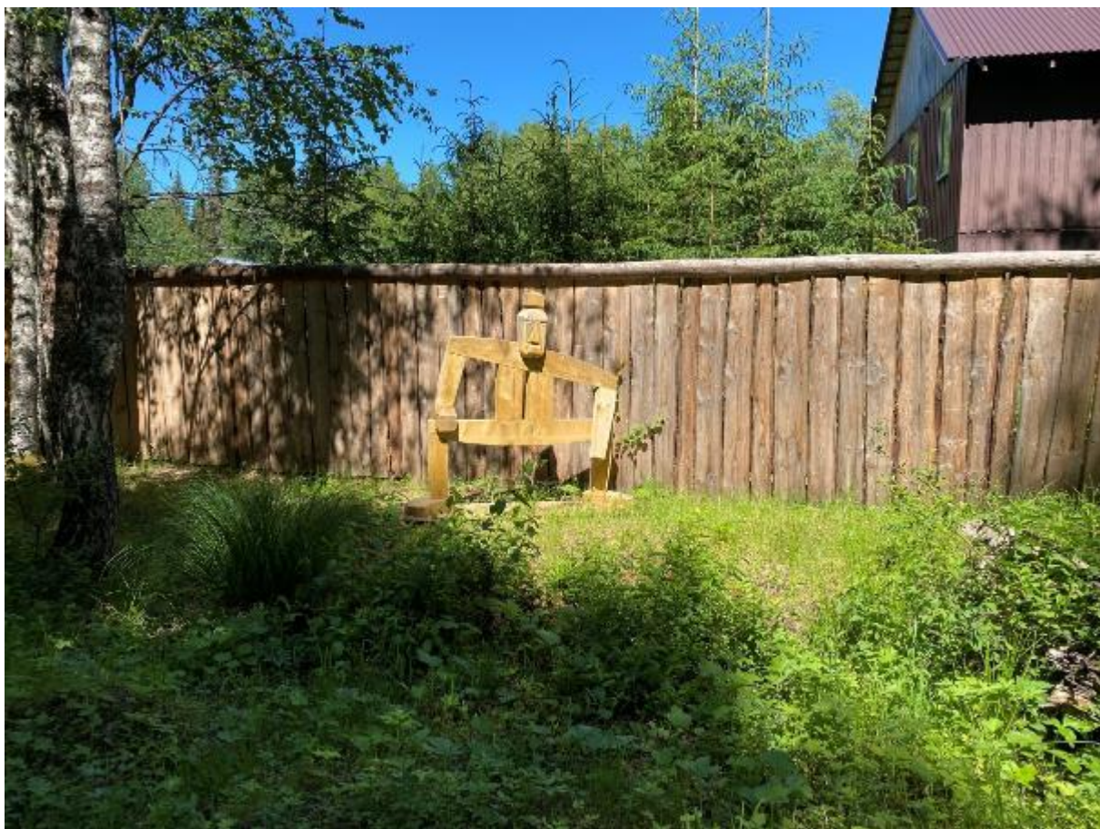
Фото 7 пилорама по пути к деревне Новинки