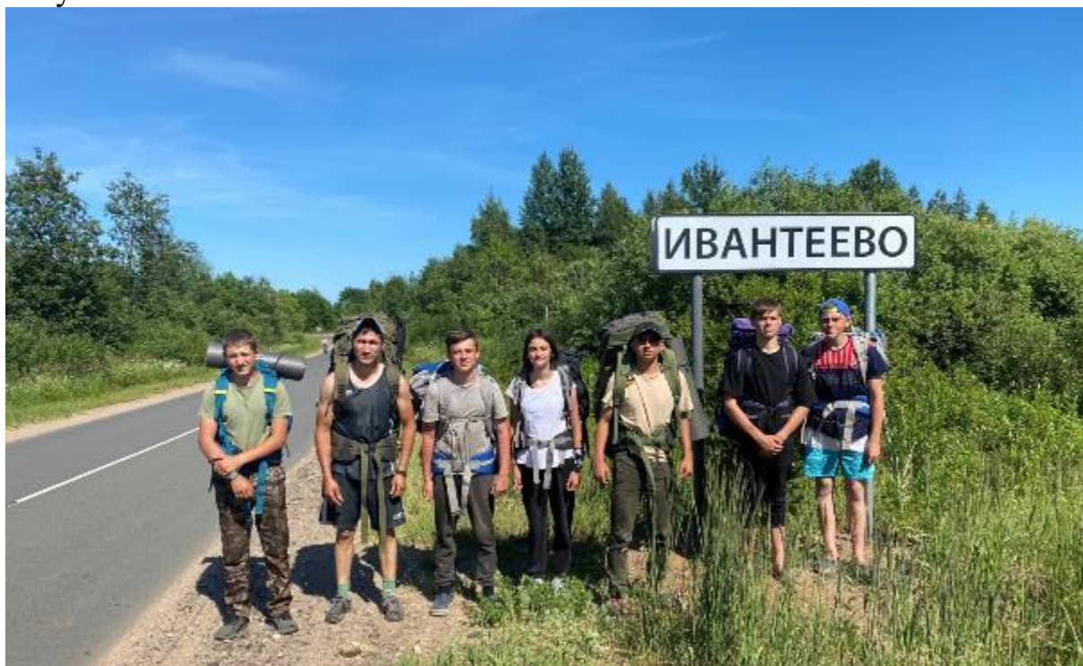
Фото 22 дорожный знак деревни Ивантеево

Через два с половиной ходовых часа проходим 11 км и доходим до финиша маршрута(фото 22), от куда едем на экскурсию в Иверский Валдайский Богородицкий Святоозерский мужской монастырь(фото 23) и от туда уезжаем в Москву.