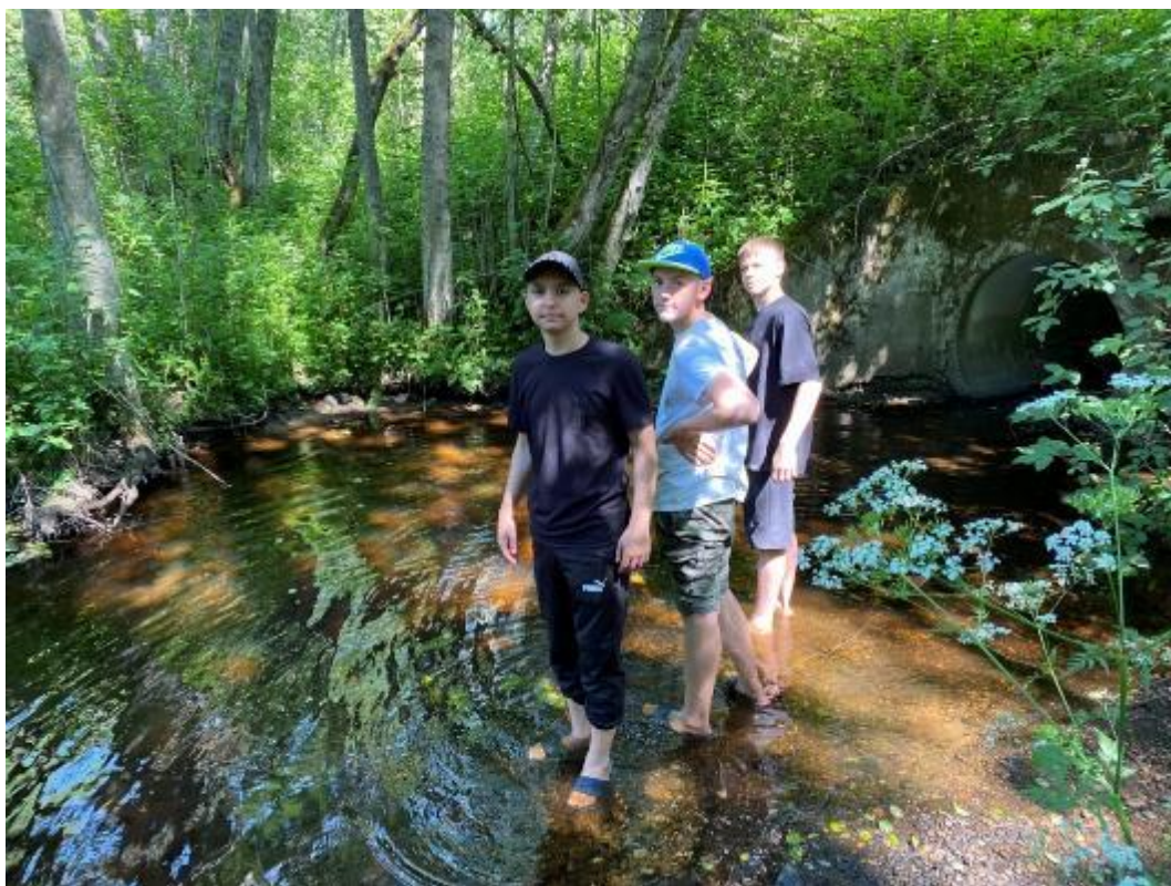
Фото3 ручей перед деревней Афанасово

В 15.30 оставив деревню справа продолжили движение по лесовозной дороге в сторону деревни Старово (фото 4), через 4,5 км дошли до деревни. В ней примерно 40 домов, жилых около 20. Магазины нет, как и в других деревнях. (фото 5)