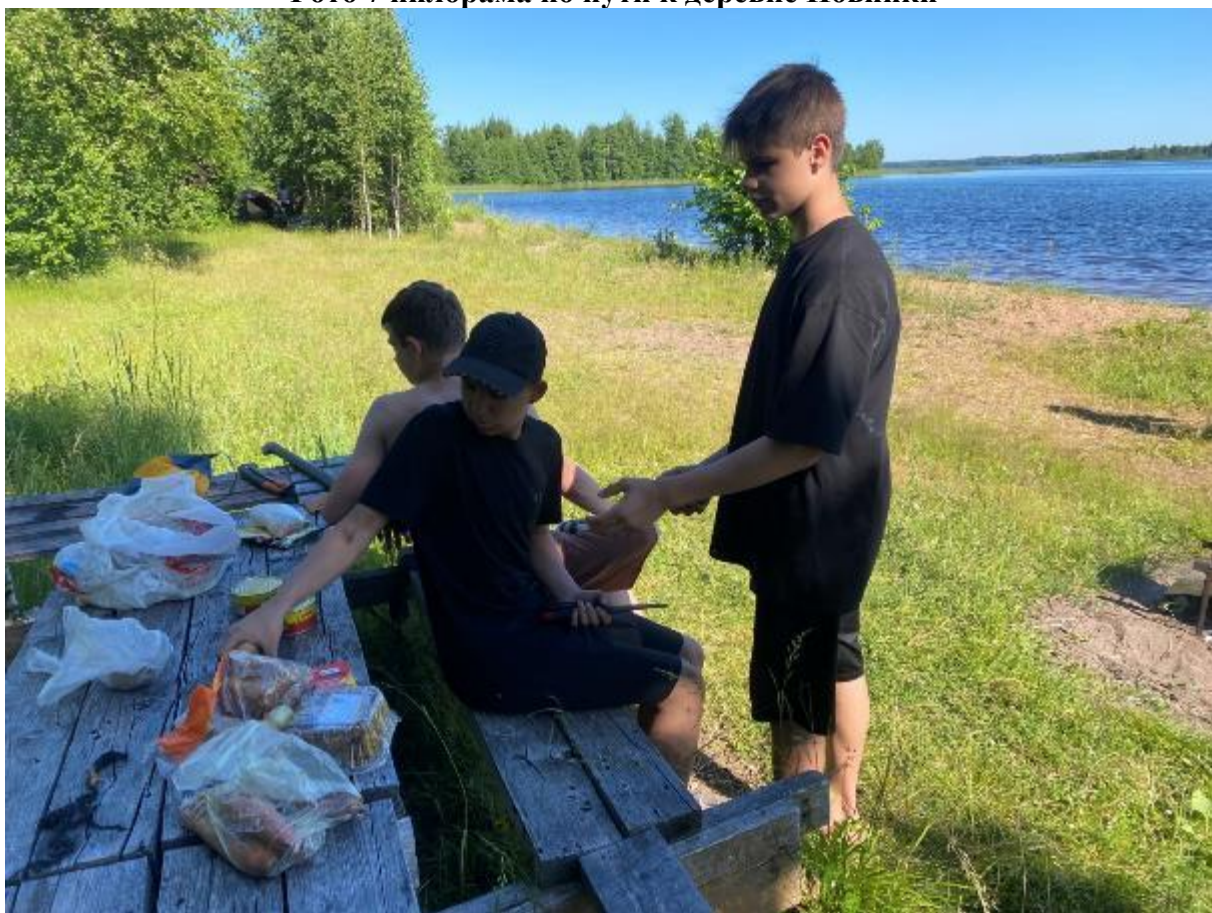
Фото 8 пляж на озере Шлино