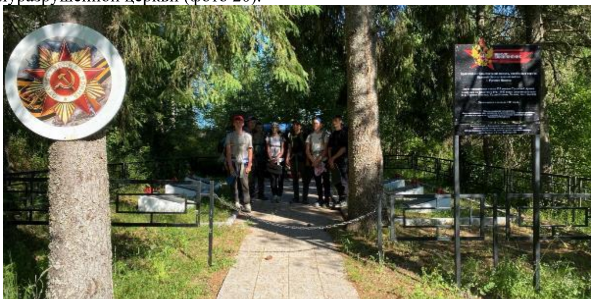
Фото 19 памятное захоронение

доходим до деревни Сухая Ветошь и поворачиваем направо на север в сторону деревни Русские новики, через 3 км будет родник слева от дороги, там берем воду на ужин, справа перед деревней будет братская могила солдат, погибших защищая родину во время ВОВ (фото 19). На ночевку встаем в деревне возле старой полуразрушенной церкви (фото 20).