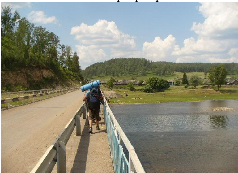
Фото№24 Дорога к д.Устьатавка