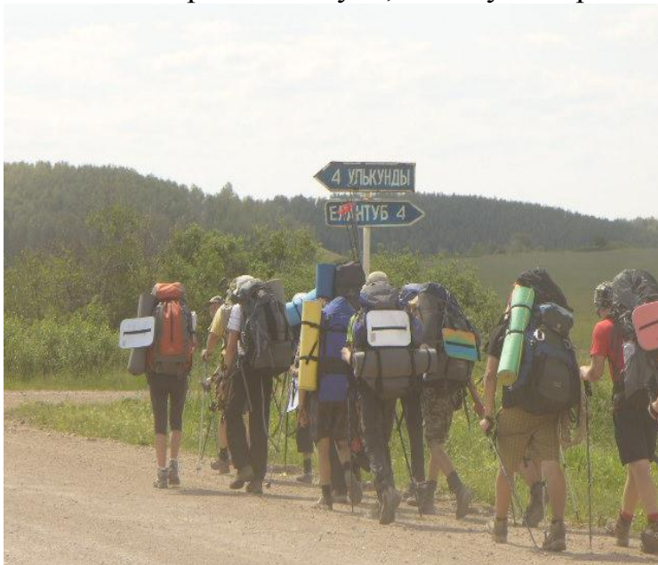
Фото№9 Первый подъём...он трудный самый)