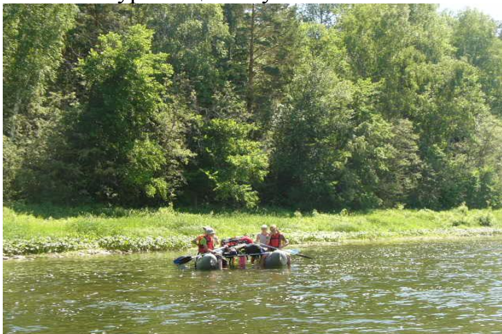
Фото№31 Удобный вход на берег, к нашей стоянке