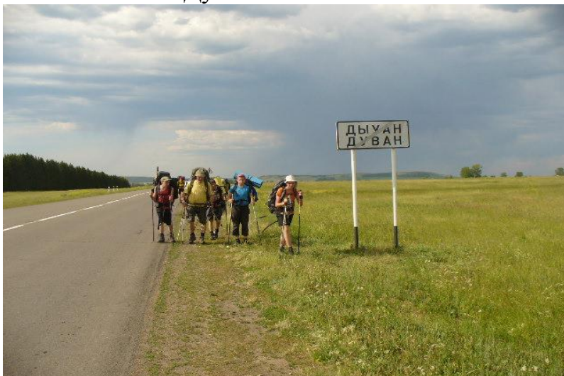
Фото №6 Ипподром, место нашей ночевки.