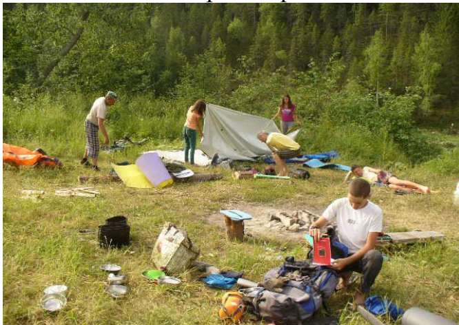
Фото№33 Впереди урочище Елабуга.