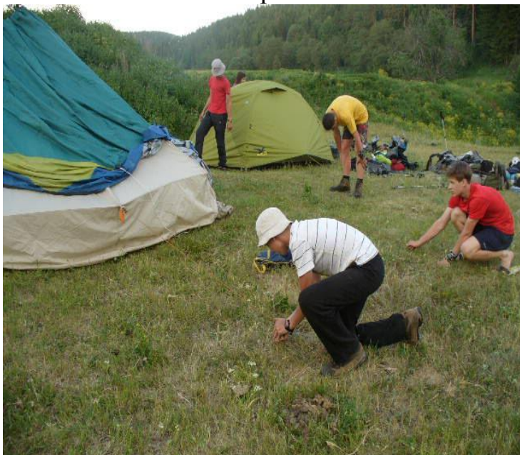
Фото№12 В 10 метрах от лагеря...