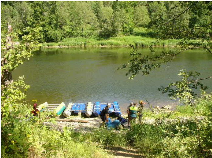
Фото№30 урочище Петуховка