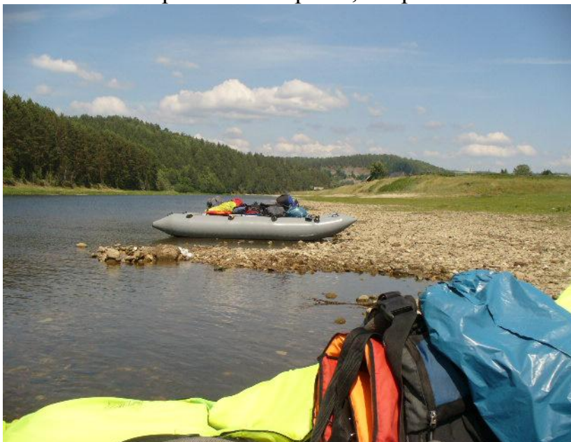
Фото№27 Место нашей стоянки. Стапель, вид сверху.