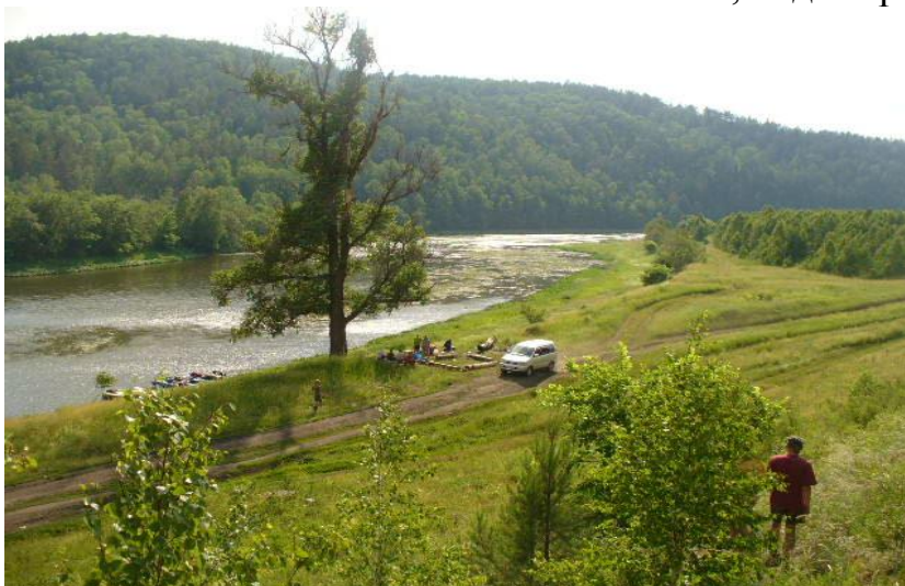
Фото№28 Стоянка около д.Ежовка