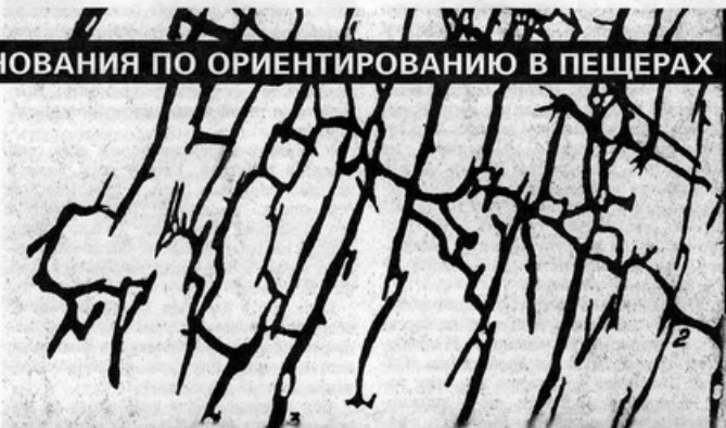
Часть лабиринта пещеры «Млынки», где проходила маркированная трасса. Масштаб — 1 : 2000 (в 1 см — 20 м).

Прошло ещё несколько лет, и вот, в октябре 1978 года у городка Скала-Подольская Тернопольской области состоялся I Всесоюзный слёт спелеологов. И в его программе — Первые Всесоюзные соревнования по ориентированию в пещерах. Обычно я не горел желанием быть участником всяких слётов и прочих массовых действ. Но тут не хотелось упустить возможность впервые попробовать, что же это за блудно — ориентирование в пещерах?