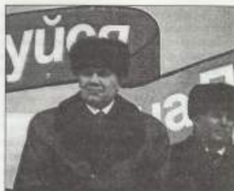
Чемпионат Мира открывает Губернатор Красноярского края Александр Лебедь.

В России накоплен огромный опыт проведения крупных соревнований по лыжному ориентированию. Кубки СССР, Чемпионаты России, этап Кубка Мира, Чемпионат Мира среди юниоров, первый ЧМ среди ветеранов. Но самое крупное событие - «большой» Чемпионат Мира доверен нашим организаторам впервые. Мне хочется поделиться впечатлениями о том, как он прошел в Красноярске, вернее, как он выглядел со стороны, ведь моя позиция журналиста была в общем-то позицией стороннего наблюдателя. Конечно, спортсмены, тренеры, судьи гораздо глубже видели как достоинства, так и недостатки мероприятия, но они были лишены возможности посмотреть на него отстраненно, незаинтересованным взглядом.