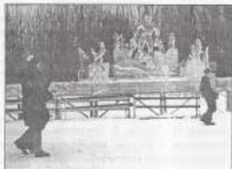
Место награждения украшено традиционными Красноярскими ледяными скульптурами.

Закрытие. Собрав всех участников, тренеров и близких к Чемпионату лиц в театре Музыкальной комедии (можно прикинуть, что в зале присутствовало не меньше