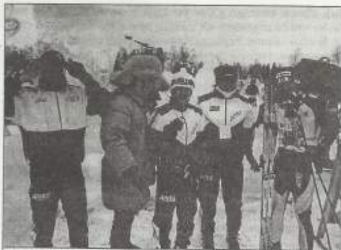
□ Ближе всех в Красноярск было добираться ориентировщикам из Японии.