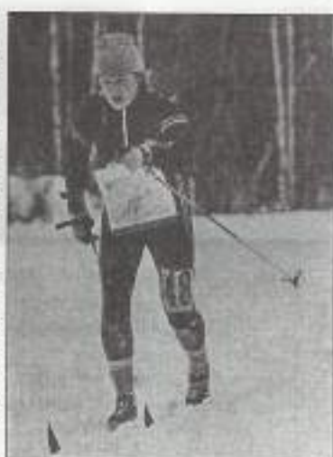
□ Чемпионка мира 2000 года Арья Ханнус соревнуется на лыжне в 1979 году!

Поскольку награждается в Чемпионате Мира не тройка, а шестерка призеров, то надо сказать, что в нее вошли еще -