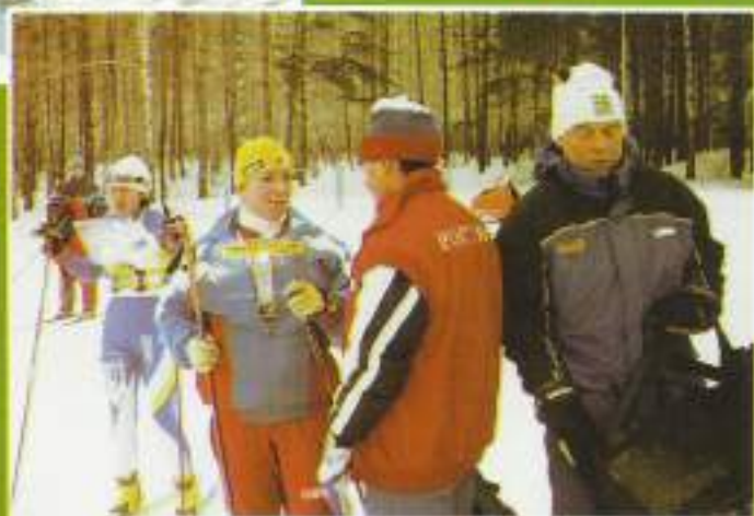
Команды из 18 стран мира поначались разыгрывать эстафетные медали.