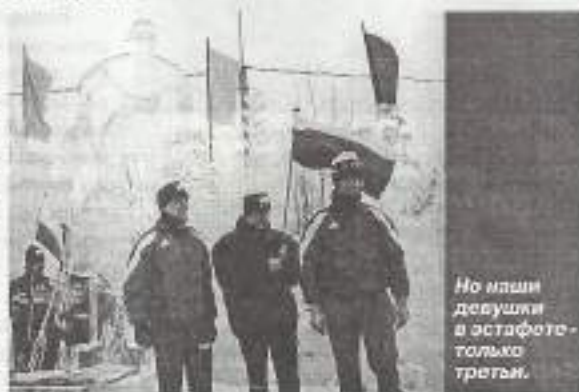
Но наши девушки в эстафете - только третья.

Какие были альтернативные варианты? Альтернативный вариант был. Это - Ханты-Мансийск. Я сам его прорабатывал. Губернатор согласие дал. Какими силами его можно было проводить? Я предлагал и уже собрал службу дистанции и туда уже выехал А. Глушко, которого здесь нет по вполне понятным причинам. Ведь если международный инспектор сам планирует все дистанции - это