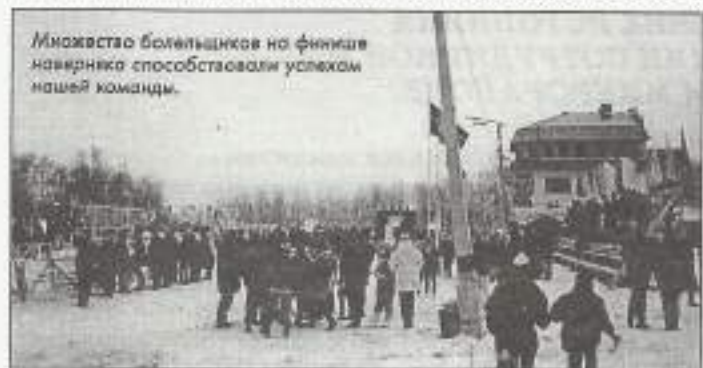
Множество болельщиков на финише наверняка способствовали успехам нашей команды.