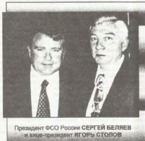
Президент ФСО России СЕРГЕЙ БЕЛЯЕВ и вице-президент ИГОРЬ СТОЛОВ

• Международная Ассоциация Мировых Игр (IWGA) и организаторы Игр одобрили предложение ИОФ о включении в программу 3 соревнований: индивидуальные соревнования для мужчин, для женщин и смешанную эстафету с равным количеством мужчин и женщин. Соревнования намечены на 18 и 19 августа с тренировочным стартом в предыдущий день. На сегодня 13 стран равно готовы для соревнований по ориентированию на Мировых Играх. На базе результатов эстафет Чемпионата Мира 1999 года 12 стран квалифицированы выставить команды из 2 мужчин и 2 женщин. Это: Норвегия, Финляндия,