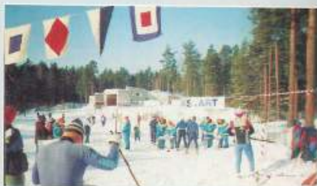
Первый Чемпионат Мира среди ветеранов состоялся в Лемболово, под Санкт-Петербургом.