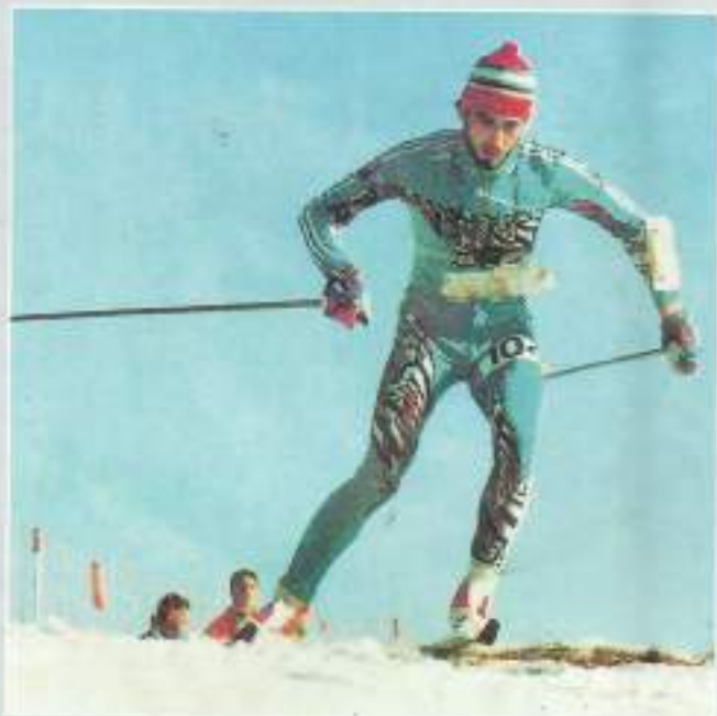
ВИКТОР КОРЧАГИН — 2-й российский чемпион мира в личном зачете и 2-й Заслуженный мастер спорта России. Фото: 1-го российского чемпиона мира в личном зачете и 1-го Заслуженного мастера спорта России ИВАНА КУЗЬМИНА .