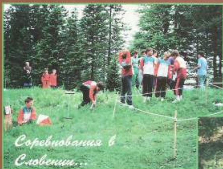
Соревнования в Словении...