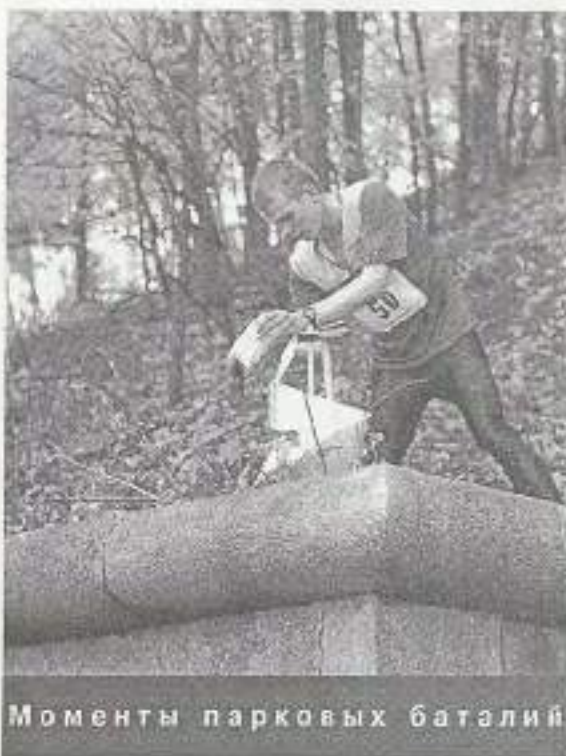
Моменты парковых баталий