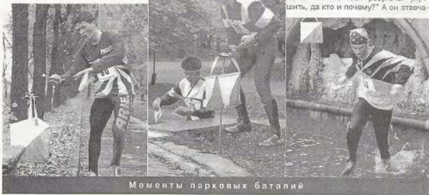
Моменты парковых баталий

Не успел он еще отдышаться, а я тот самый вопросик ему задал: – "А может ли кто твой результат улучшить, да кто и почему?" А он отвеча-