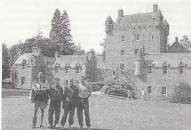
Шотландия – это не только чемпионат мира это Шотландия

В.К. – В этом году произошла неприятная накладка – чемпионат мира в Шотландии и Всемирные армейские игры в Хорватии проходили почти одновременно. Почти все сильнейшие российские ориентировщики являются военнослужащими и потому обязаны были участвовать в армейских соревнованиях.