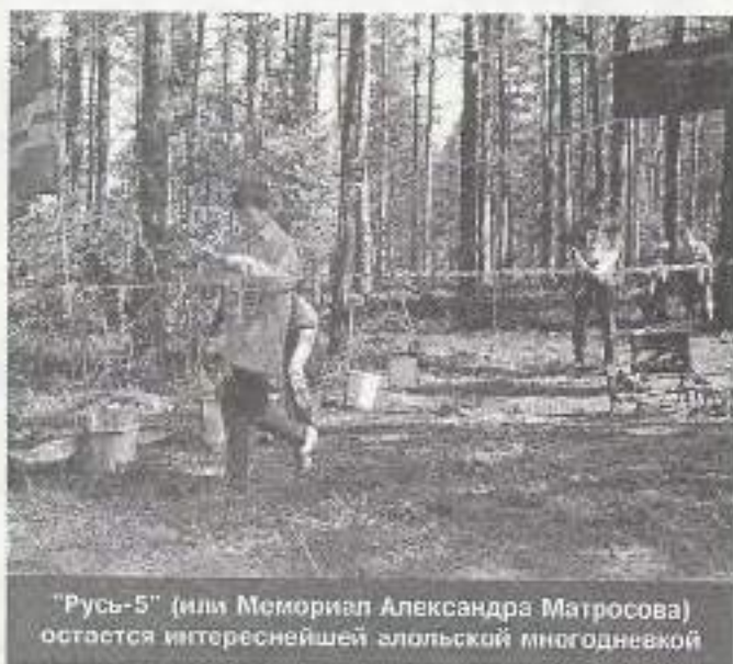
“Русь-5” (или Мемориал Александра Матросова) остается интереснейшей зальской многодневкой