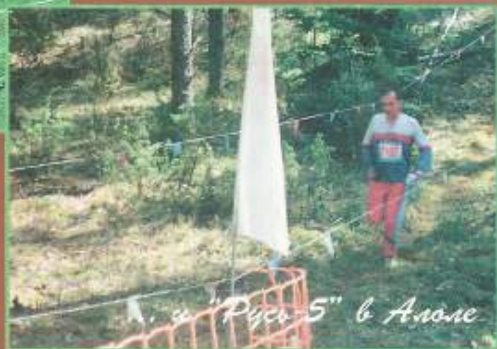
на "Риса-5" в Аноре