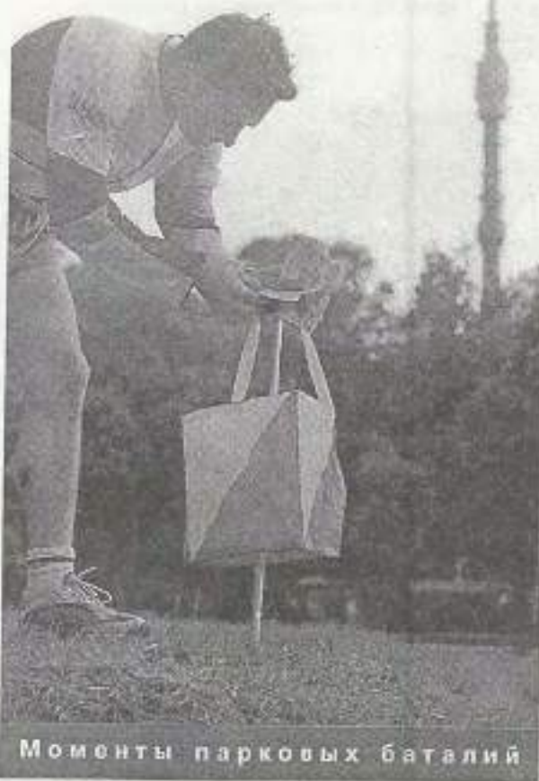
Моменты парковых баталий

Мы обрадовались – наконец-то будем делать классные соревнования, да еще и парковые! Московский международный марафон мира (ММММ) – это ведь не только марафон, а целый комплекс беговых стартов.