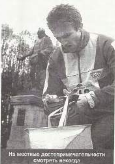
На местные достопримечательности смотреть некогда