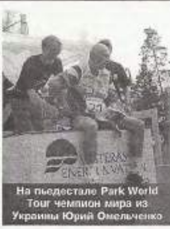
На пьедестале Park World Tour чемпион мира из Украины Юрий Омельченко

* Швед Йорген Мортенссон утверждает, что включение этапов паркового ориентирования в зачет Кубка мира 2000 года повлияет исключительно положительно на развитие мирового ориентирования, а норвежец Петтер Торсен считает, что включение шведской 5-дневки O'RINGEN в зачет Кубка мира 1998 года было неудачным. Англичанка Иветта Хагью уверяет, что 90% элитных ориентировщиков предпочитает традиционное "лесное" ориентирование.