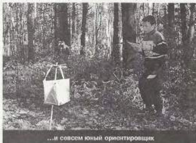
...и совсем юный ориентировщик.

говорит, мне столько раз машину перенастраивать, да столько разных легенд ксерить?" А у меня, после этой лошадиной скачки, и сил не осталось – за грудки его взять.