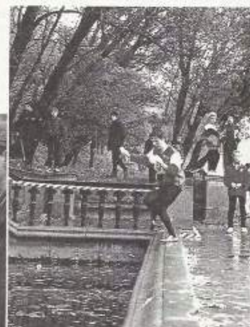
Это – не барьерный бег, а обычное парковое ориентирование