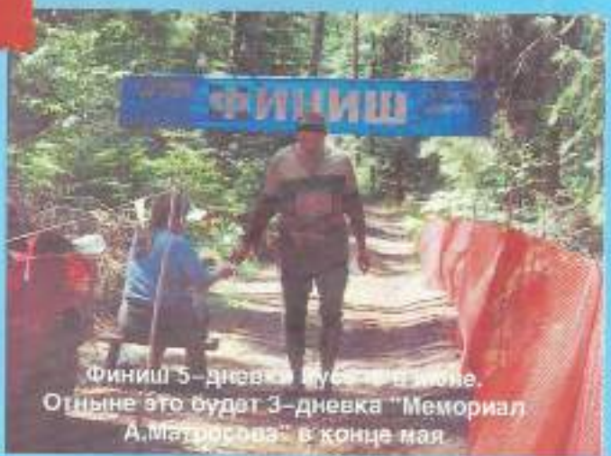
Финиш 5-дневки в Лусе в Швеции. Отныне это будет 3-дневка "Мемориал А.Матросова" в конце мая.