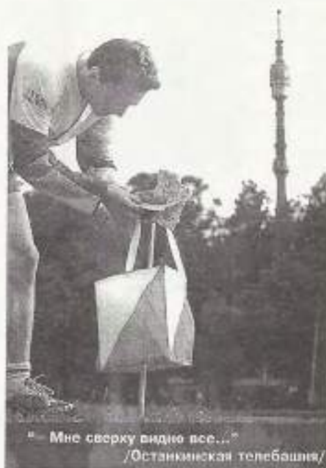
« Мне сверху видно все... » /Останкинская телебашня/