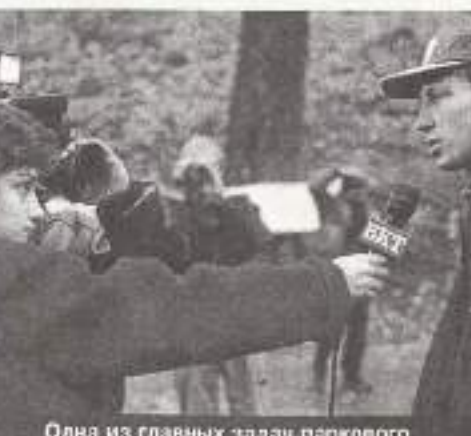
Одна из главных задач паркового ориентирования – привлечение внимания телевидения и прессы к нашему виду спорта