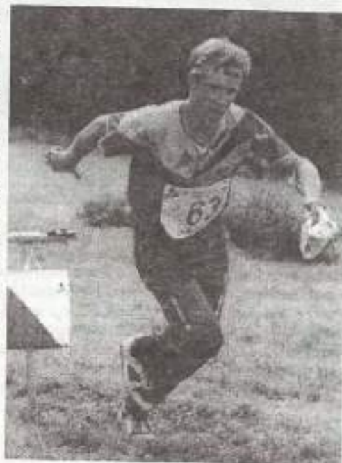
На снимке: 3-х кратный победитель О'РИНГЕНА Йорген Мортенссон

Много материалов посвящено отмеченному в этом году 100-летию ориентирования. Интересные даты развития нашего вида спорта приводятся на страницах "Orienteering World":